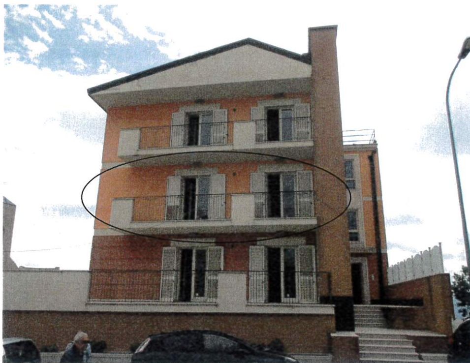
fronte ingresso prospiciente Via Ciardelli

Via Cremona n.17, 83020 San Michele di Serino (AV) cell. 3477568754 , email car.devita@libero.it , pec. carmine.devita@archiworldpec.it