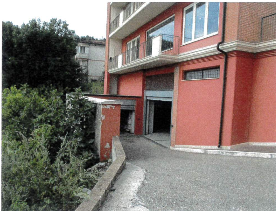
Lato posteriore fronte ingresso garage