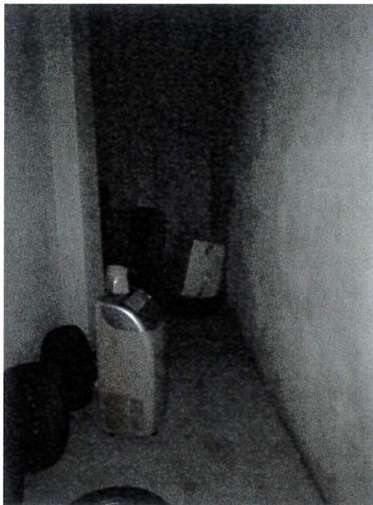
Lotto 6 deposito, p.lla 1424, sub 11