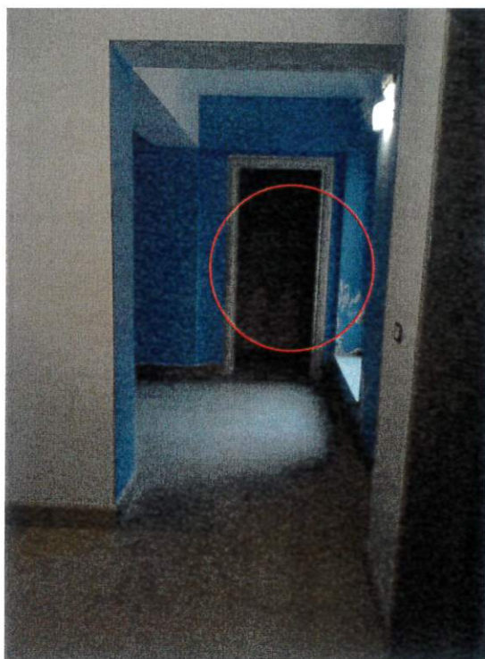
pianerottolo di ingresso con porta frontale deposito