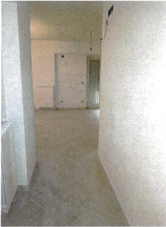
Lotto 6, abitazione p.IIa 1424 sub 17