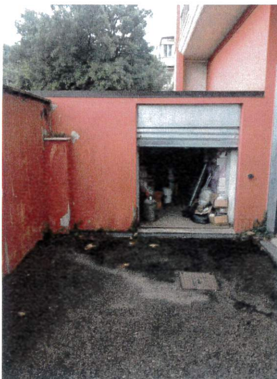
Lotto 6, autorimessa esterna p.lla 1424, sub 4