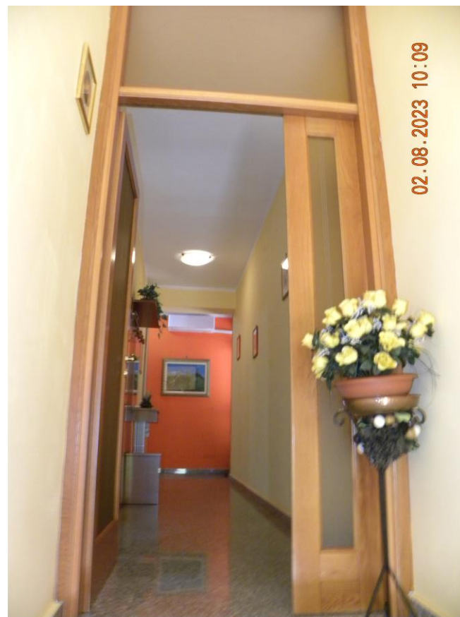
viste interne sub 3