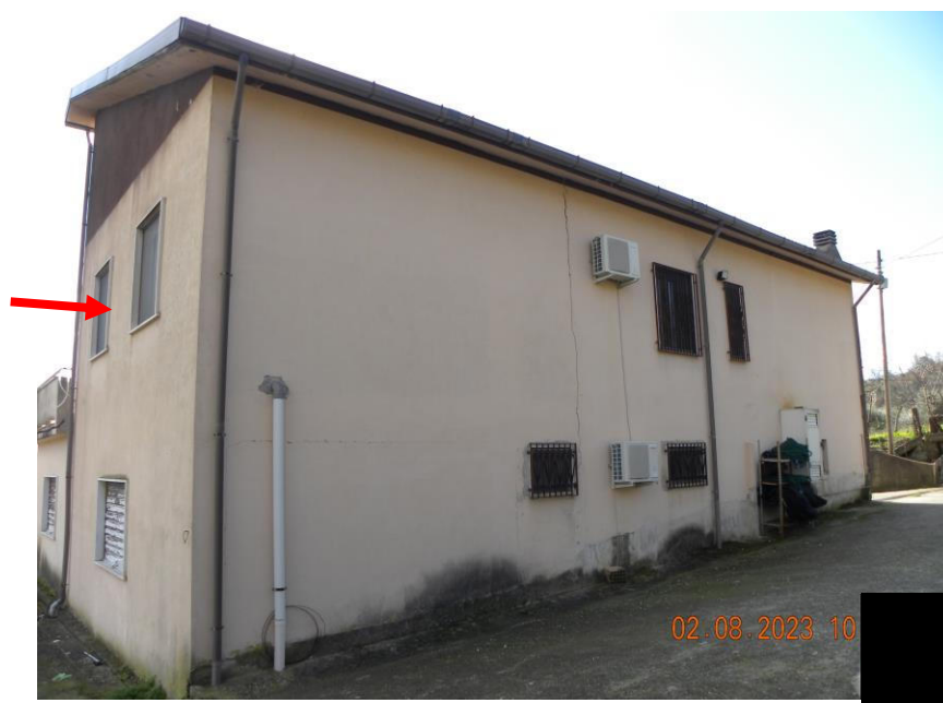
viste esterne fabbricato dalla corte comune (3)