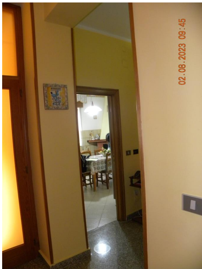
viste interne sub 3 (26)

Il bene oggetto della procedura esecutiva è un appartamento in Comune di Contursi Terme (SA) località Contrada Lauri snc, sito al pino primo di un fabbricato indipendente identificato rispettivamente al N.C.E.U. di Contursi Terme (SA) al foglio n.17 particella n.385 sub 3 cat. A3 classe 2 consistenza 10 vani sup. catastale 175 mq, rendita 748,86 euro.