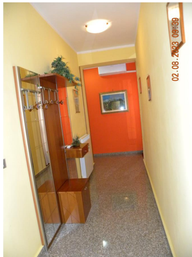
viste interne sub 3 (17)