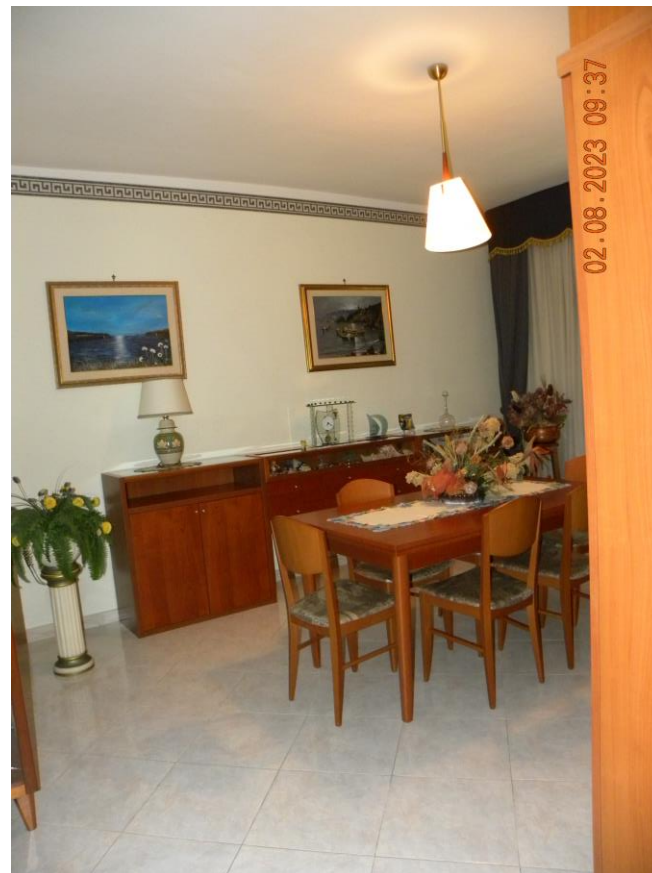
viste interne sub 3 (13)