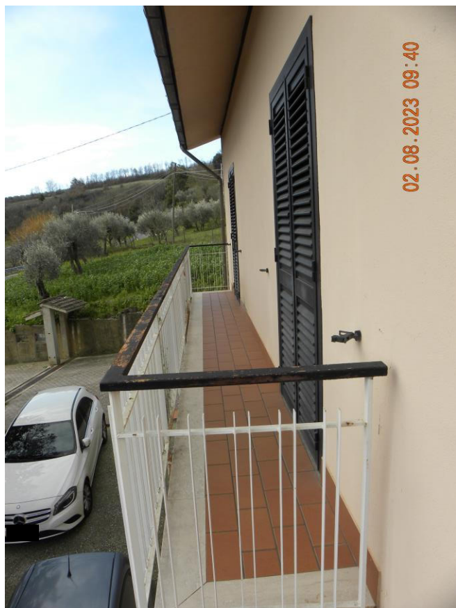
terrazzo-balcone sub 3 (1)

Il bene oggetto della procedura esecutiva è un appartamento in Comune di Contursi Terme (SA) località Contrada Lauri snc, sito al pino primo di un fabbricato indipendente identificato rispettivamente al N.C.E.U. di Contursi Terme (SA) al foglio n.17 particella n.385 sub 3 cat. A3 classe 2 consistenza 10 vani sup. catastale 175 mq, rendita 748,86 euro.