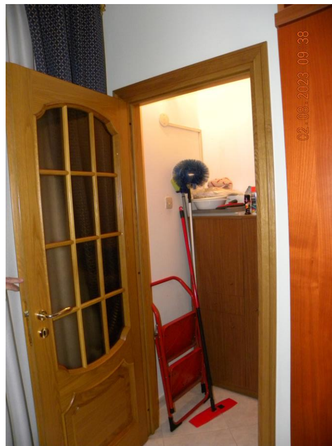
viste interne sub 3 (15)