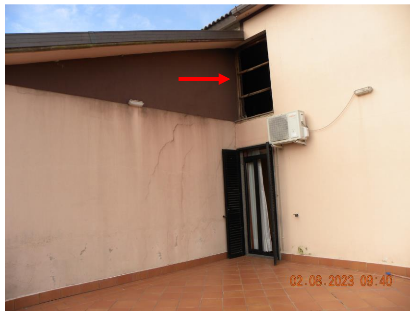
terrazzo-balcone sub 3 (2)