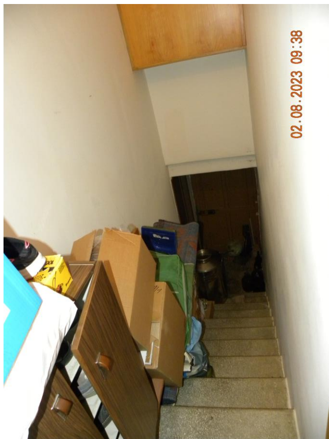
viste interne sub 3 collegamento funzionale al piano terra difforme (14)

Il bene oggetto della procedura esecutiva è un appartamento in Comune di Contursi Terme (SA) località Contrada Lauri snc, sito al pino primo di un fabbricato indipendente identificato rispettivamente al N.C.E.U. di Contursi Terme (SA) al foglio n.17 particella n.385 sub 3 cat. A3 classe 2 consistenza 10 vani sup. catastale 175 mq, rendita 748,86 euro.