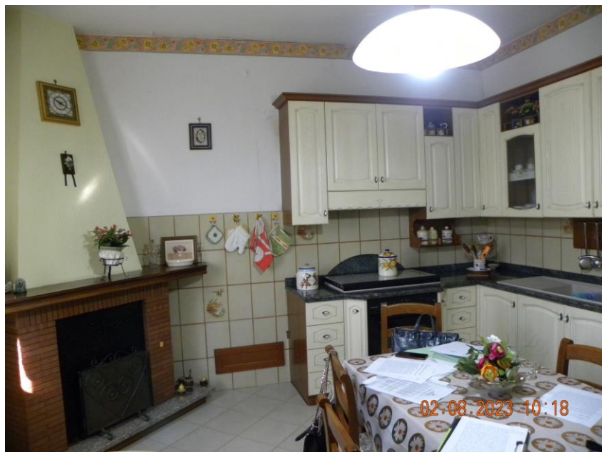
viste interne sub 3 (29)

Il bene oggetto della procedura esecutiva è un appartamento in Comune di Contursi Terme (SA) località Contrada Lauri snc, sito al pino primo di un fabbricato indipendente identificato rispettivamente al N.C.E.U. di Contursi Terme (SA) al foglio n.17 particella n.385 sub 3 cat. A3 classe 2 consistenza 10 vani sup. catastale 175 mq, rendita 748,86 euro.