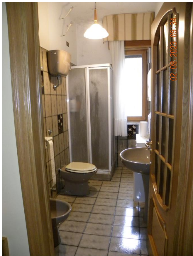
viste interne sub 3 (3)

Il bene oggetto della procedura esecutiva è un appartamento in Comune di Contursi Terme (SA) località Contrada Lauri snc, sito al pino primo di un fabbricato indipendente identificato rispettivamente al N.C.E.U. di Contursi Terme (SA) al foglio n.17 particella n.385 sub 3 cat. A3 classe 2 consistenza 10 vani sup. catastale 175 mq, rendita 748,86 euro.