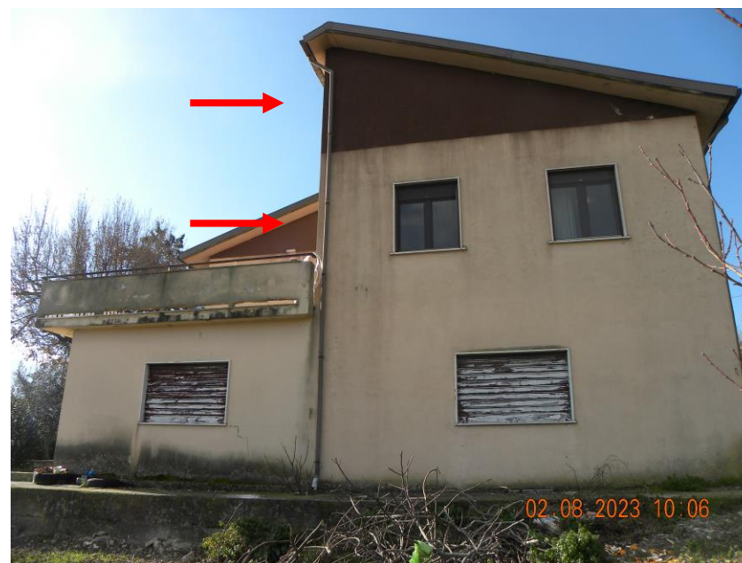
viste esterne sub 3 (1)