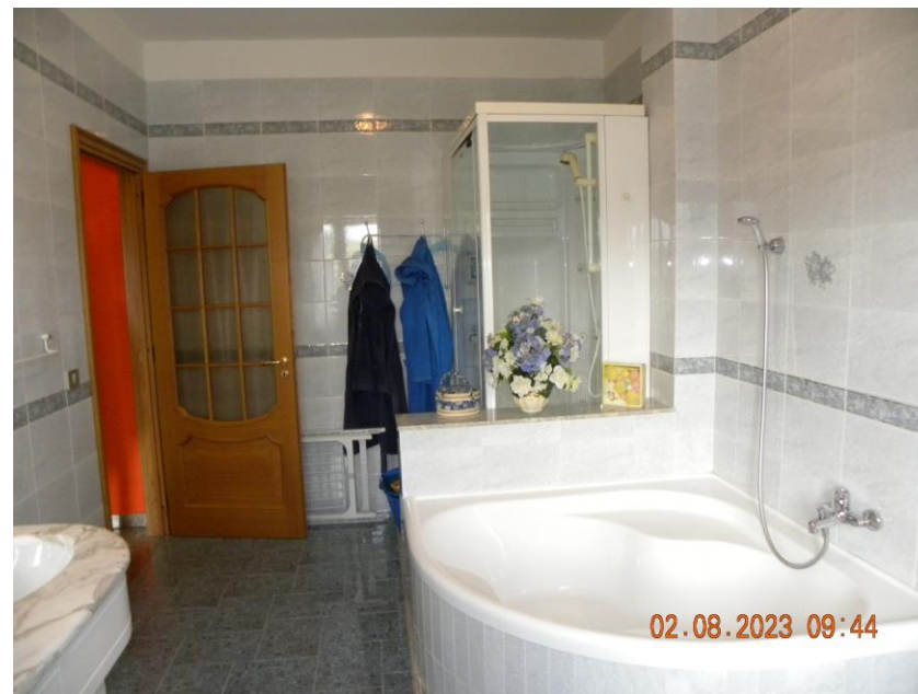
viste interne sub 3 (23)