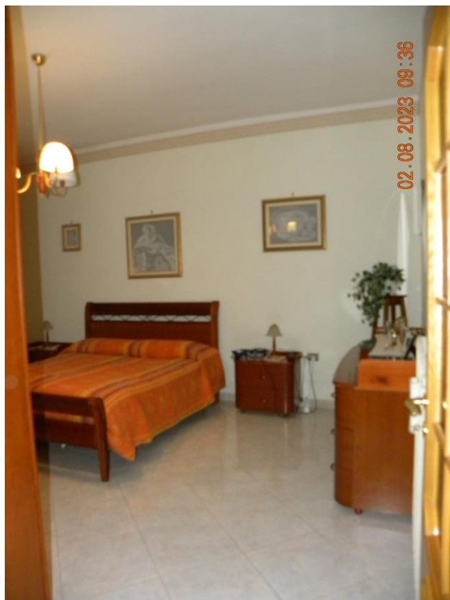
viste interne sub 3 (10)

Il bene oggetto della procedura esecutiva è un appartamento in Comune di Contursi Terme (SA) località Contrada Lauri snc, sito al pino primo di un fabbricato indipendente identificato rispettivamente al N.C.E.U. di Contursi Terme (SA) al foglio n.17 particella n.385 sub 3 cat. A3 classe 2 consistenza 10 vani sup. catastale 175 mq, rendita 748,86 euro.