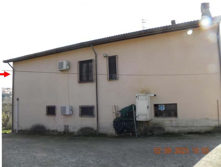
viste esterne fabbricato dalla corte comune (2)

Il bene oggetto della procedura esecutiva è un appartamento in Comune di Contursi Terme (SA) località Contrada Lauri snc, sito al pino primo di un fabbricato indipendente identificato rispettivamente al N.C.E.U. di Contursi Terme (SA) al foglio n.17 particella n.385 sub 3 cat. A3 classe 2 consistenza 10 vani sup. catastale 175 mq, rendita 748,86 euro.