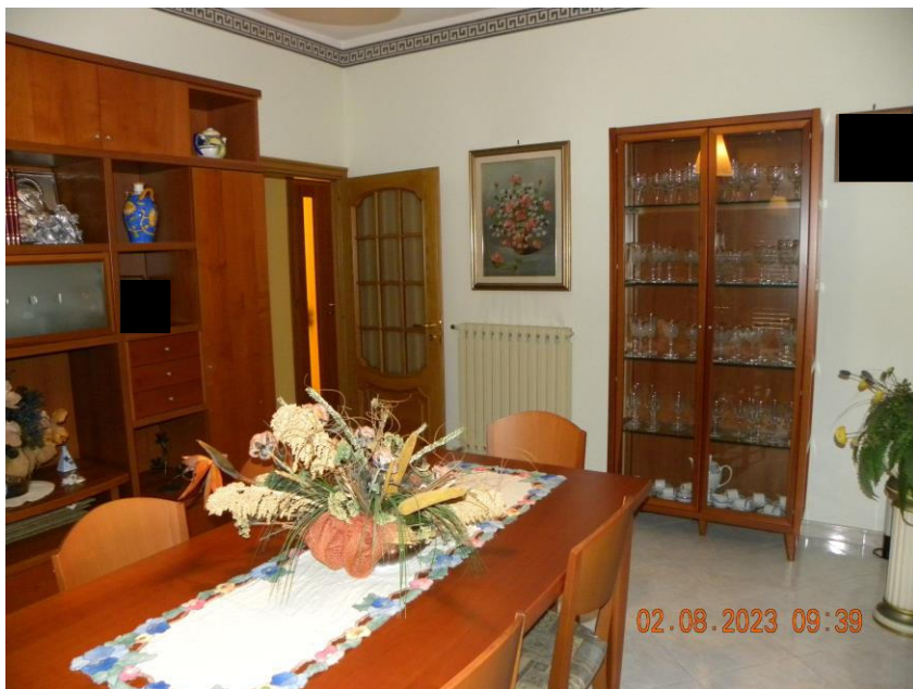
viste interne sub 3 (16)

Il bene oggetto della procedura esecutiva è un appartamento in Comune di Contursi Terme (SA) località Contrada Lauri snc, sito al pino primo di un fabbricato indipendente identificato rispettivamente al N.C.E.U. di Contursi Terme (SA) al foglio n.17 particella n.385 sub 3 cat. A3 classe 2 consistenza 10 vani sup. catastale 175 mq, rendita 748,86 euro.