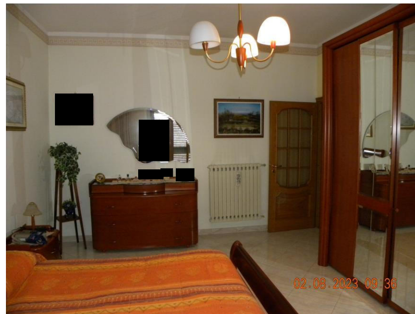
viste interne sub 3 (11)