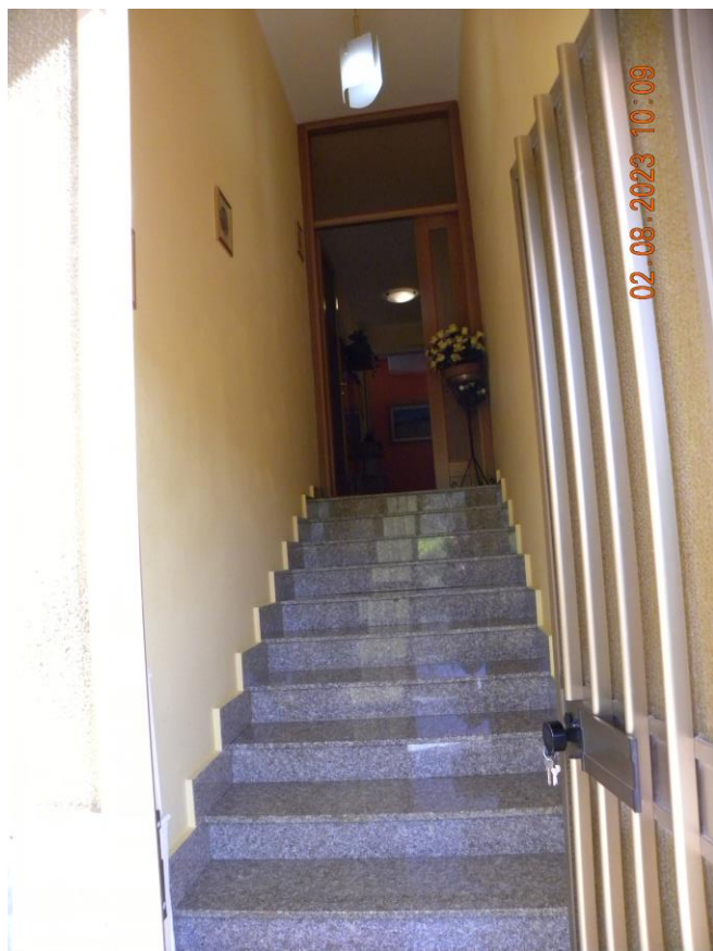
scala d'accesso al pp

Il bene oggetto della procedura esecutiva è un appartamento in Comune di Contursi Terme (SA) località Contrada Lauri snc, sito al pino primo di un fabbricato indipendente identificato rispettivamente al N.C.E.U. di Contursi Terme (SA) al foglio n.17 particella n.385 sub 3 cat. A3 classe 2 consistenza 10 vani sup. catastale 175 mq, rendita 748,86 euro.