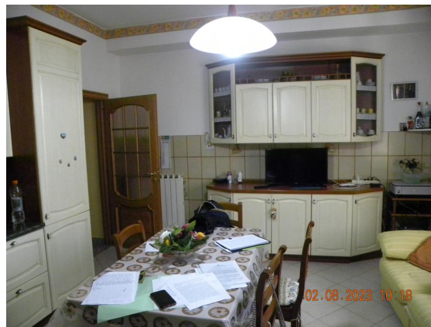
viste interne sub 3 (1)