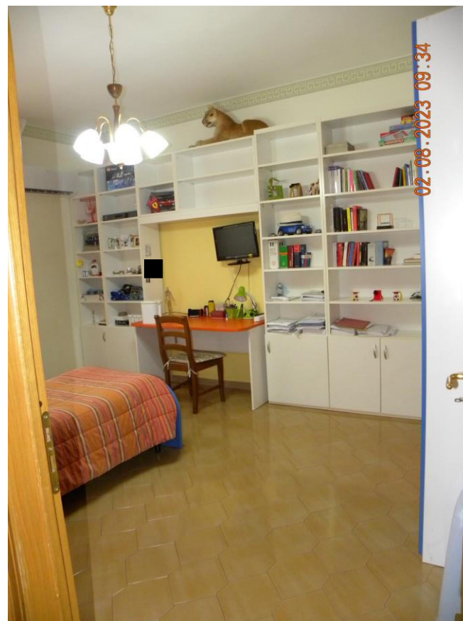
viste interne sub 3 (6)