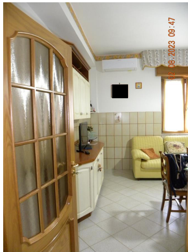
viste interne sub 3 (27)