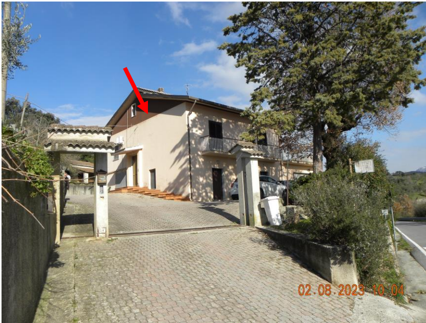
viste esterne fabbricato dalla SS91

Il bene oggetto della procedura esecutiva è un appartamento in Comune di Contursi Terme (SA) località Contrada Lauri snc, sito al pino primo di un fabbricato indipendente identificato rispettivamente al N.C.E.U. di Contursi Terme (SA) al foglio n.17 particella n.385 sub 3 cat. A3 classe 2 consistenza 10 vani sup. catastale 175 mq, rendita 748,86 euro.