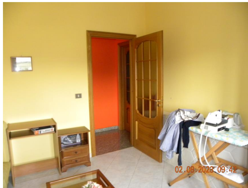
viste interne sub 3 (21)