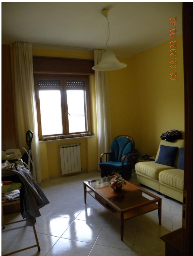
viste interne sub 3 (20)

Il bene oggetto della procedura esecutiva è un appartamento in Comune di Contursi Terme (SA) località Contrada Lauri snc, sito al pino primo di un fabbricato indipendente identificato rispettivamente al N.C.E.U. di Contursi Terme (SA) al foglio n.17 particella n.385 sub 3 cat. A3 classe 2 consistenza 10 vani sup. catastale 175 mq, rendita 748,86 euro.