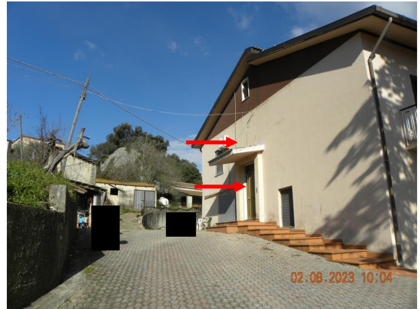
viste esterne fabbricato dalla corte comune (1)