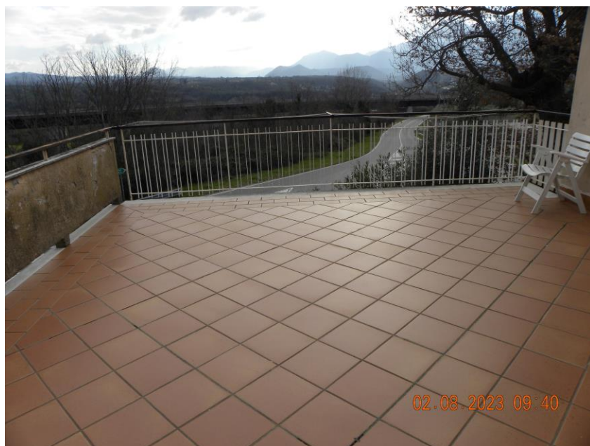
terrazzo-balcone sub 3 (3)

Il bene oggetto della procedura esecutiva è un appartamento in Comune di Contursi Terme (SA) località Contrada Lauri snc, sito al pino primo di un fabbricato indipendente identificato rispettivamente al N.C.E.U. di Contursi Terme (SA) al foglio n.17 particella n.385 sub 3 cat. A3 classe 2 consistenza 10 vani sup. catastale 175 mq, rendita 748,86 euro.