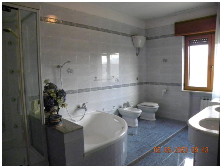
viste interne sub 3 (22)

Il bene oggetto della procedura esecutiva è un appartamento in Comune di Contursi Terme (SA) località Contrada Lauri snc, sito al pino primo di un fabbricato indipendente identificato rispettivamente al N.C.E.U. di Contursi Terme (SA) al foglio n.17 particella n.385 sub 3 cat. A3 classe 2 consistenza 10 vani sup. catastale 175 mq, rendita 748,86 euro.