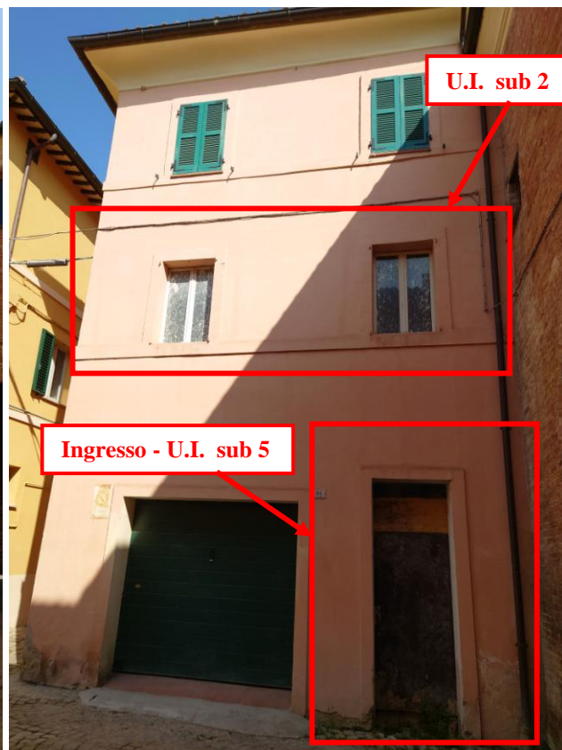
Foto 1 – Viste esterne immobile – lato via G. Venezian (29/05/2023)