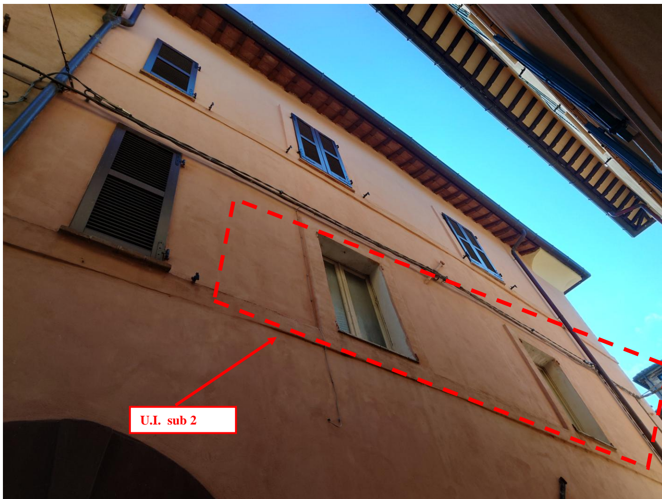
Foto 3 – Vista esterna immobile – lato via Vicolo Lozzo (29/05/2023)