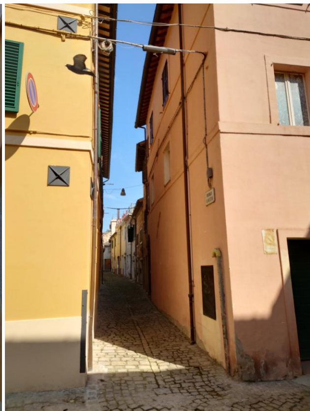
Foto 2 – Viste esterne immobile – lato via Vicolo Lozzo (29/05/2023)