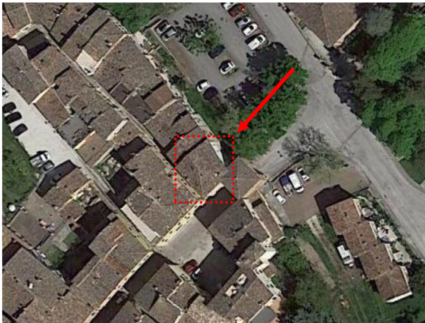
Vista aerea, via G. Venezian 84, 62024 – Matelica (MC)