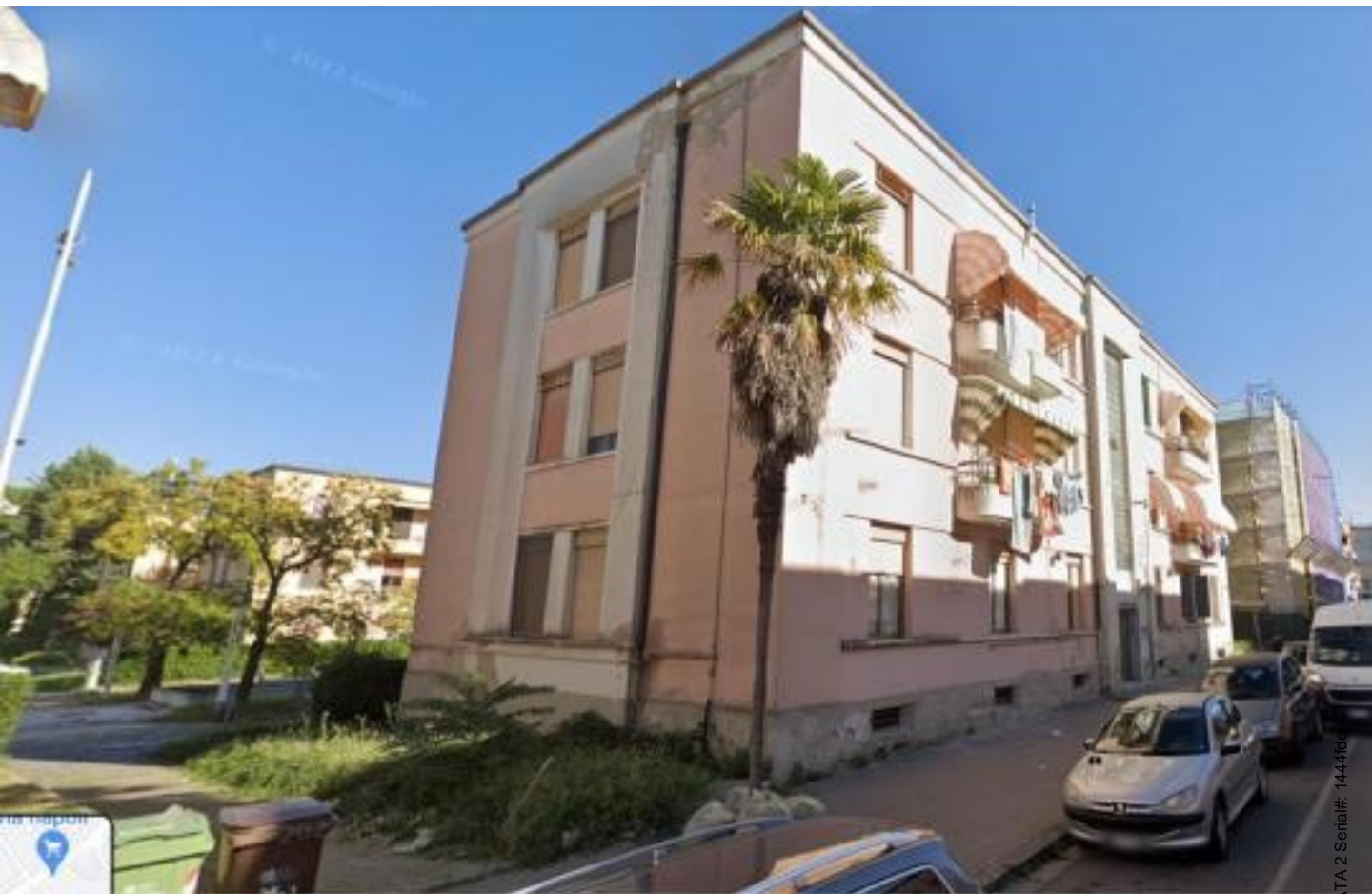
Foto n.4: Foto del palazzo dove insiste al 3 piano l' appartamento in Via Cesare Battisti n. 6 a Benevento NCEU al foglio 93 particella 102 sub 11.