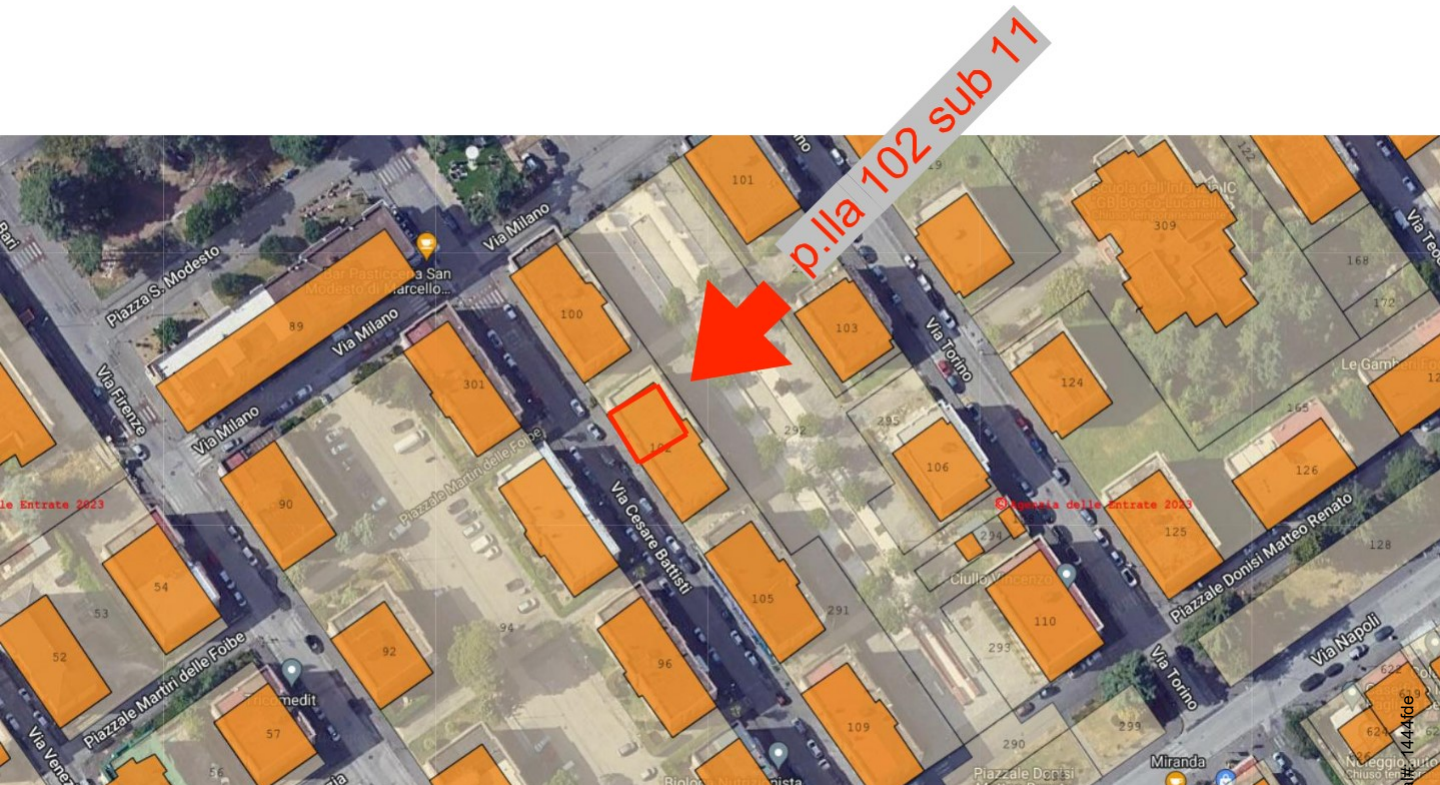
Foto n.3: Estratto di Mappa NCEU del palazzo dove insiste al 3 piano l'appartamento in Via Cesare Battisti n. 6 a Benevento NCEU al foglio 93 particella 102 sub 11.