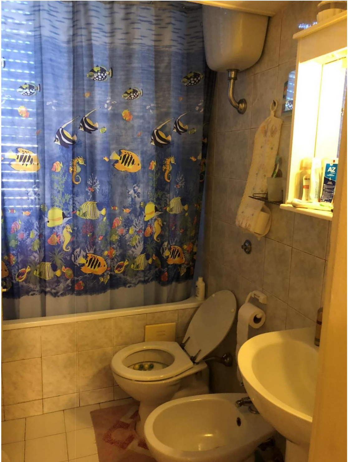
Foto n.13: Foto del bagno dell'appartamento in Benevento NCEU al foglio 93 particella 102 sub 11.