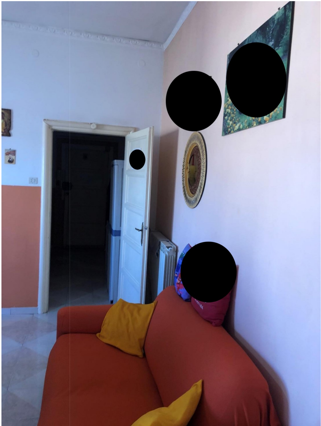
Foto n.8: Foto della cucina soggiorno dell'appartamento in Benevento NCEU al foglio 93 particella 102 sub 11.