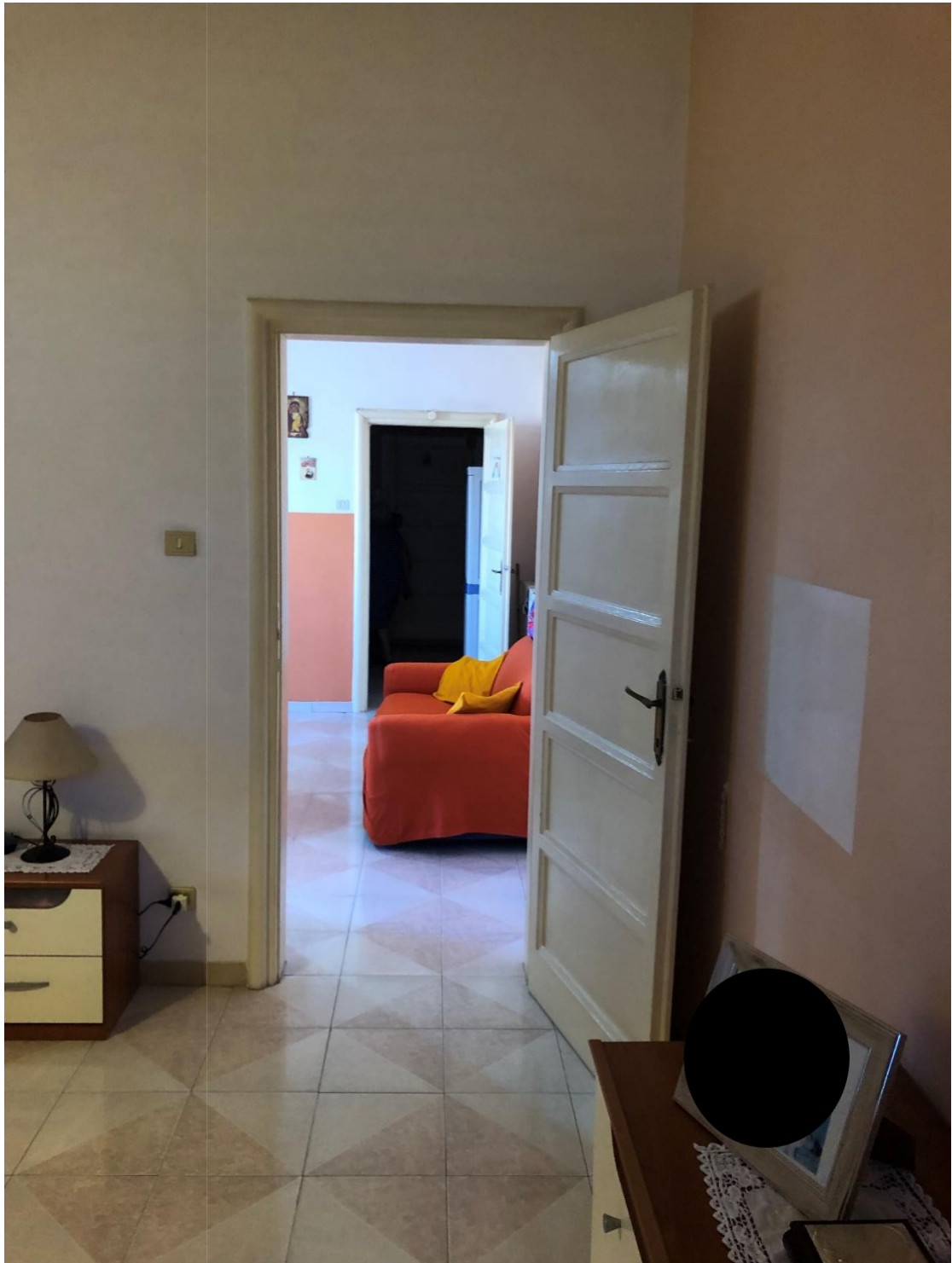
Foto n.7: Foto dell'appartamento in Benevento NCEU al foglio 93 particella 102 sub 11.