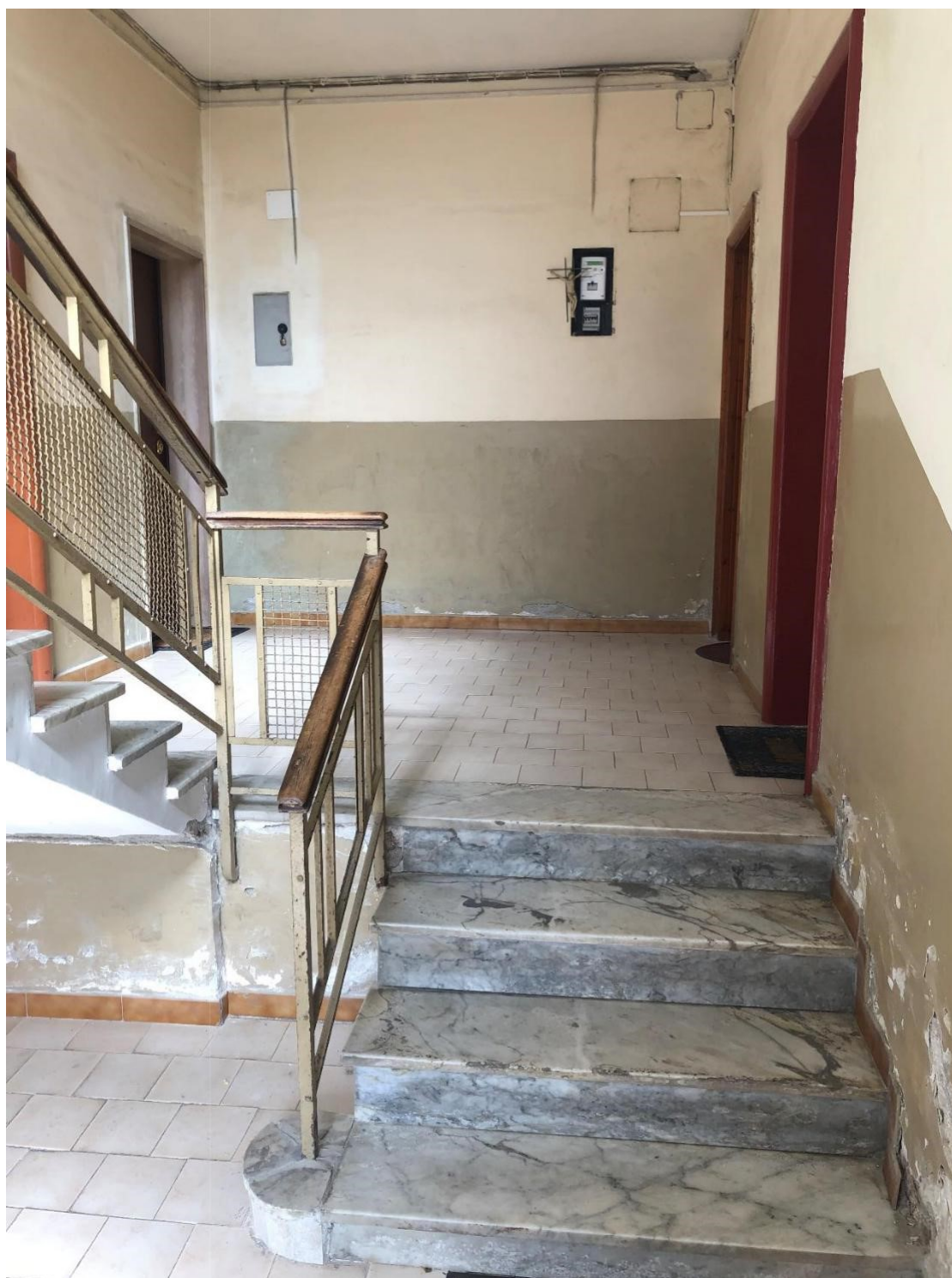
Foto n.6: Foto dell'ingresso alle scale dell'appartamento in Via Cesare Battisti n. 6 a Benevento NCEU al foglio 93 particella 102 sub 11.