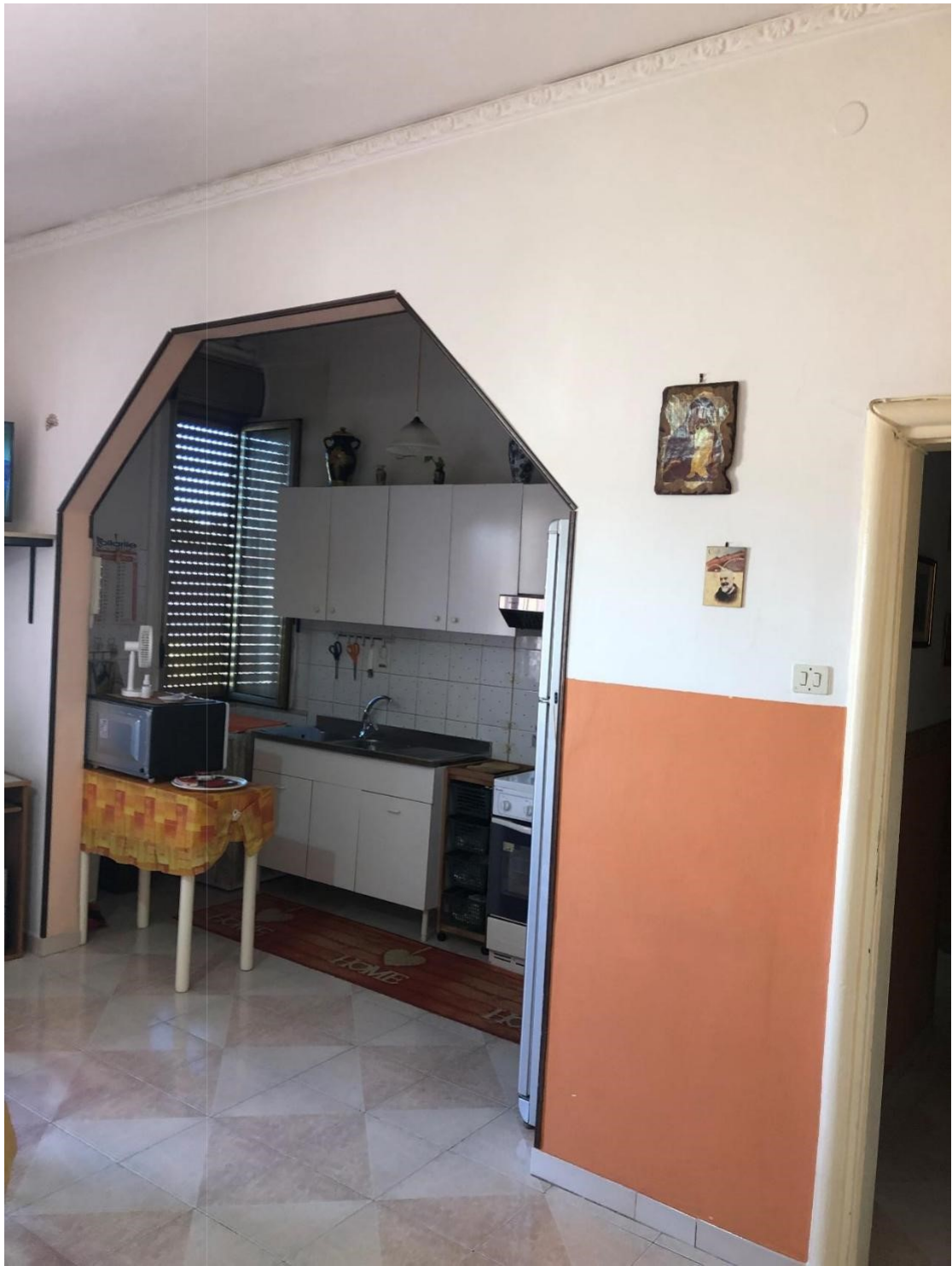
Foto n.9: Foto della cucina dell'appartamento in Benevento NCEU al foglio 93 particella 102 sub 11.