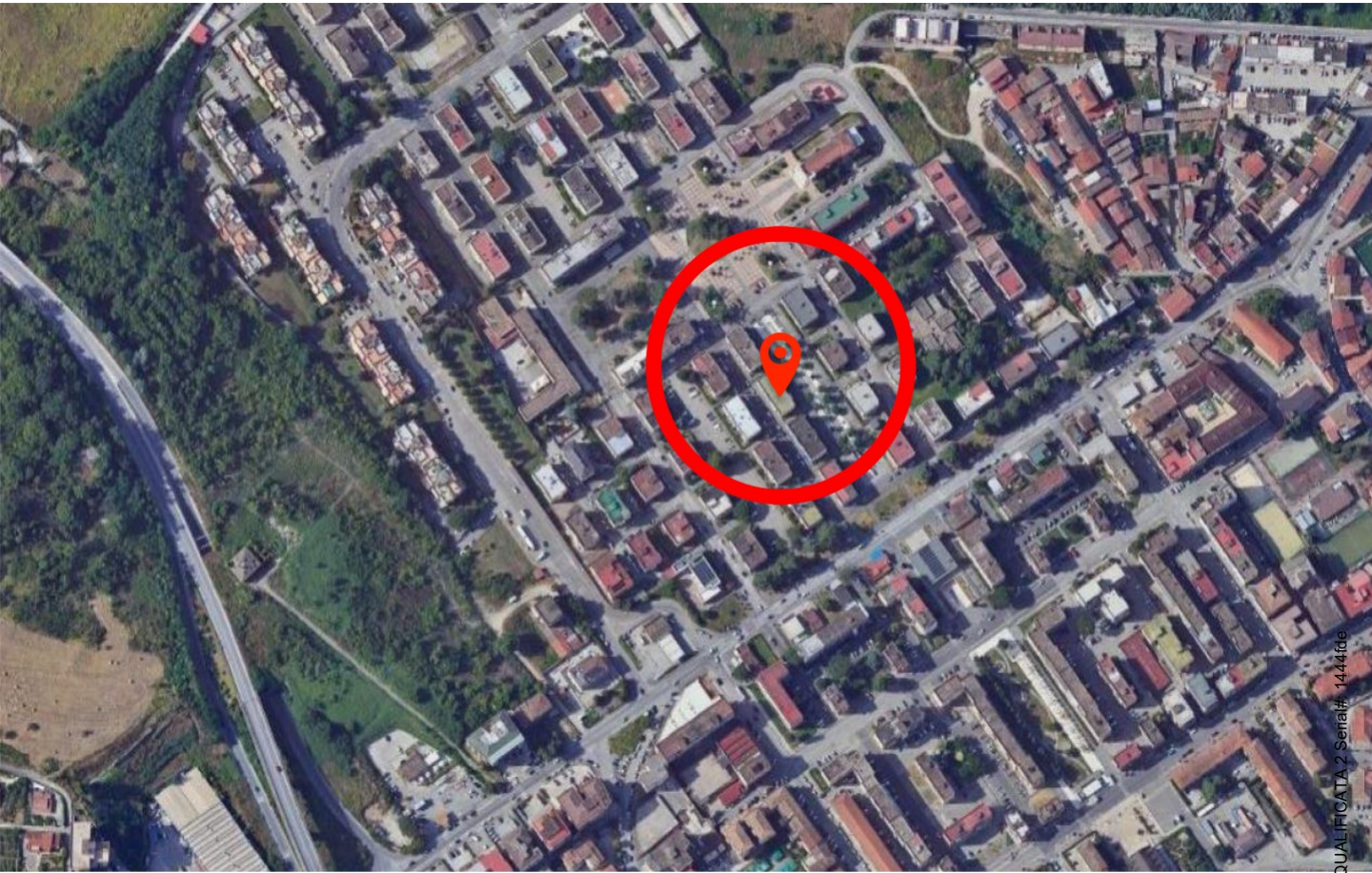
Foto n.1: Aerofoto del palazzo dove insiste al 3 piano l'appartamento in Via Cesare Battisti n. 6 a Benevento NCEU al foglio 93 particella 102 sub 11.