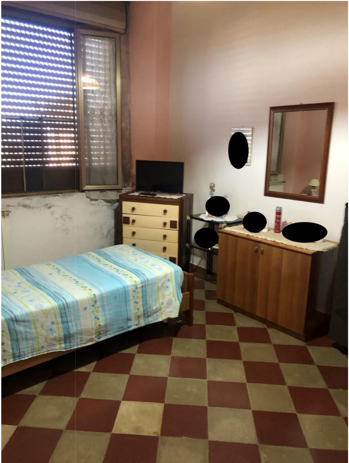
Foto n.12: Foto della stanza singola dell'appartamento in Benevento NCEU al foglio 93 particella 102 sub 11.