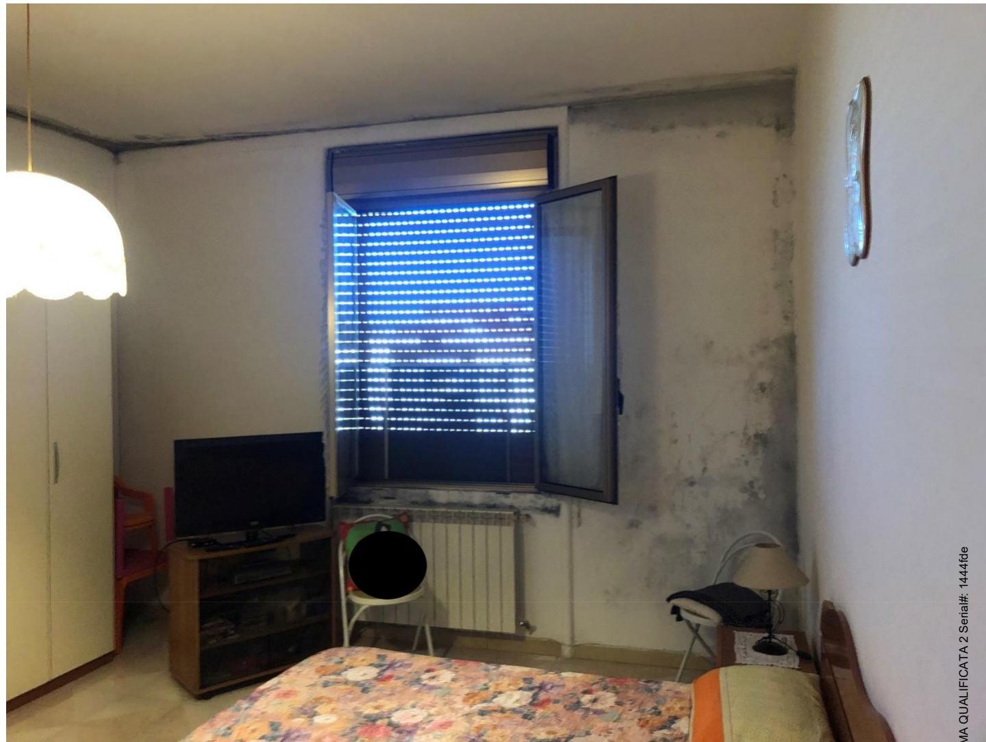
Foto n.11: Foto della stanza matrimoniale dell'appartamento in Benevento NCEU al foglio 93 particella 102 sub 11.