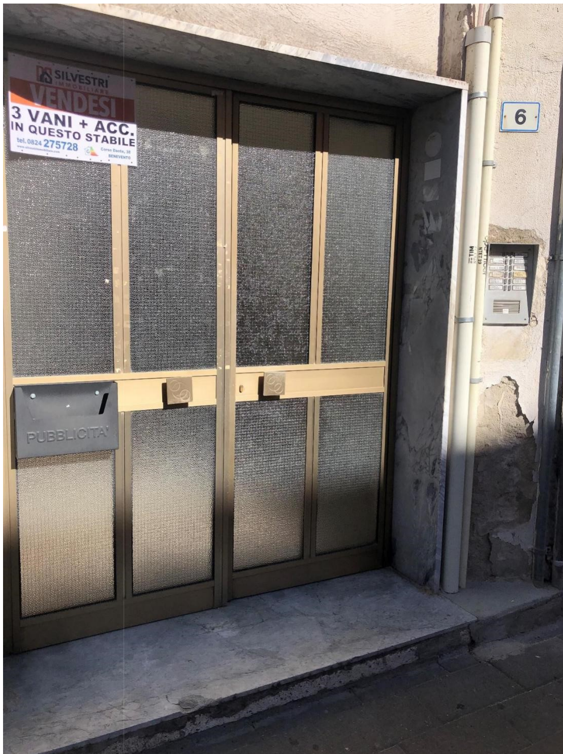
Foto n.5: Foto dell'accesso del palazzo dove insiste al 3 piano l'appartamento in Via Cesare Battisti n. 6 a Benevento NCEU al foglio 93 particella 102 sub 11.