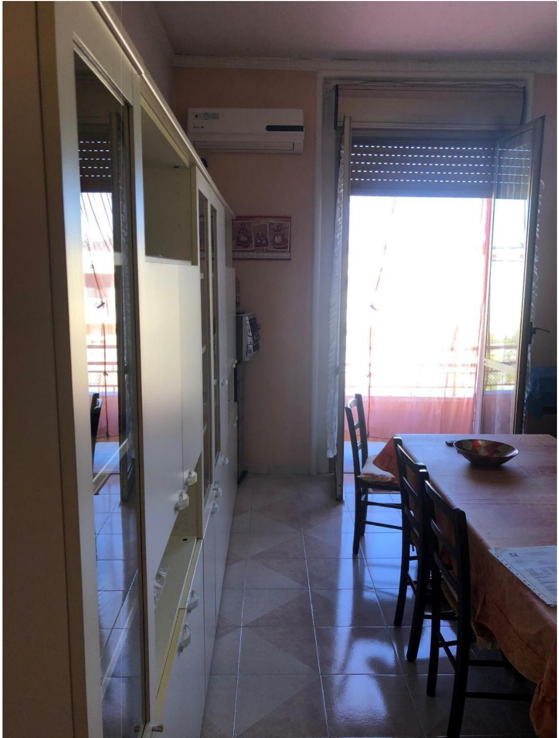
Foto n.10: Foto della cucina pranzo dell'appartamento in Benevento NCEU al foglio 93 particella 102 sub 11.