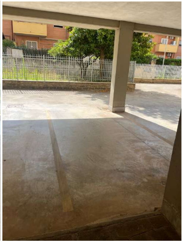
Foto 5 e 6 Androne di ingresso scala B e posto auto int.9