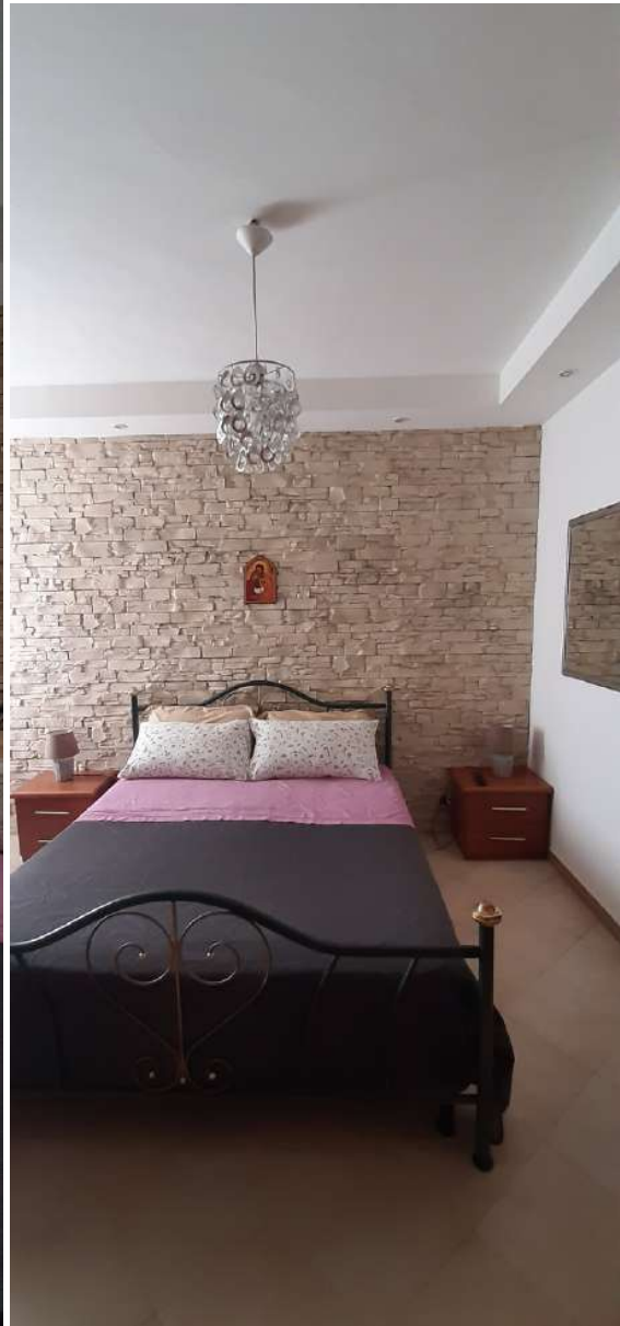
Foto 18 e 19 camera da letto