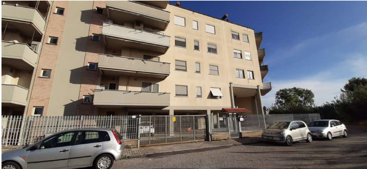
Foto 2 Vista esterna edificio al civico 2, scala B sulla destra