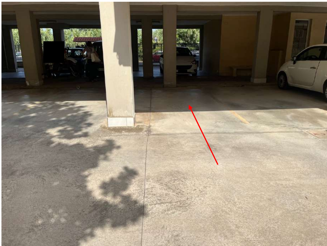
Foto 7 Posto auto int.9