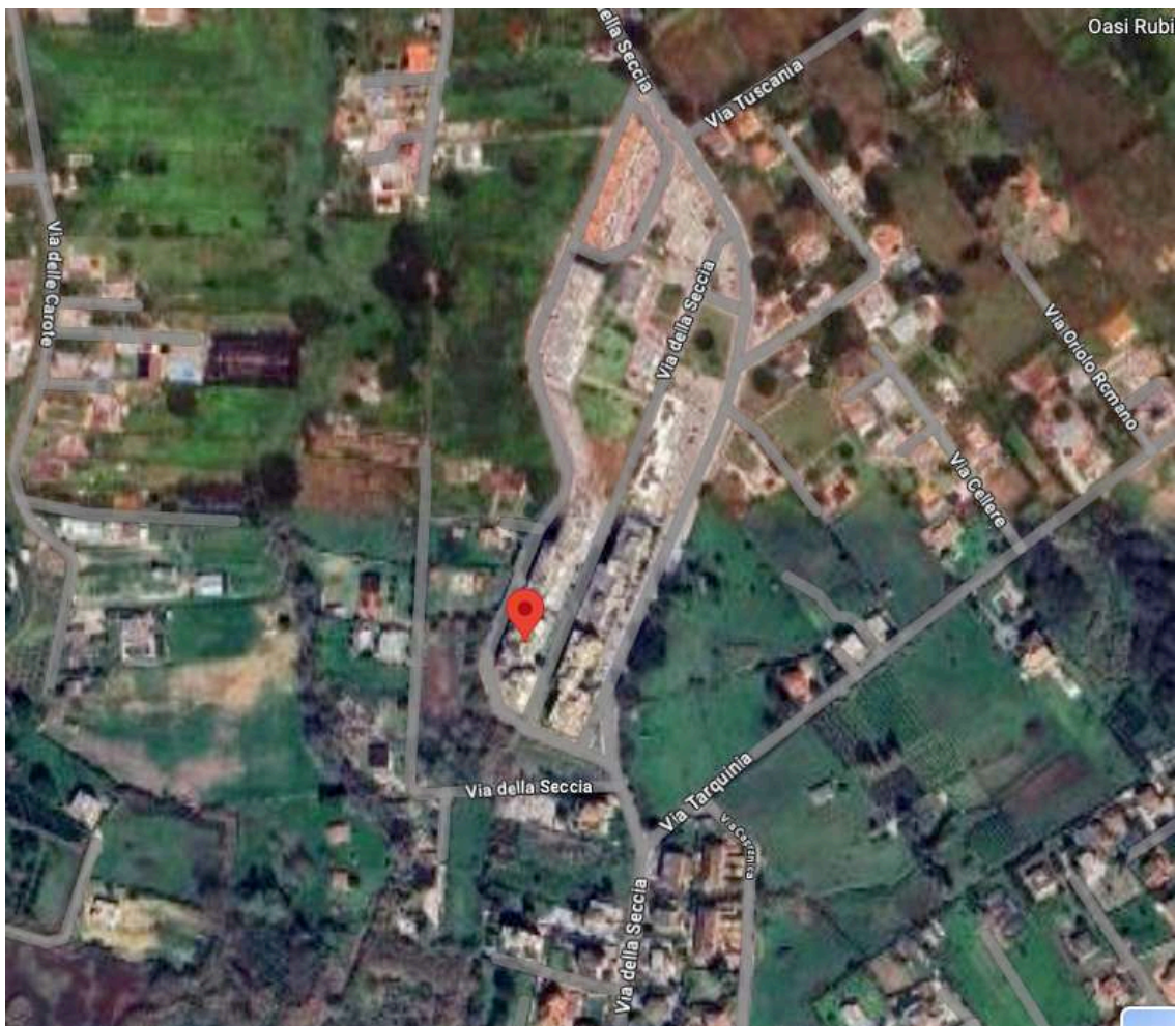
Foto 1 Individuazione edificio in via Rosa Luxemburg 2