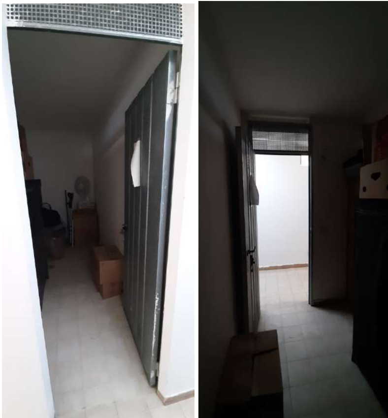
Foto 28 e 29 Cantina