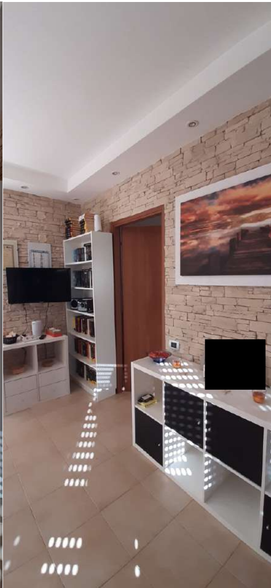
Foto 11, 12 e 13 Soggiorno