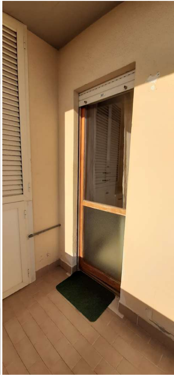
Foto 20 e 21 camera da letto e uscita dal soggiorno sul balcone