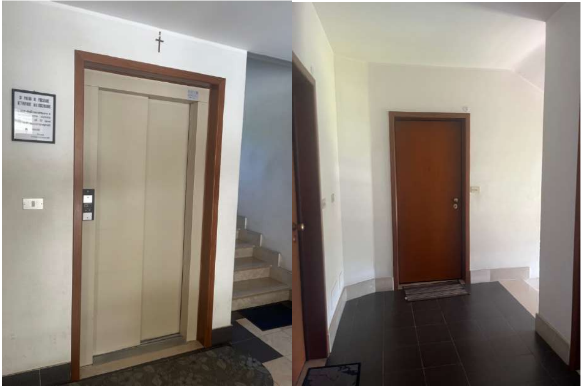
Foto 8 e 9 Ascensore e pianerottolo di accesso all'appartamento