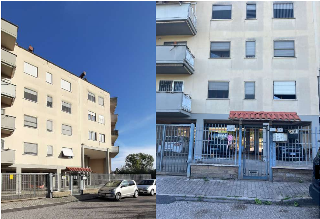
Foto 3 e 4 Vista dall'ingresso da via Rosa Luxemburg 2