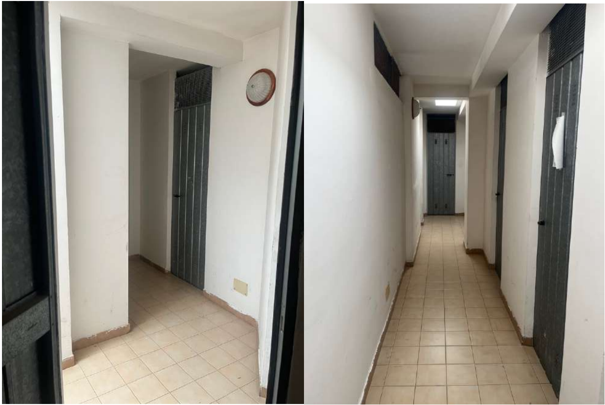
Foto 26 e 27 Corridoio di accesso alle cantine