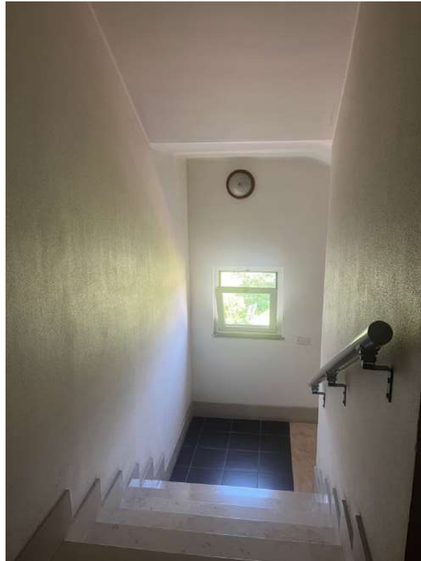
Foto 10 Vano scale