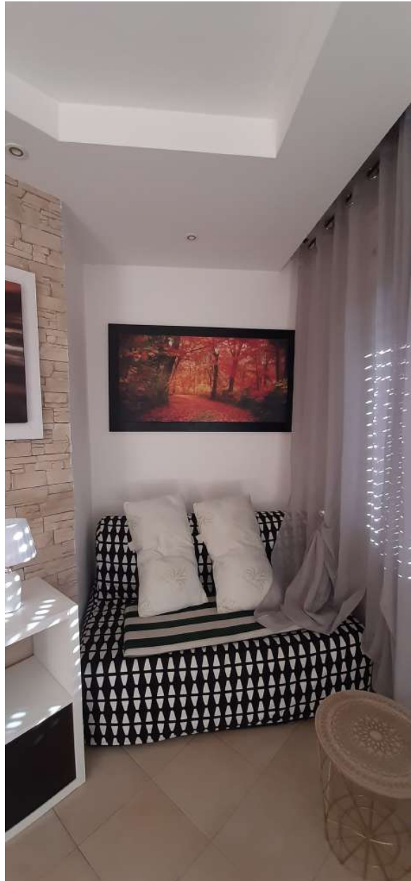
Foto 14 e 15 Angolo cottura e soggiorno