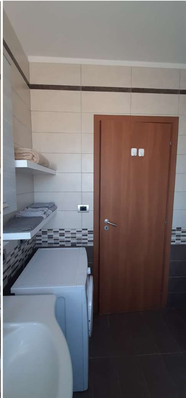
Foto 24 e 25 Bagno