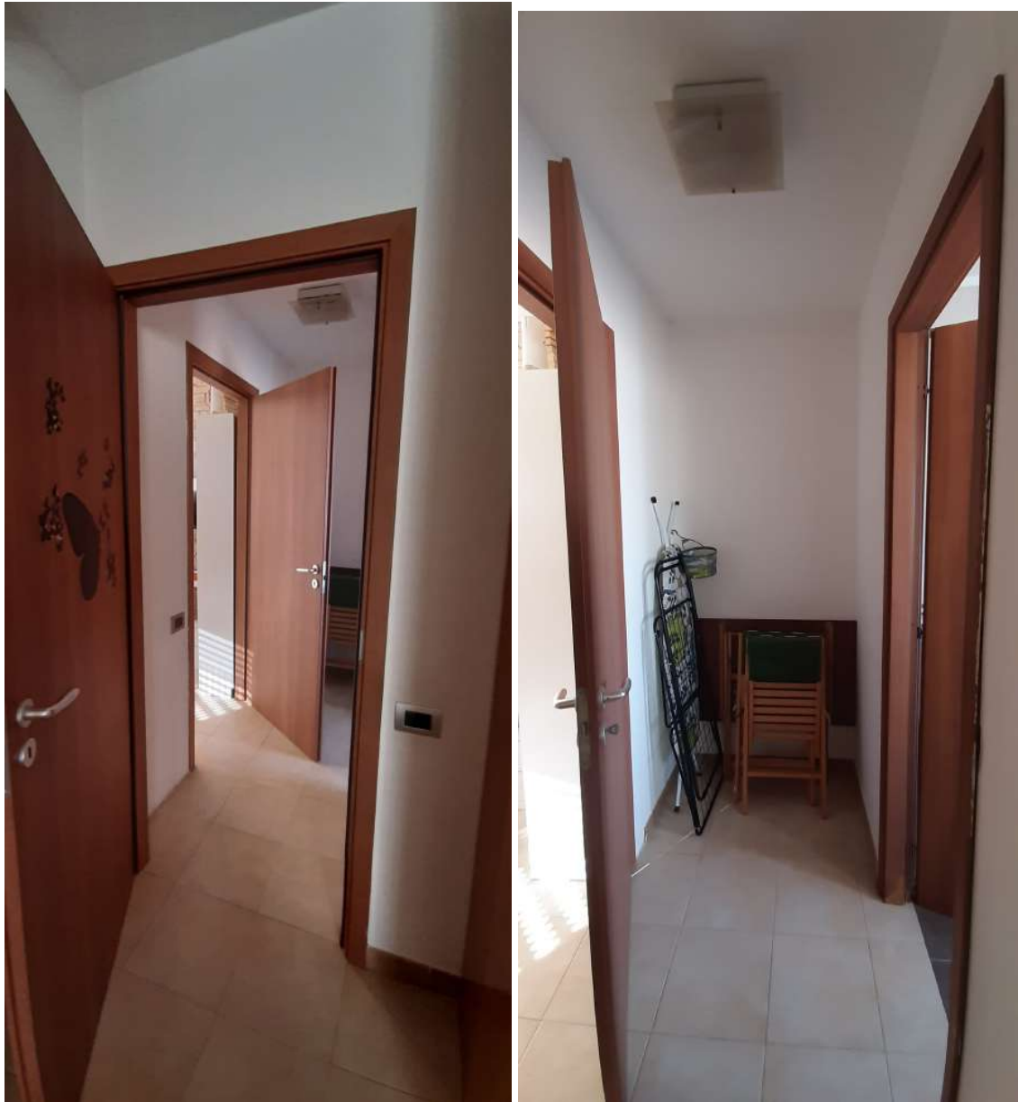
Foto 16 e 17 Disimpegno