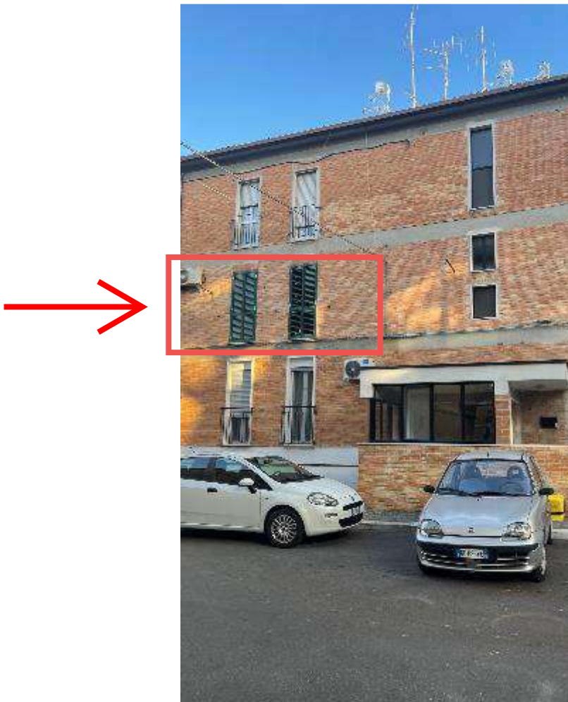
Foto 02 – Esterno – facciata anteriore – ingresso edificio e dettaglio infissi