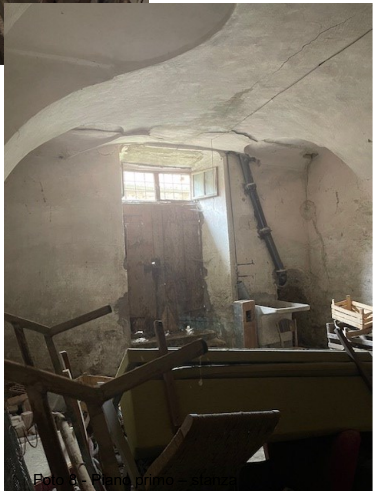
Foto 8 - Piano primo - stanza