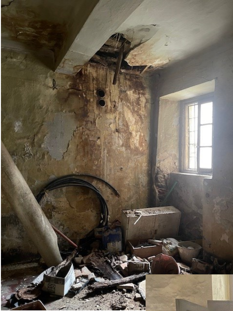
Foto 4 e 5 - Piano terra - Locale cucina e ingresso dal cortile comune