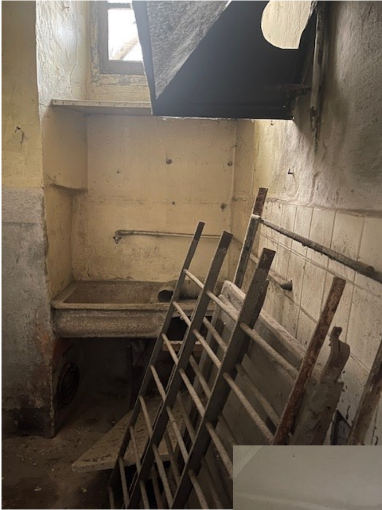
Foto 6 - Piano terra - Locale lavandino/cottura