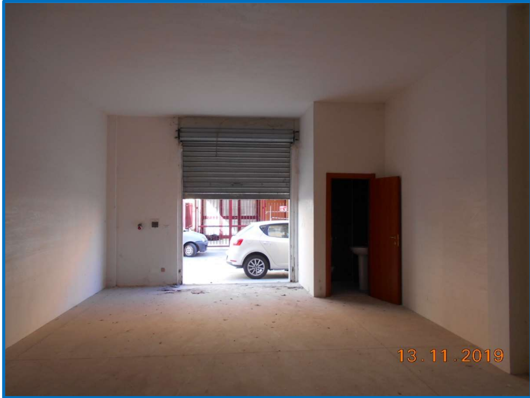
FOTO N.9: interno dell'immobile in piano terra sub 27 – Lotto n.6.