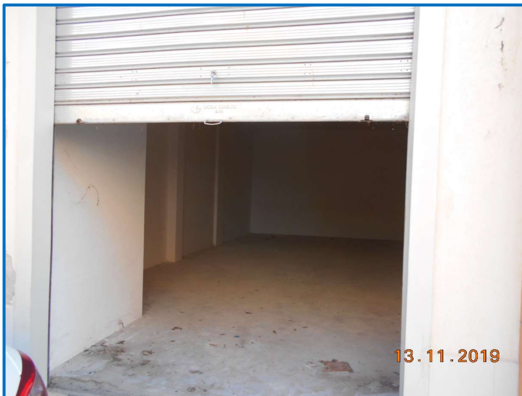
FOTO N.8: ingresso all'immobile in piano terra sub 27 – Lotto n.6.