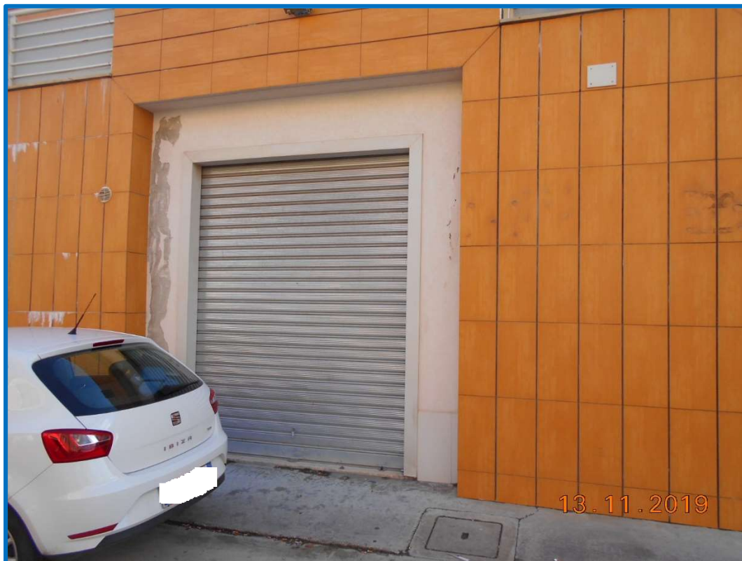
FOTO N.7: ingresso all'immobile in piano terra sub 27 – Lotto n.6.