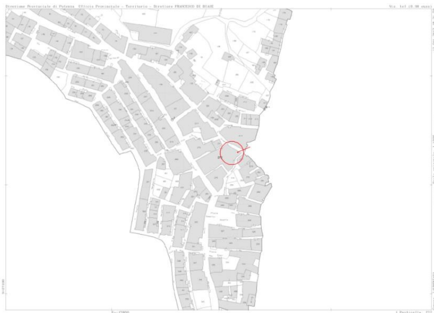
INDIVIDUAZIONE IMMOBILE SU MAPPA CATASTALE ATTUALE

QUESITO 2 elencare ed individuare i beni componenti ciascun lotto e procedere alla descrizione materiale di ciascun lotto;