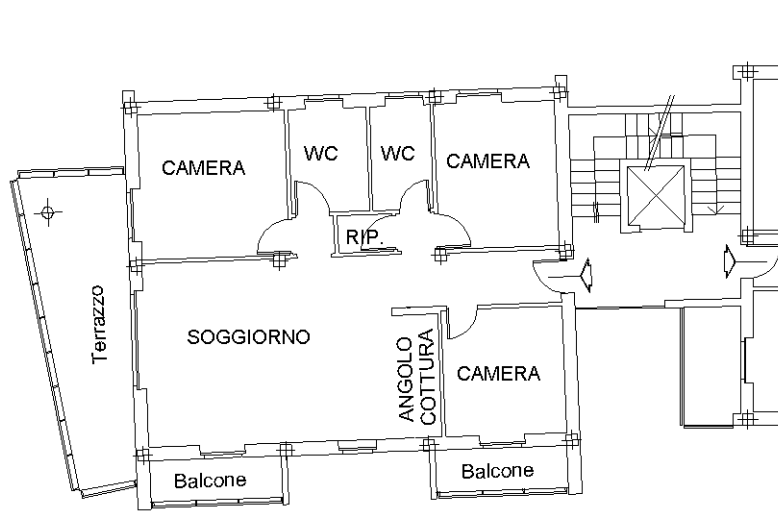
PIANO PRIMO H: 2.70m