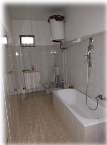
Bagno verso corridoio comune