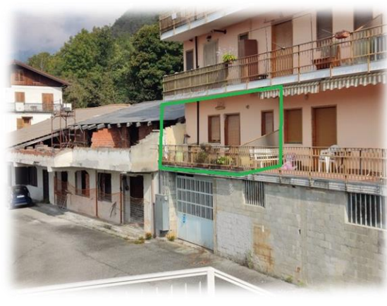
Vista dell'affaccio sul fronte opposto