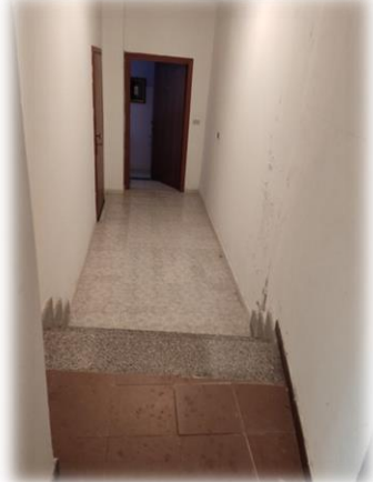
Ingresso all'unità abitativa dal vano scala