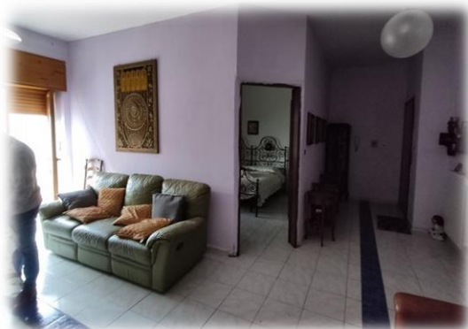
Ingresso living su soggiorno/pranzo con camera lato balcone

Tutto quanto sopra come meglio rappresentato nella produzione fotografica e nelle planimetrie allegate, cui si rimanda per una più chiara e immediata percezione dei luoghi.