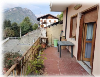
Balcone lato soggiorno/pranzo