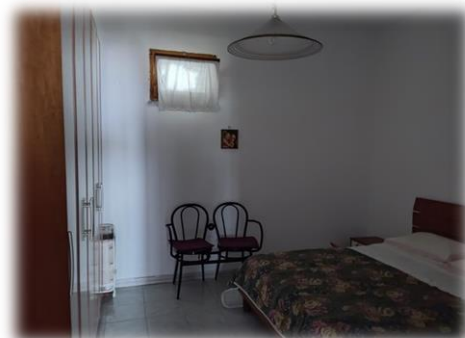
Camera verso corridoio comune