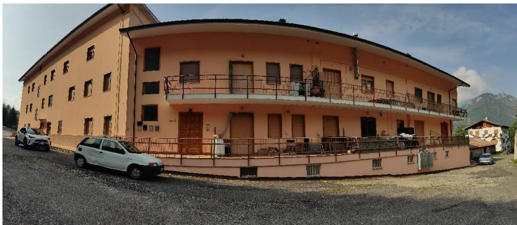
Vista d'insieme di parte dei fabbricati che compongono il complesso residenziale