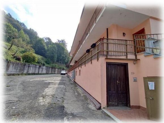
Portoncino d'ingresso al condominio