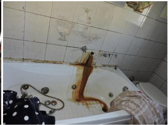
Foto 15 e 16 Bagno