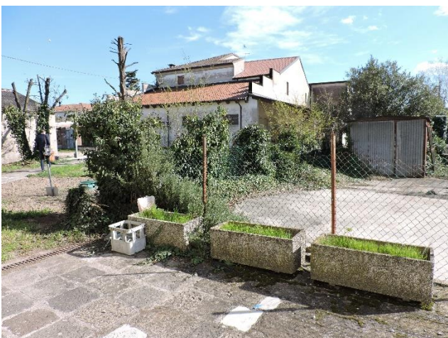
Foto 5 Area scoperta comune