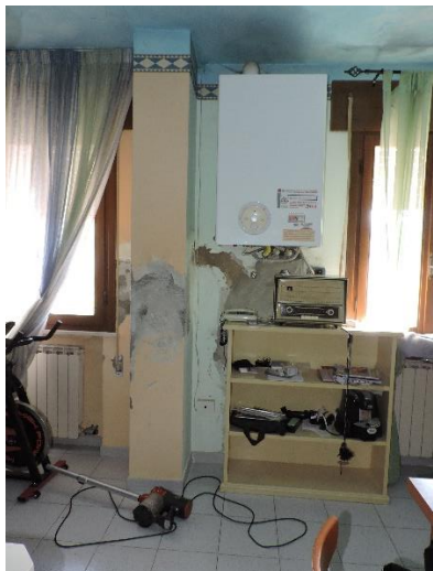
Foto 9 Soggiorno