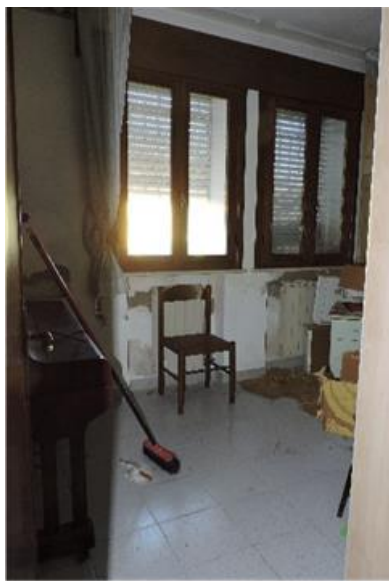
Foto 12 e 13 Camera