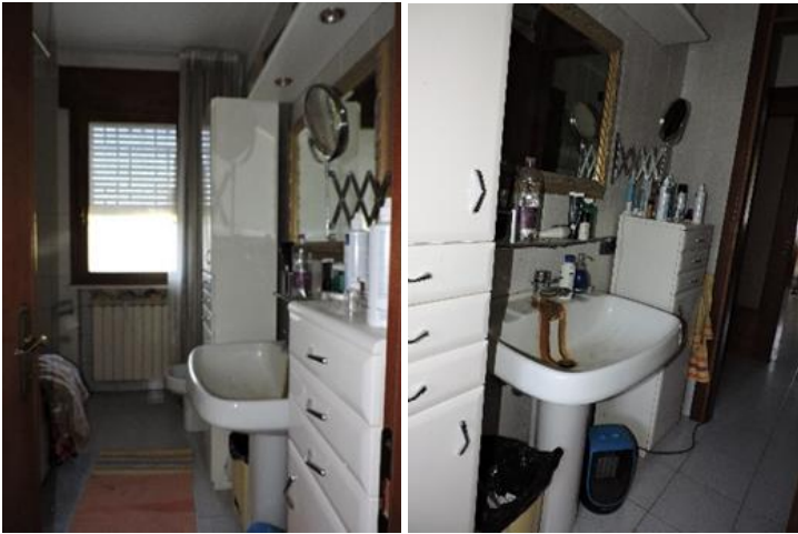
Foto 14 Bagno