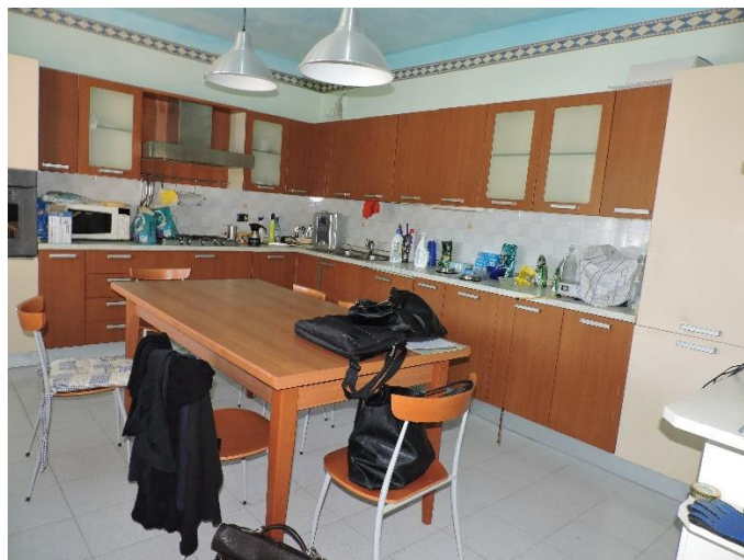
Foto 10 Cucina