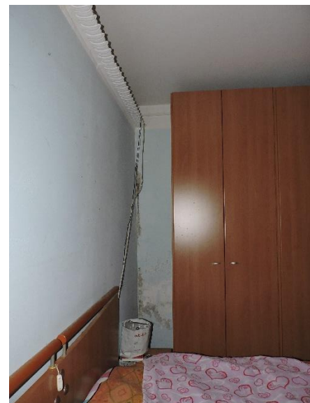
Foto 18 Camera