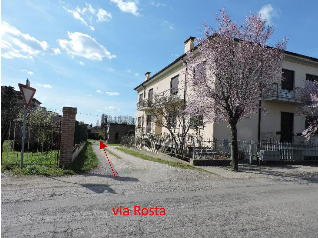
Foto 1 e Foto 2 Ingresso da via Rosta tramite stradello

Appartamento al piano terra di fabbricato sito in via Rosta a Castagnaro (VR)