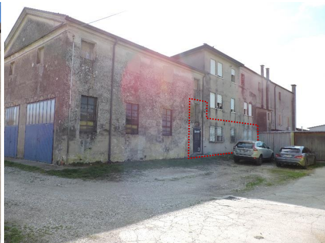
Foto 4 Fronte posteriore