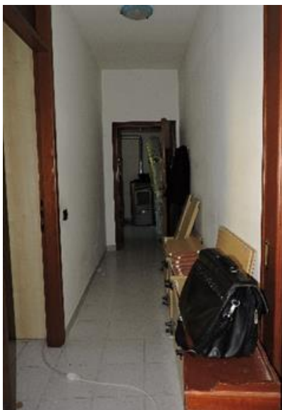
Foto 11 Corridoio