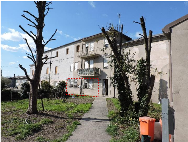
Foto 3 Fronte principale