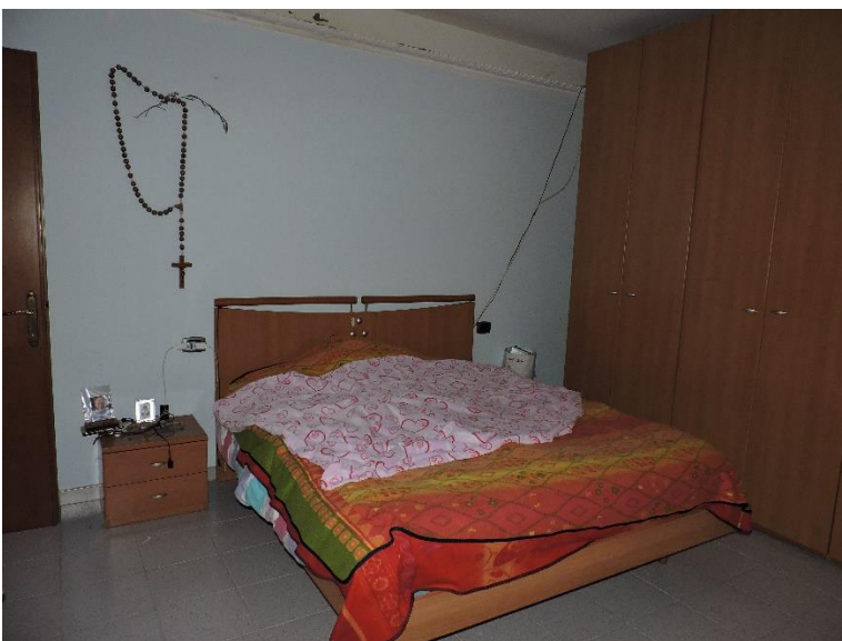
Foto 17 Camera