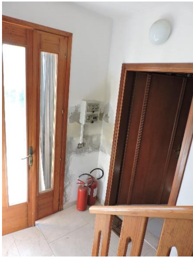
Foto 7 Vano scale