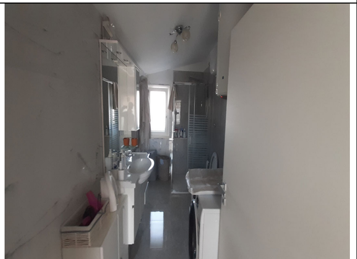
Unità immobiliare censita in catasto fabbricati al foglio n° 3, particella n° 1159, sub. 1