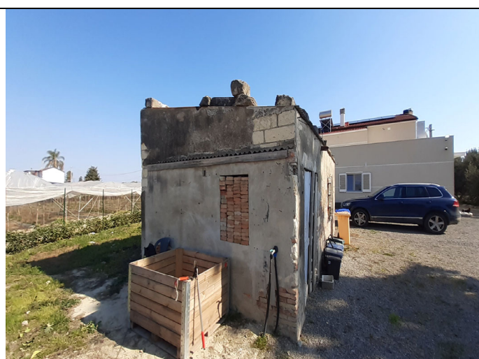
Unità immobiliare censita in catasto terreni al foglio n° 3, particelle n° 239 e 240 oltre a locale deposito non censito in catasto