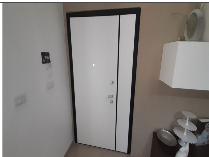
Unità immobiliare censita in catasto fabbricati al foglio n° 3, particella n° 1159, sub. 1