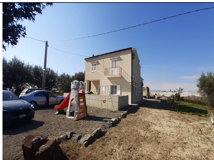
Unità immobiliare censita in catasto fabbricati al foglio n° 3, particella n° 1159, sub. 1