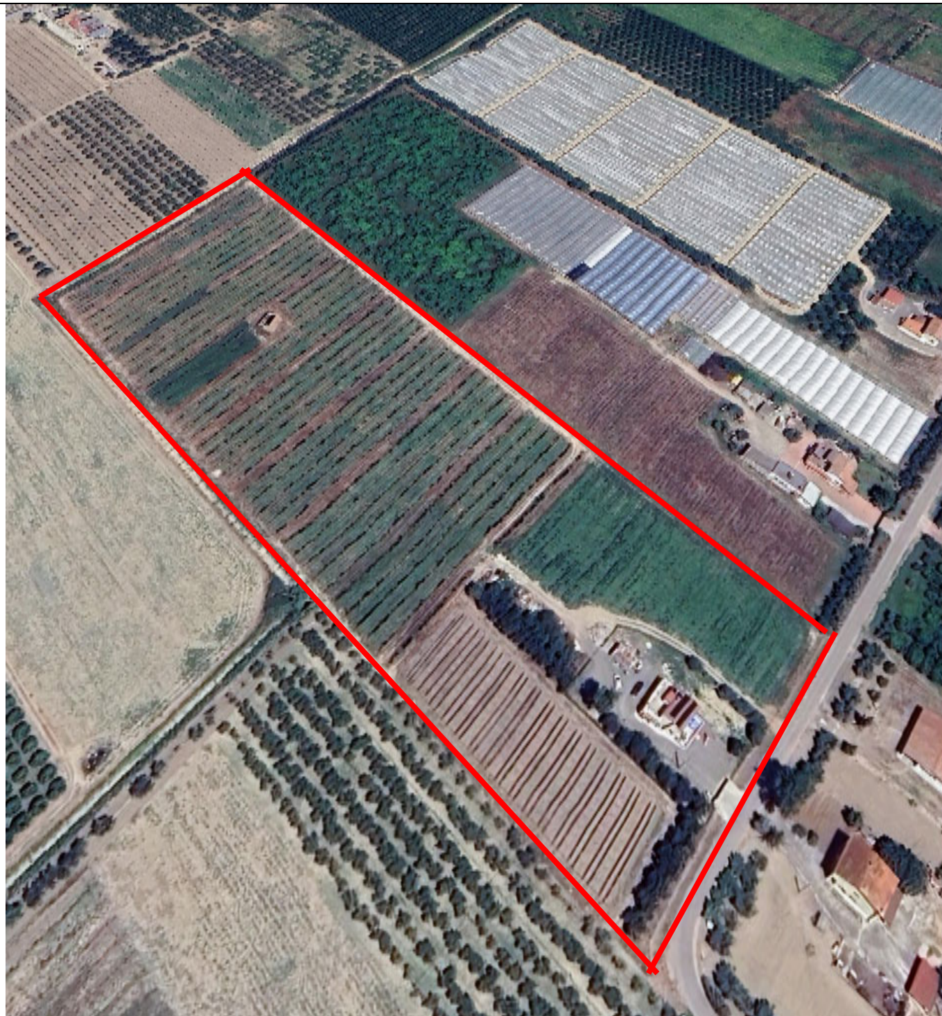
Veduta aerea del compendio immobiliare costituente il lotto 001