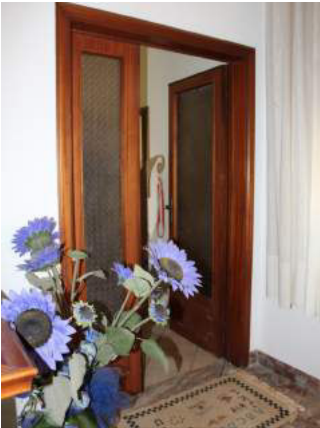
Foto nn° 57 (sn) e 58 (alto) – Porta di ingresso Unità C, vista verso il soggiorno