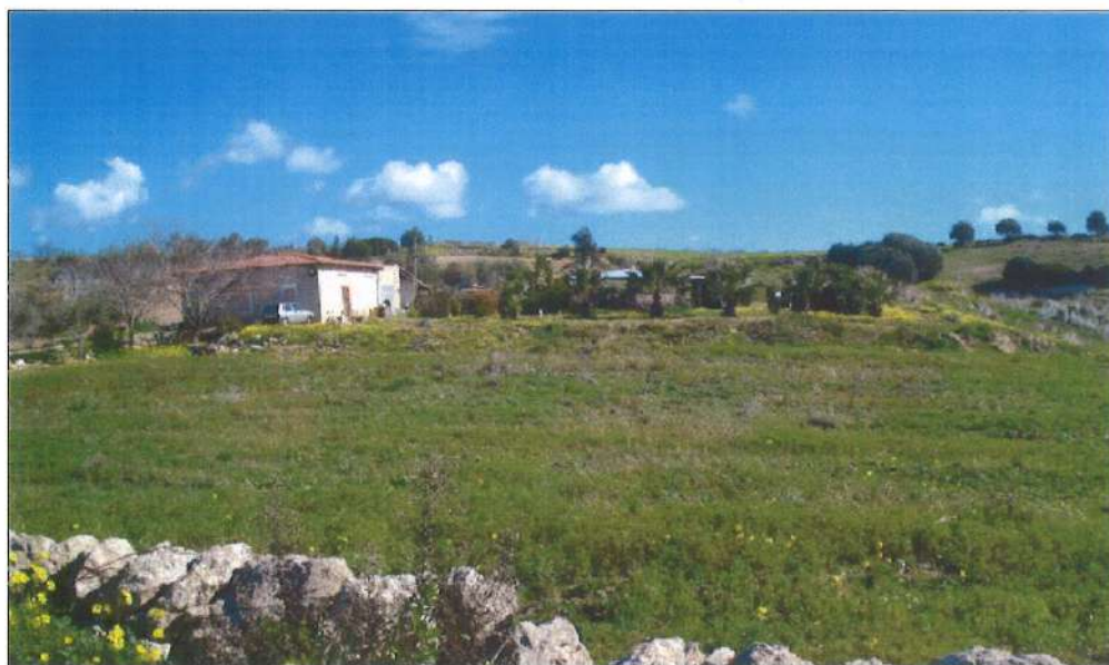
Panoramica Lotto A e B.