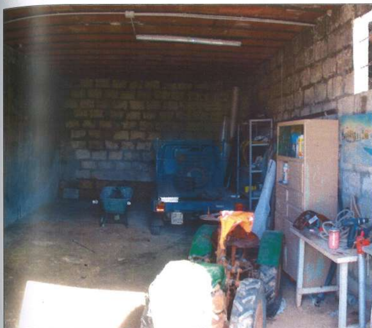
Interno garage, Lotto A e B.