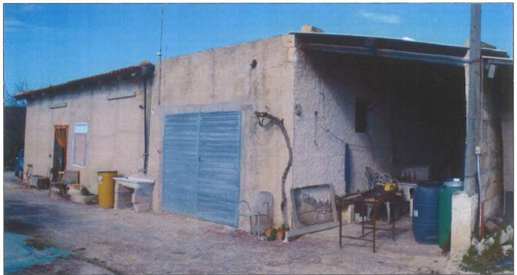
Prospetto sud-est fabbricato.