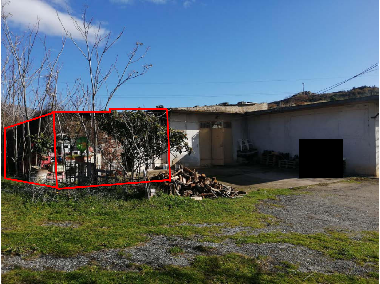
BARRACCA ABUSITA ADIACENTE MAGAZZINO A