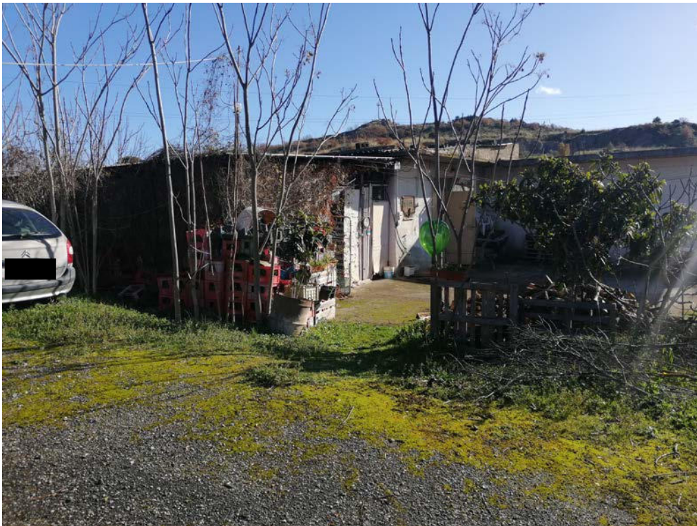
BARRACCA ABUSITA ADIACENTE MAGAZZINO A