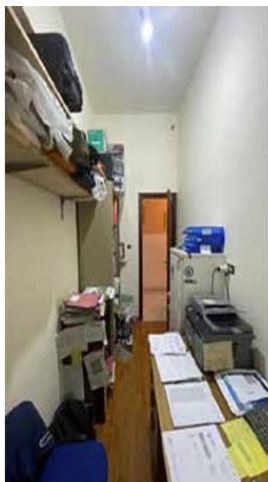
Foto n. 12. Camera uso studio