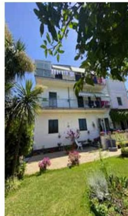
Foto n. 5. Area privata esterna al fabbricato in cui ha sede il bene pignorato