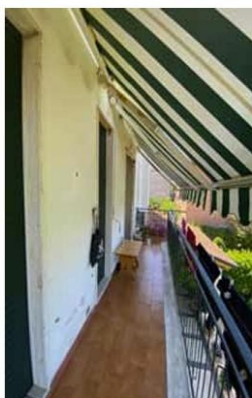
Foto n. 19 Balcone fronte ovest