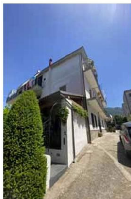
Foto n. 3. Viale privato di accesso al fabbricato in cui ha sede il bene pignorato