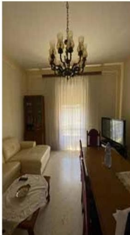
Foto n. 10. Soggiorno dell'appartamento