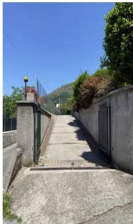
Foto n. 1. Rampa privata di accesso al fabbricato in cui ha sede il bene pignorato

Circa le pertinenze e le dotazioni condominiali (es. posti auto comuni, giardino, ecc.), risultano in comunione i tratti di accesso al fondo, l'androne principale di accesso al fabbricato, il cantinato seminterrato avente ingresso dall'androne e la prima rampa della scala interna posta in prosieguo del predetto androne.