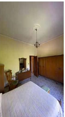
Foto n. 14. Camera padronale