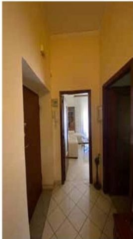
Foto n. 9. Ingresso dell'alloggio in 1 piano