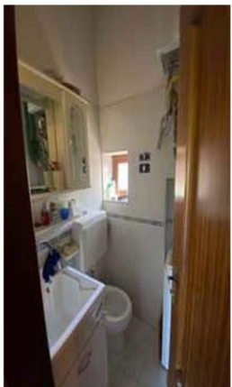
Foto n. 16. Bagno lavanderia