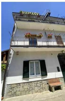
Foto n. 4. Viale privato di accesso al fabbricato in cui ha sede il bene pignorato