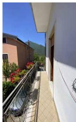
Foto n. 20 Balcone fronte sud solo parzialmente afferente al bene ignorato