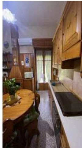
Foto n. 11. Cucina dell'appartamento