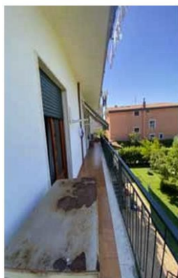
Foto n. 18 Balcone fronte ovest