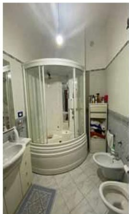
Foto n. 15. Bagno principale