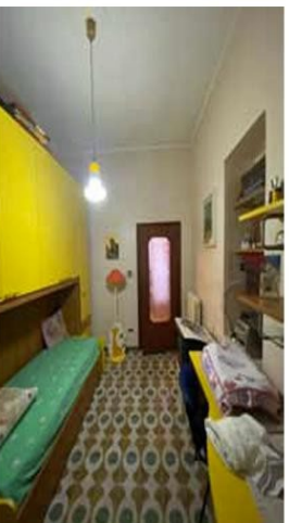
Foto n. 13. Camera dell'appartamento