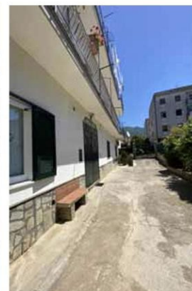
Foto n. 8. Viale privato di accesso al fabbricato in cui ha sede il bene pignorato