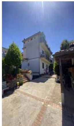
Foto n. 2. Corte privata esterna al fabbricato in cui ha sede il bene pignorato