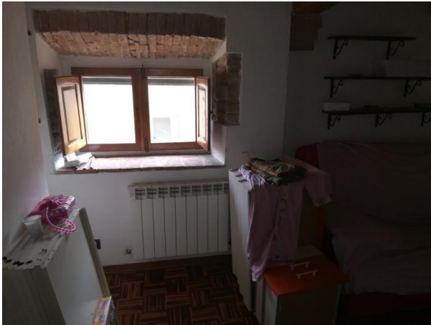
SOGGIORNO - RADIATORE