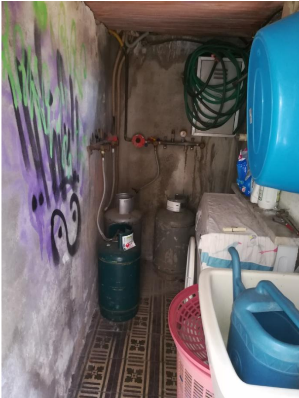
POSIZIONAMENTO BOMBOLA GPL