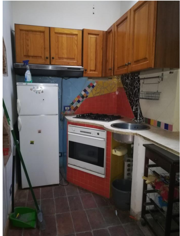
VARO AD USO CUCINA