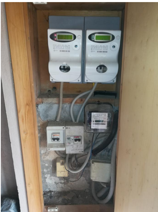
INGRESSO - QUADRO ELETTRICO

Per quanto riguarda l'impianto di messa a terra e di protezione installato nell'appartamento, dal solo esame visivo non è stato possibile stabilire se ad oggi il sistema è adeguatamente collegato e se gli eventuali valori di resistenza di terra sono conformi a quanto richiesto dalla normativa.