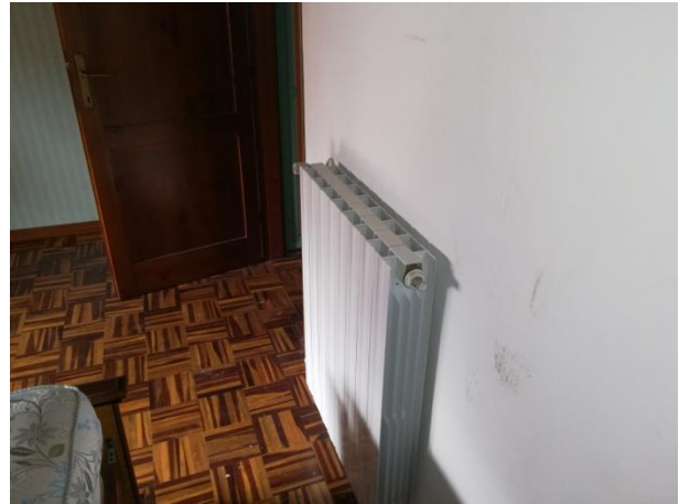
CAMERA - RADIATORE

operazioni di controllo di efficienza energetica, comprensive di mancata stesura o rinnovo tardivo del libretto di impianto.