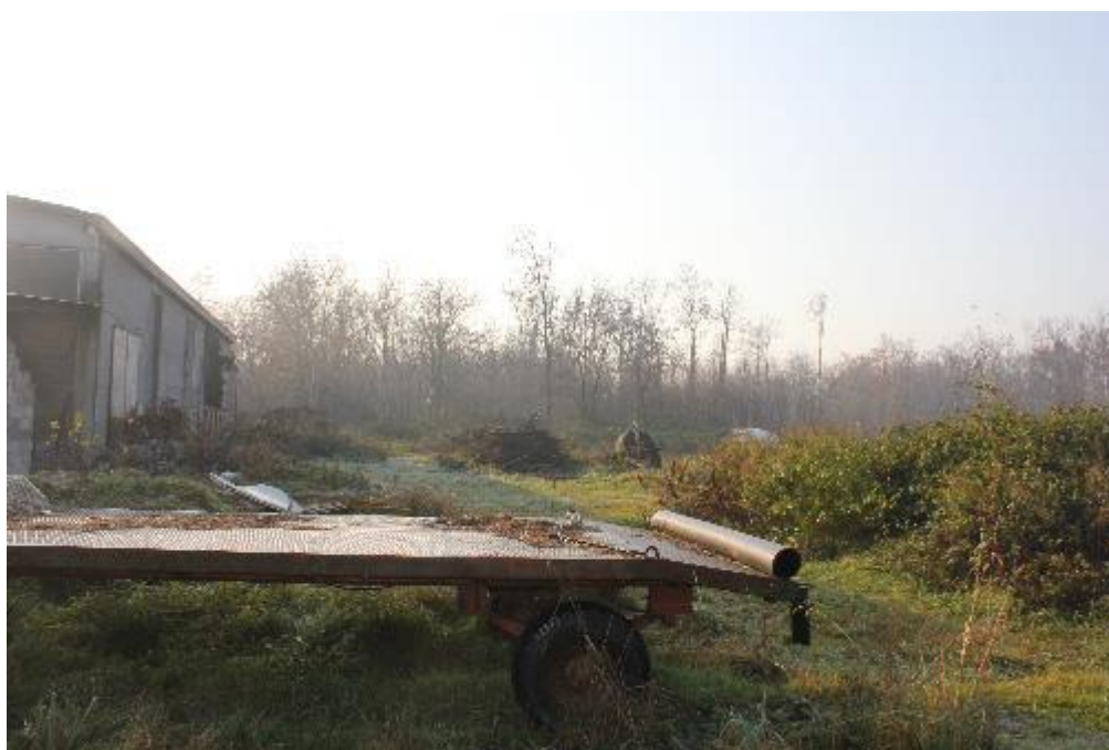
FOTO 22: VANZAGHELLO (MI), VIA DEI MULINI 99, Terreni al Foglio 9, mapp. 578/580 (CORPO D/E)