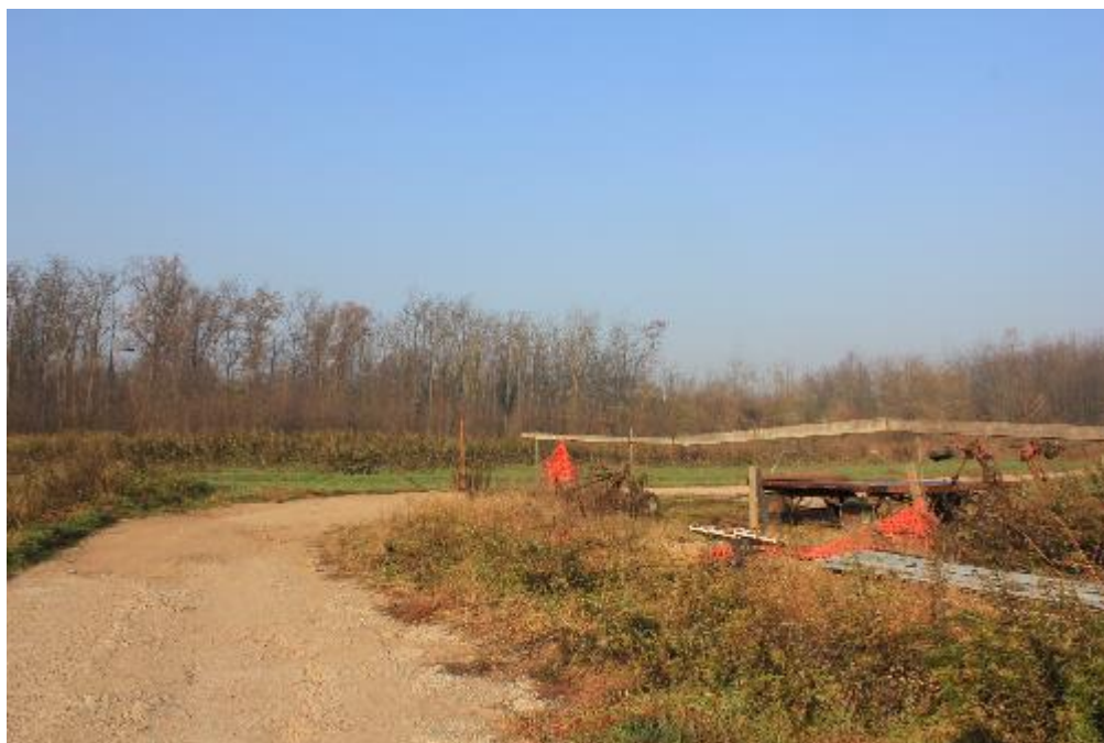
FOTO 19: VANZAGHELLO (MI), VIA DEI MULINI 99, Terreni al Foglio 9, mapp. 578/580 (CORPO D/E)