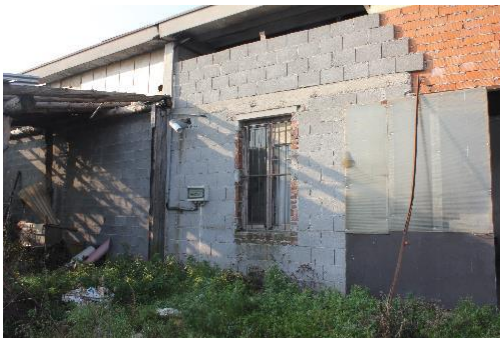
FOTO 14: VANZAGHELLO (MI), VIA DEI MULINI 99, Edificio al Foglio 9, mapp. 568 (CORPO D)