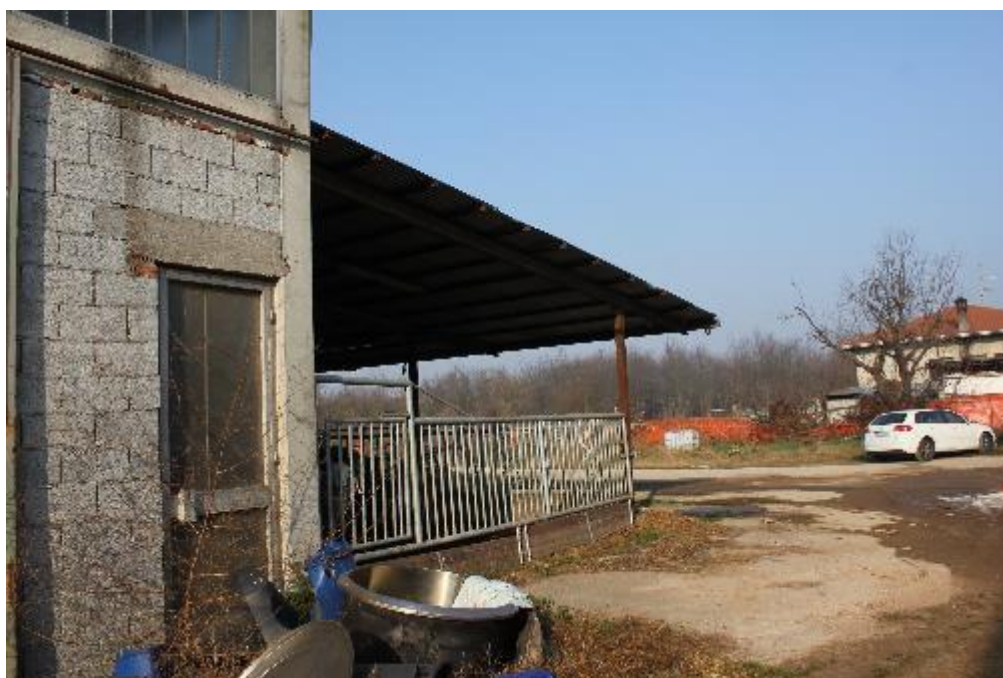
FOTO 2: VANZAGHELLO (MI), VIA DEI MULINI 99, Edificio al Foglio 9, mapp. 567 (CORPO D)