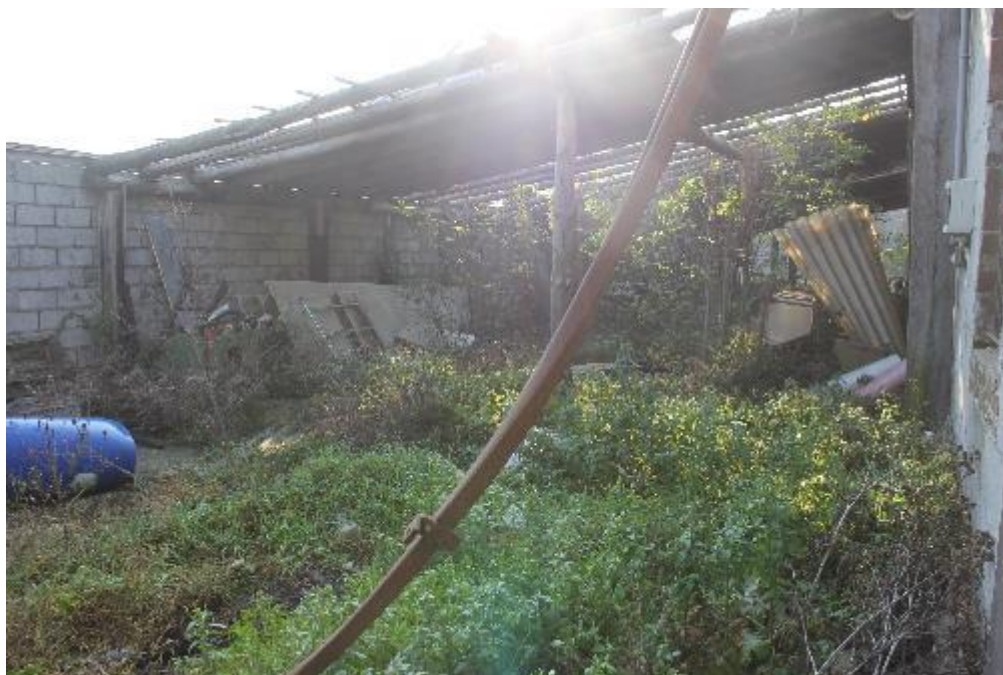
FOTO 13: VANZAGHELLO (MI), VIA DEI MULINI 99, Edificio al Foglio 9, mapp. 568 (CORPO D)