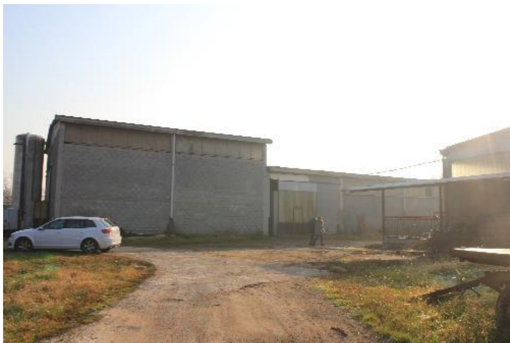
FOTO 9: VANZAGHELLO (MI), VIA DEI MULINI 99, Edificio al Foglio 9, mapp. 568 (CORPO D)