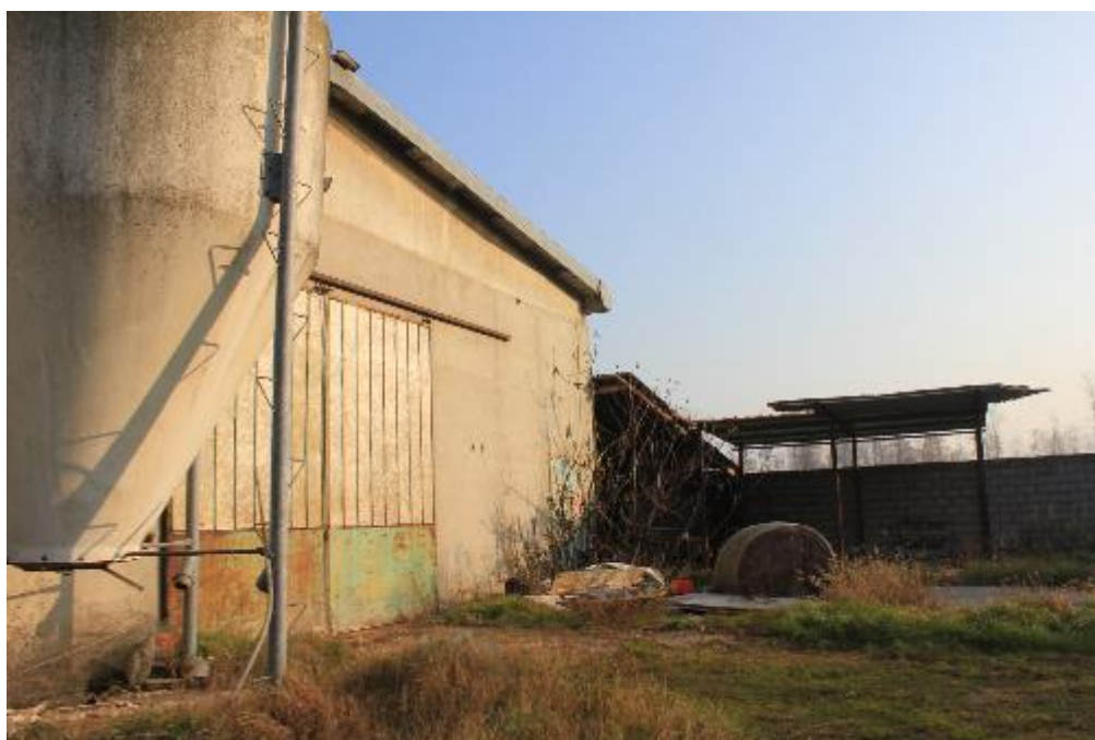
FOTO 12: VANZAGHELLO (MI), VIA DEI MULINI 99, Edificio al Foglio 9, mapp. 568 (CORPO D)