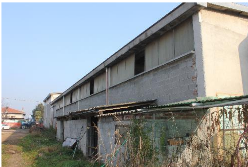
FOTO 10: VANZAGHELLO (MI), VIA DEI MULINI 99, Edificio al Foglio 9, mapp. 568 (CORPO D)