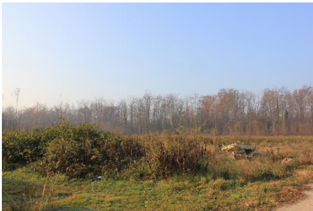
FOTO 21: VANZAGHELLO (MI), VIA DEI MULINI 99, Terreni al Foglio 9, mapp. 578/580 (CORPO D/E)