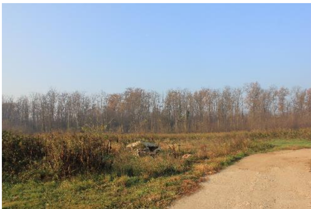
FOTO 20: VANZAGHELLO (MI), VIA DEI MULINI 99, Terreni al Foglio 9, mapp. 578/580 (CORPO D/E)