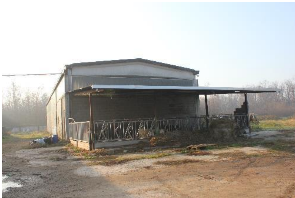
FOTO 1: VANZAGHELLO (MI), VIA DEI MULINI 99, Edificio al Foglio 9, mapp. 567 (CORPO D)