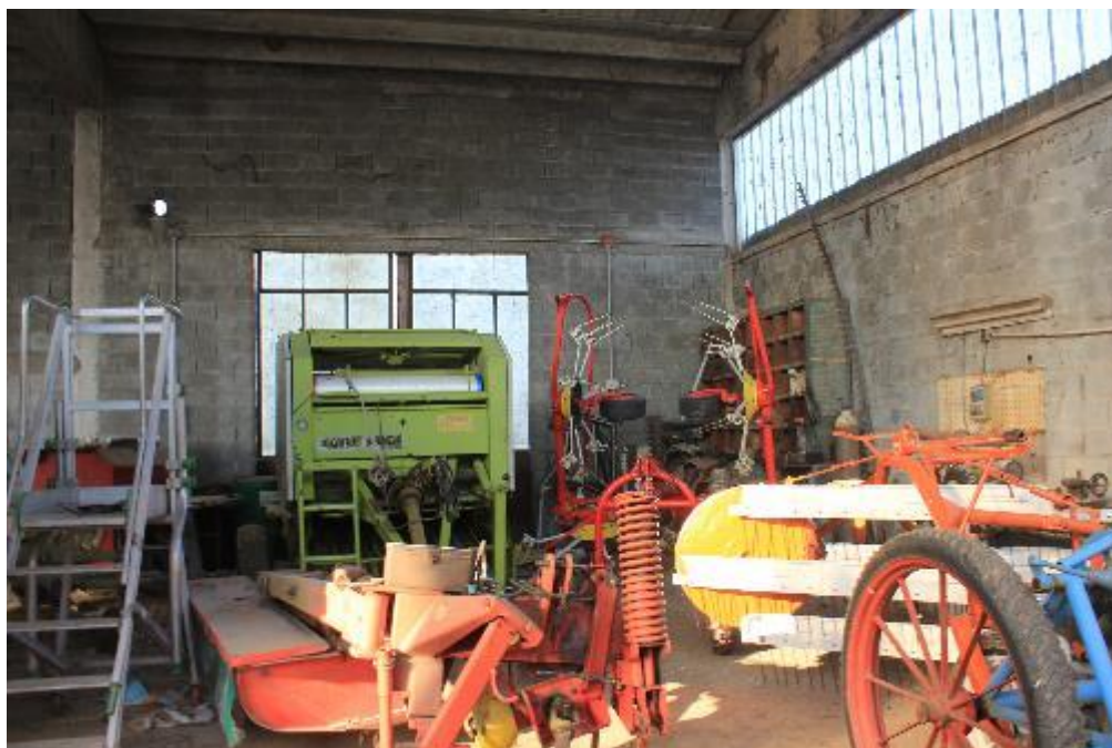
FOTO 7: VANZAGHELLO (MI), VIA DEI MULINI 99, Interno Edificio al Foglio 9, mapp. 567 (CORPO D)