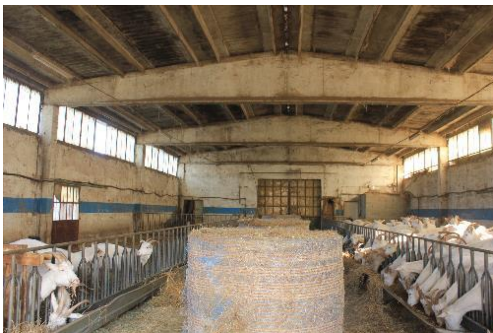
FOTO 16: VANZAGHELLO (MI), VIA DEI MULINI 99, Edificio al Foglio 9, mapp. 568 (CORPO D)