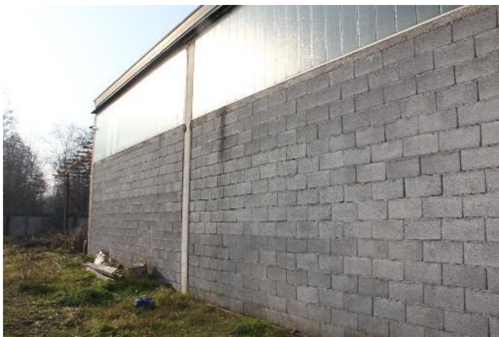
FOTO 4: VANZAGHELLO (MI), VIA DEI MULINI 99, Edificio al Foglio 9, mapp. 567 (CORPO D)