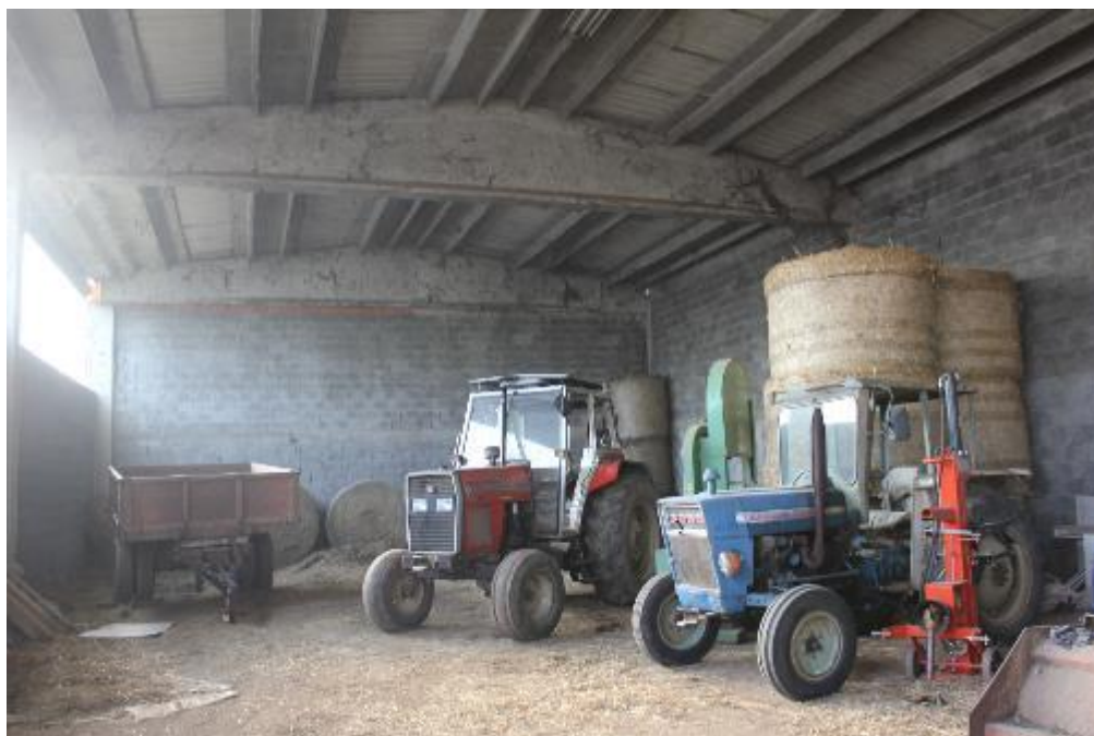
FOTO 5: VANZAGHELLO (MI), VIA DEI MULINI 99, Interno Edificio al Foglio 9, mapp. 567 (CORPO D)