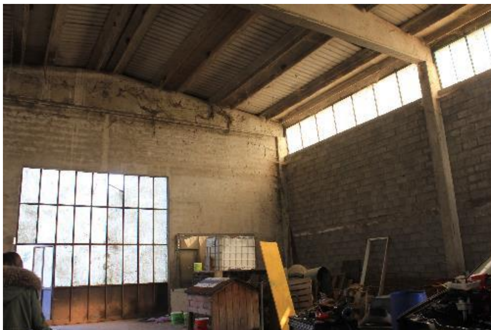
FOTO 17: VANZAGHELLO (MI), VIA DEI MULINI 99, Edificio al Foglio 9, mapp. 568 (CORPO D)