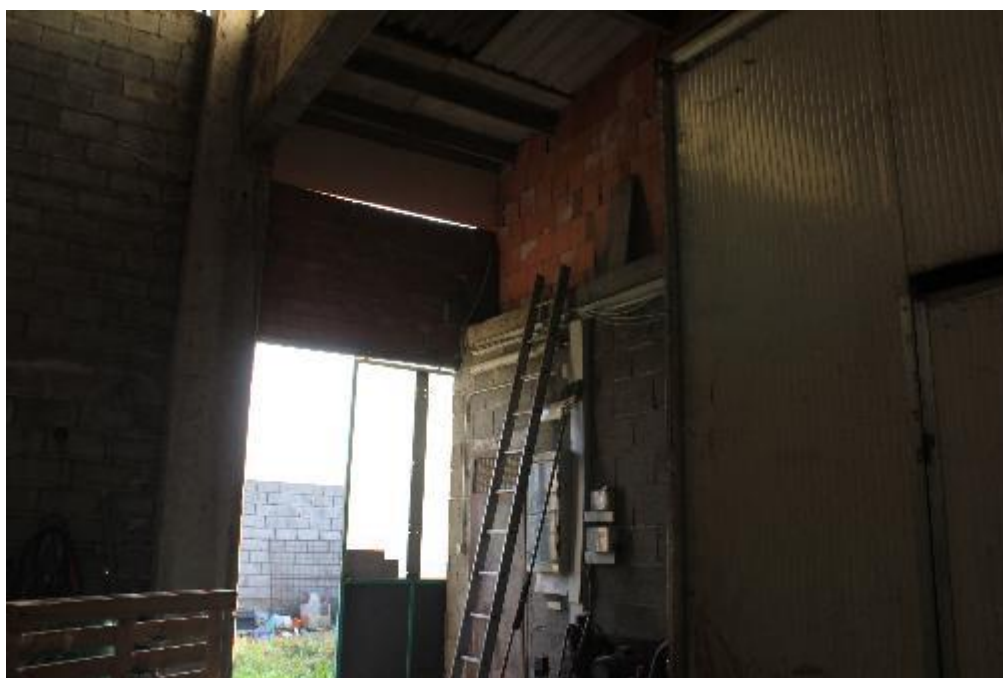
FOTO 18: VANZAGHELLO (MI), VIA DEI MULINI 99, Edificio al Foglio 9, mapp. 568 (CORPO D)