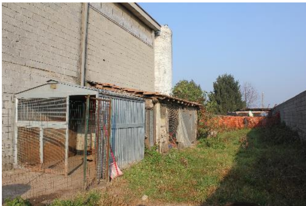
FOTO 15: VANZAGHELLO (MI), VIA DEI MULINI 99, Edificio al Foglio 9, mapp. 568 (CORPO D)