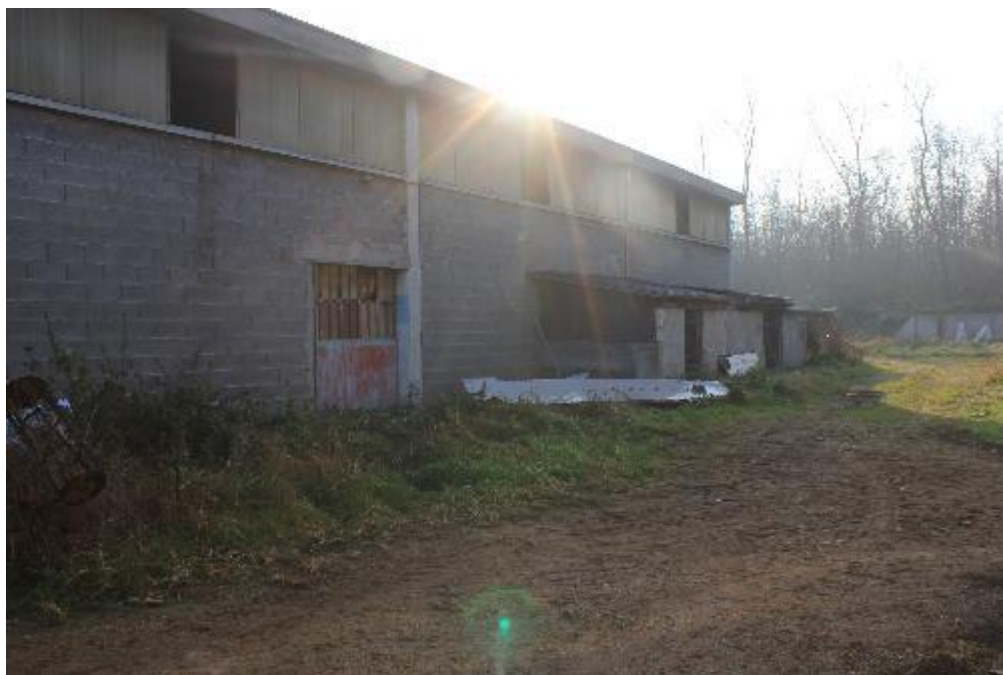
FOTO 11: VANZAGHELLO (MI), VIA DEI MULINI 99, Edificio al Foglio 9, mapp. 568 (CORPO D)