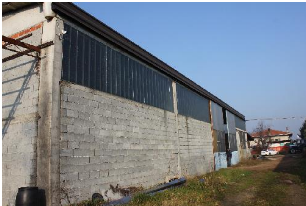
FOTO 3: VANZAGHELLO (MI), VIA DEI MULINI 99, Edificio al Foglio 9, mapp. 567 (CORPO D)