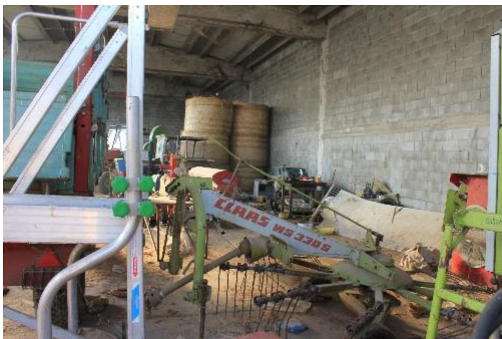
FOTO 6: VANZAGHELLO (MI), VIA DEI MULINI 99, Interno Edificio al Foglio 9, mapp. 567 (CORPO D)