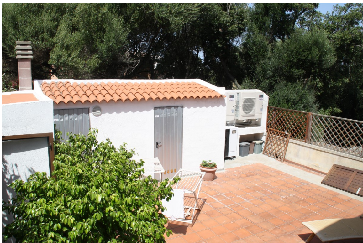
Area di pertinenza con generatori di aria caldo/freddo