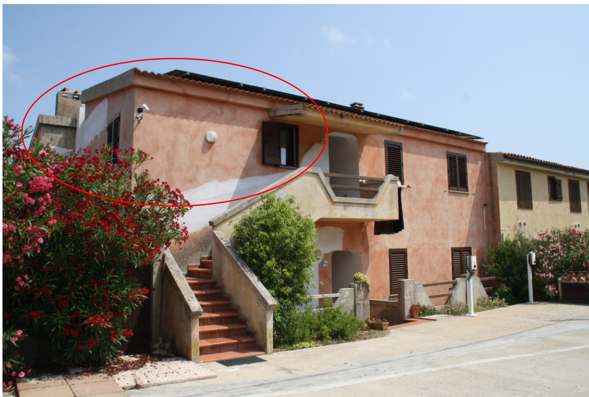
Ripresa dello Stabile sul lato sud – ovest – individuazione Lotto