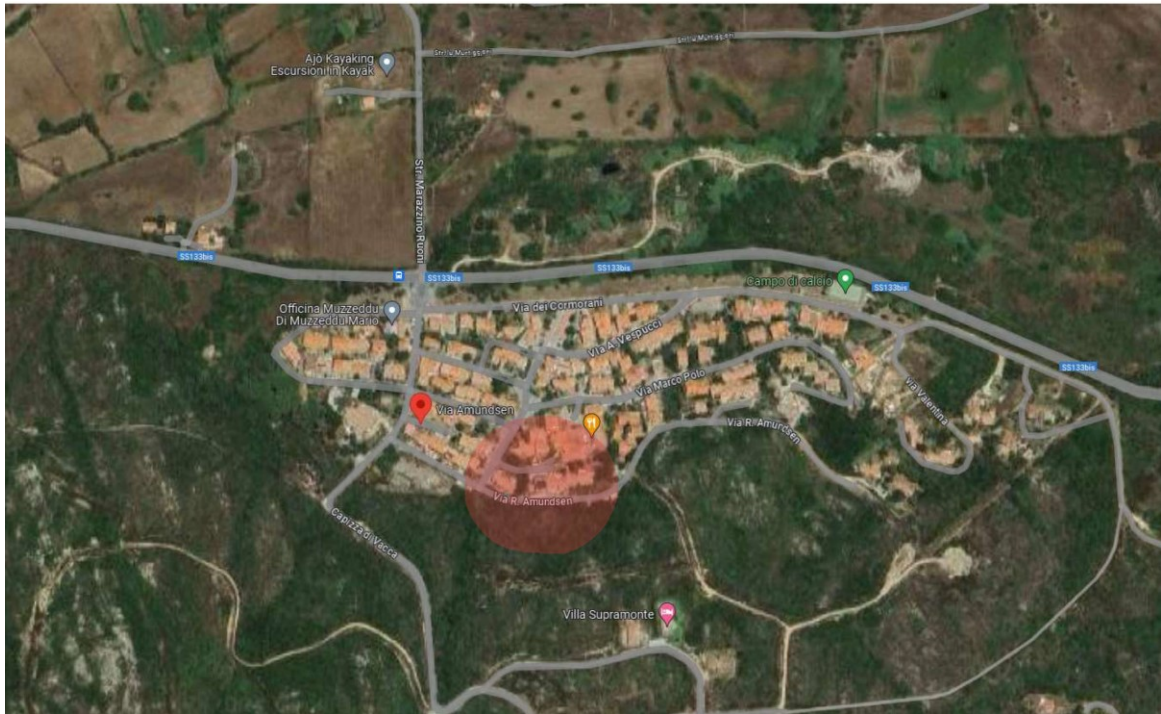
Foto aerea dell'abitato di "Ruoni" con individuazione della zona in cui è ubicato l'immobile