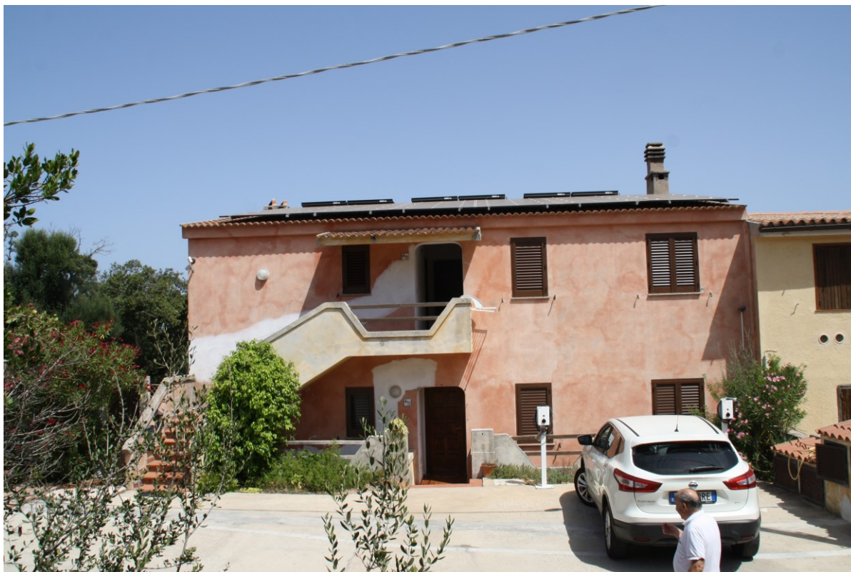
Stabile in cui è sito l'appartamento – Facciata su via Amundsen