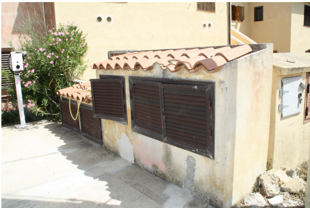
Manufatto con contatori