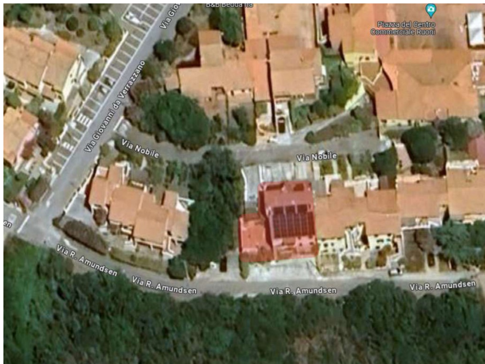
Foto aerea con individuazione dello stabile in cui è sito il Lotto eseguito