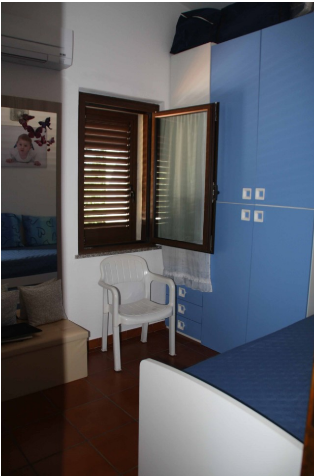
Studio ad uso camera