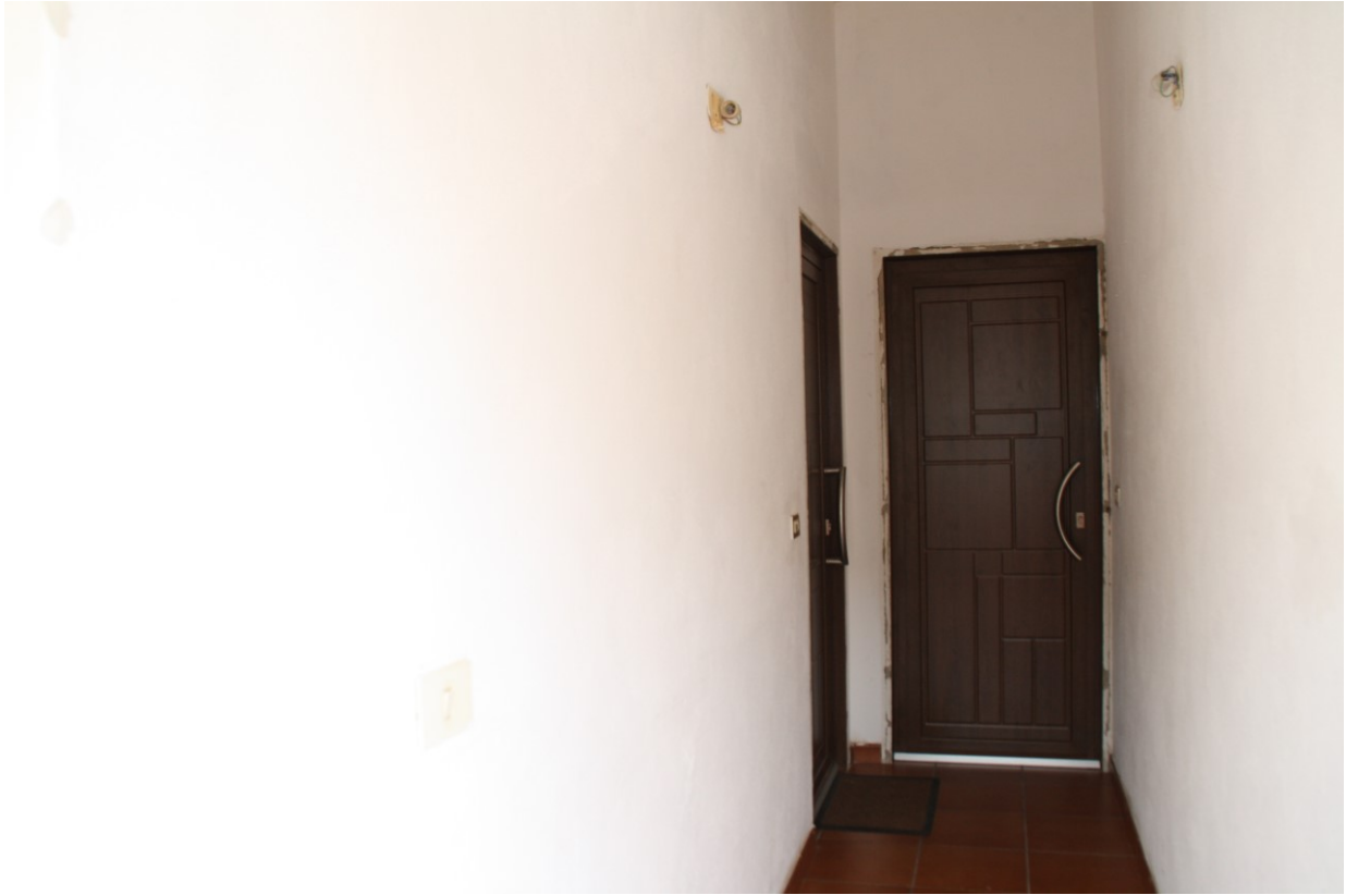
Ingresso (subalterno 4)