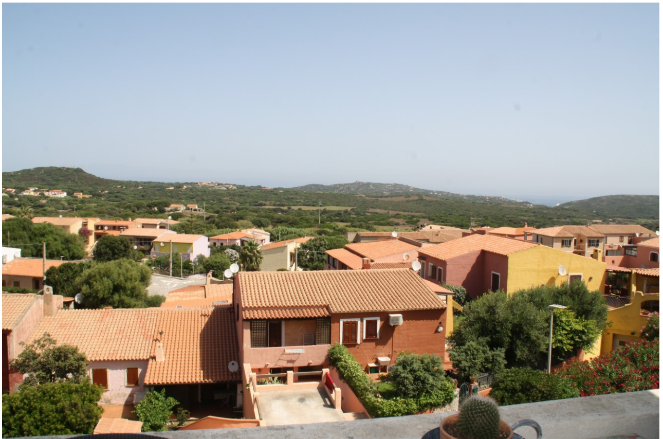
Veduta a nord dal terrazzo