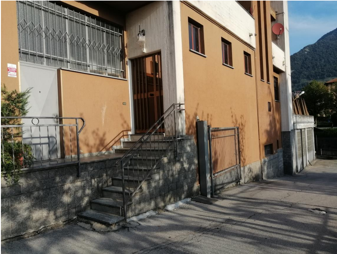
area esterna (ex stazione di servizio)