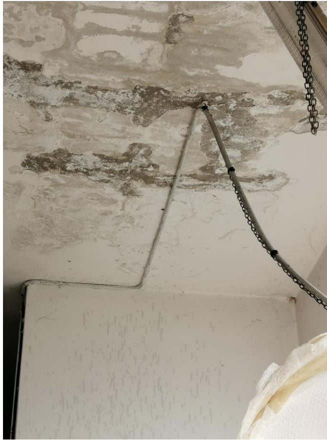
bagni piano terra