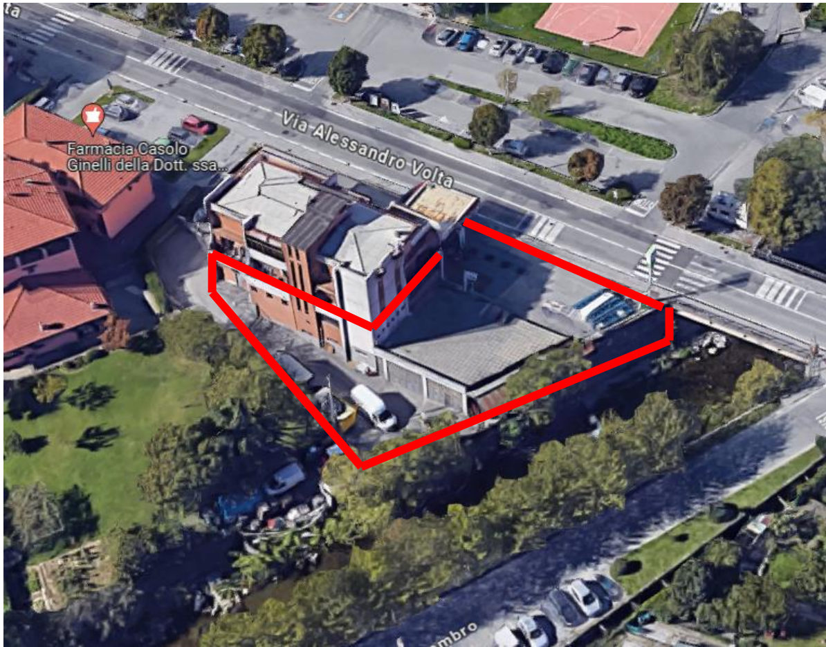
individuazione area esterna e magazzino al piano seminterrato