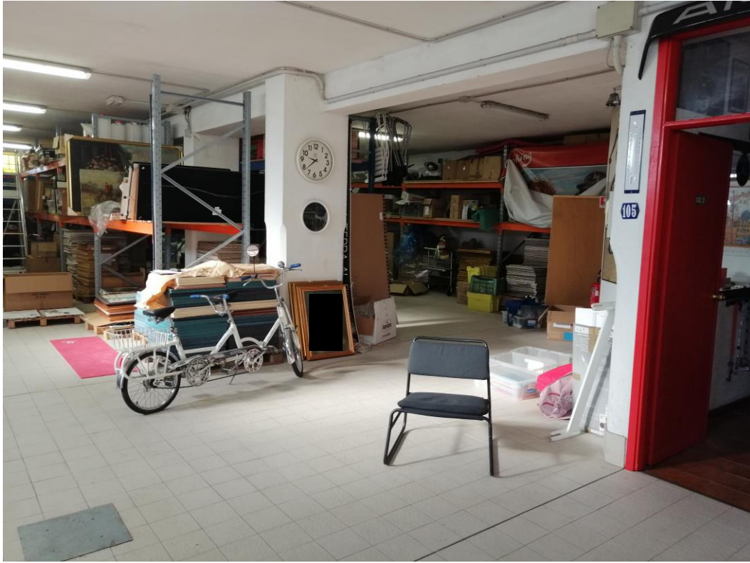
Lotto B – Laboratorio/Magazzino - piano seminterrato