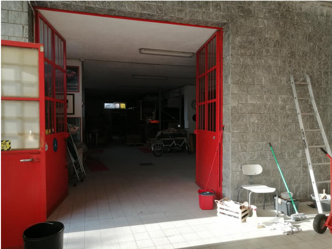
Lotto C – Magazzino non a norma - piano seminterrato