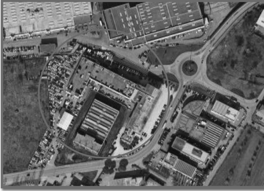
Firenze – Via Curzio Malaparte, 10