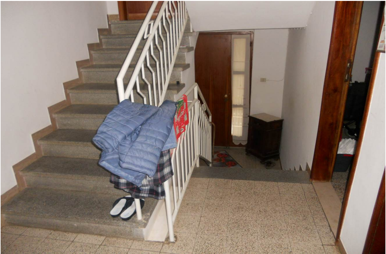
FOTO 8 – Particolare interno dell'ingresso comune e vano scala al P. Terra, comune tra l'appartamento del P. Terra (unità sub. 2) e l'appartamento sopra al P.1° (unità sub. 3)