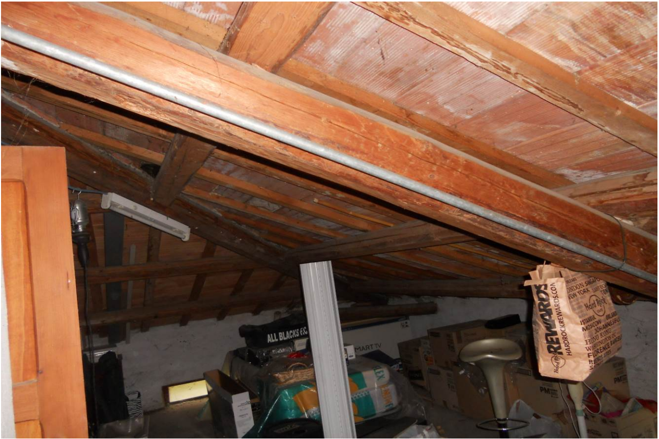
FOTO 26 e 27 – Particolari interni livello sottotetto, ad uso soffitta, al di sopra dell'appartamento al P.1°, unità sub. 3