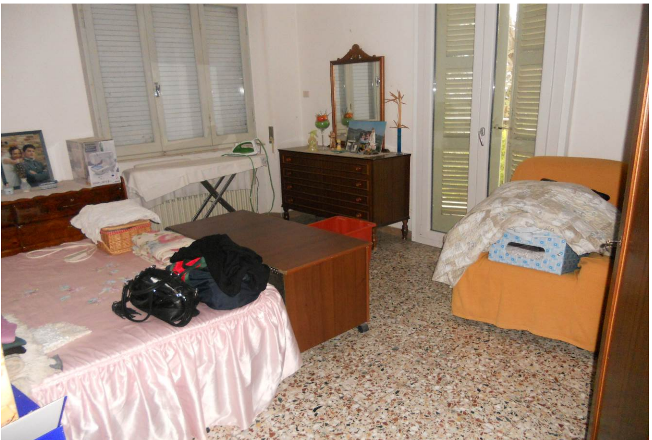
FOTO 13 – Particolare interno camera con terrazzo, appartamento P. Terra, unità sub. 2