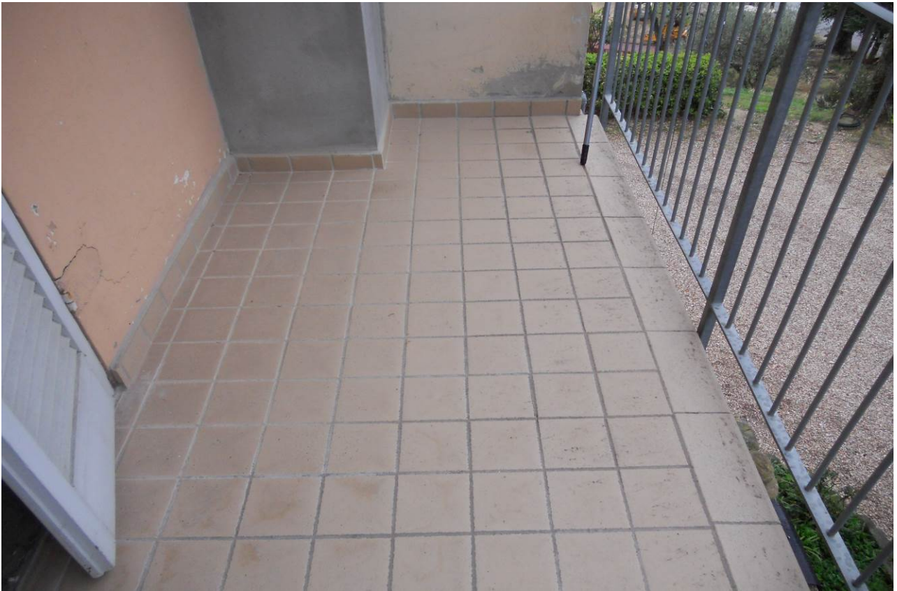
FOTO 14 – Particolare del terrazzo a servizio della camera, appartamento P. Terra, unità sub. 2