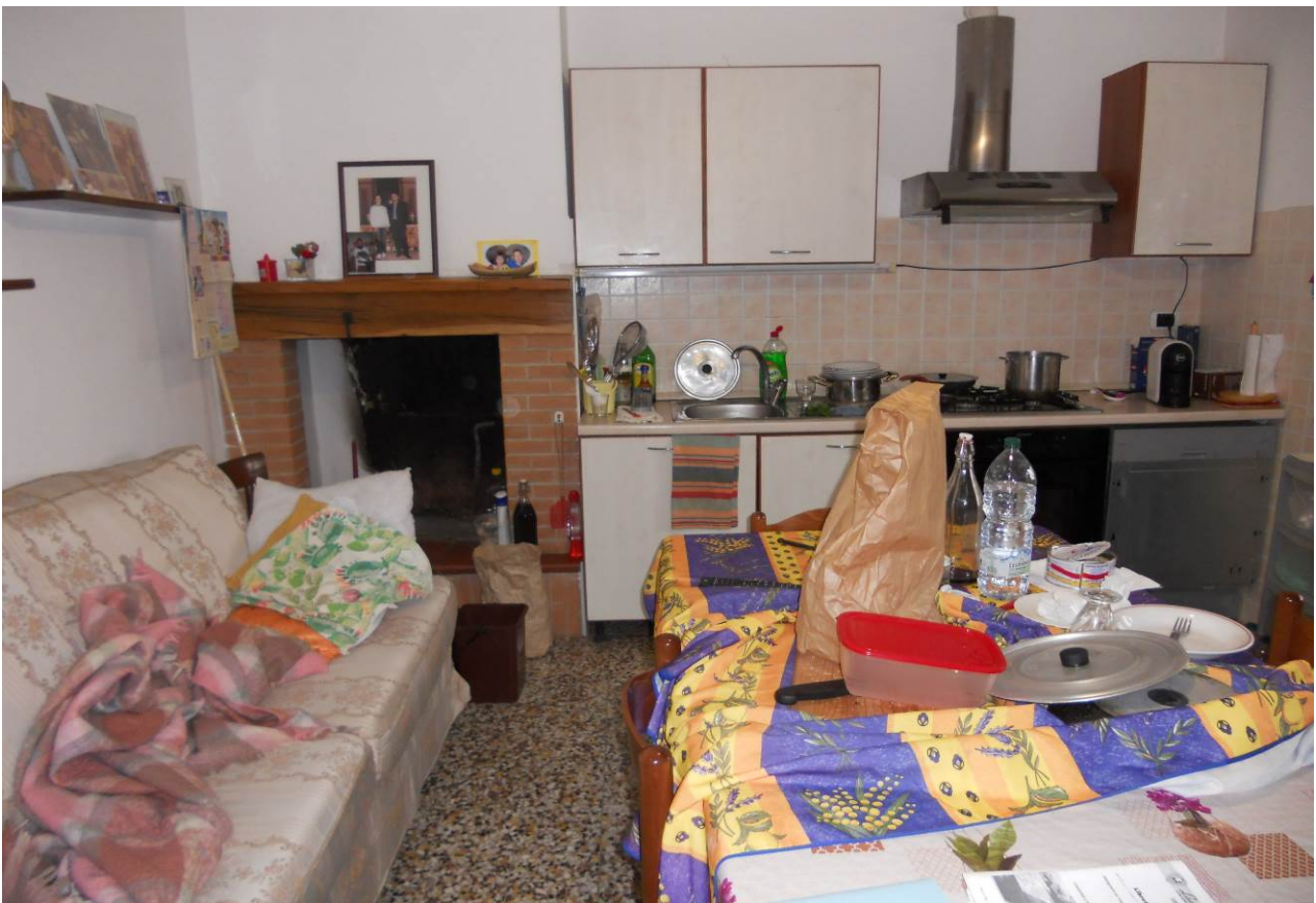
FOTO 9 – Particolare interno cucina-pranzo, appartamento P. Terra, unità sub. 2