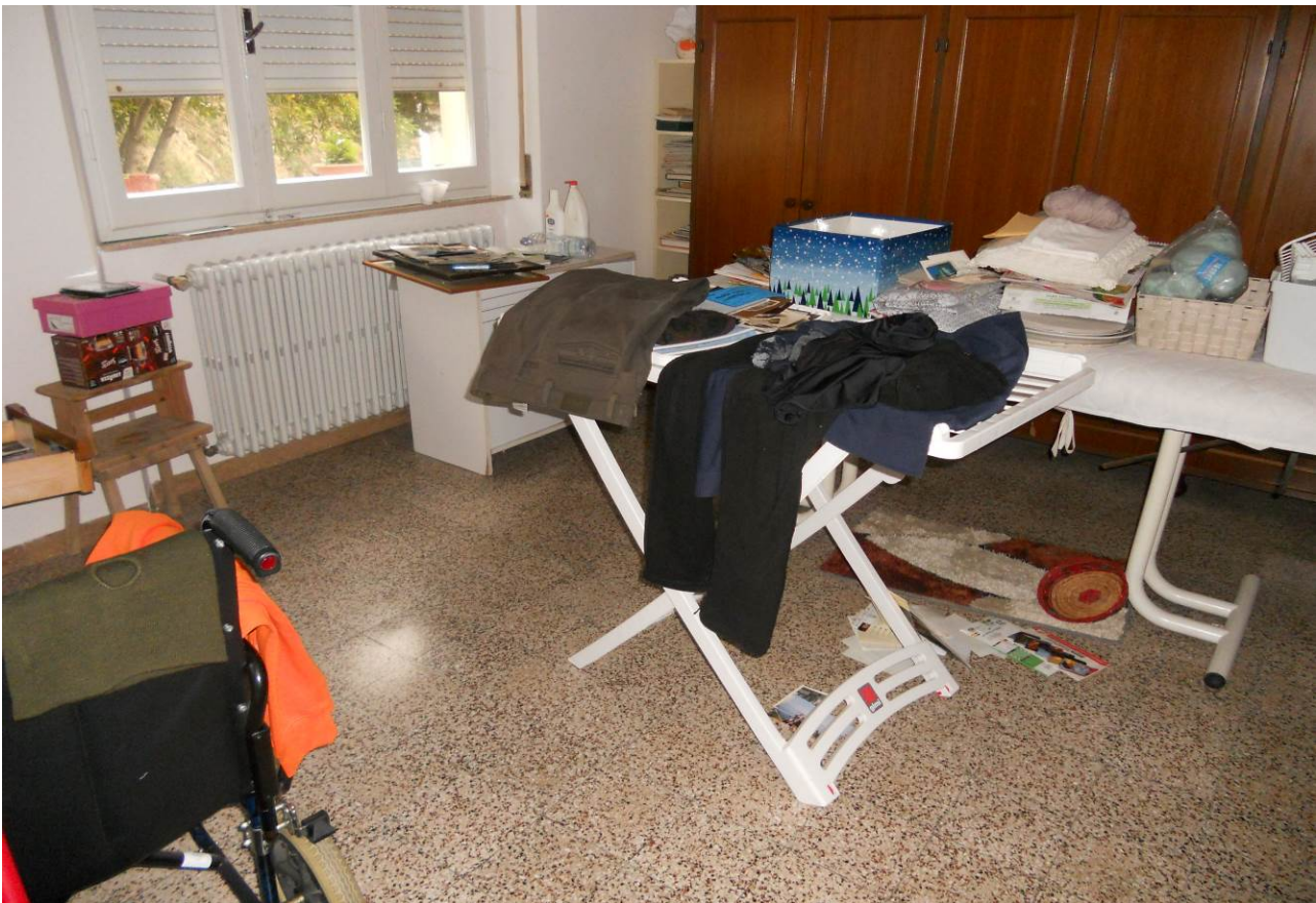
FOTO 11 – Particolare interno camera a fianco del bagno, appartamento P. Terra, unità sub. 2