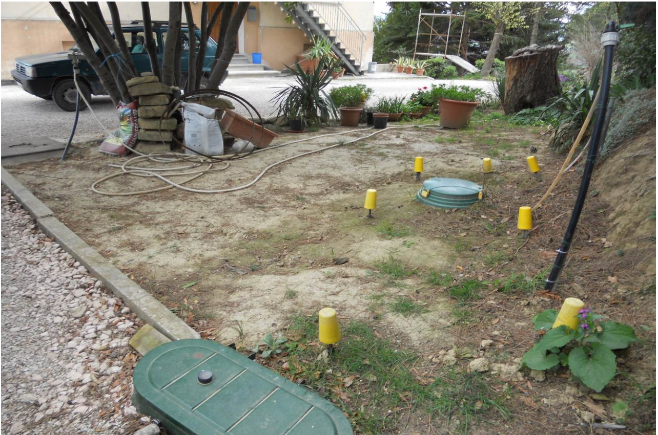
FOTO 6 – Particolare della zona dove risultano installati i serbatoi GPL interrati dei due appartamenti oggetto d' esecuzione (al P.T. unità sub. 2 ed al P.1° unità sub. 3)