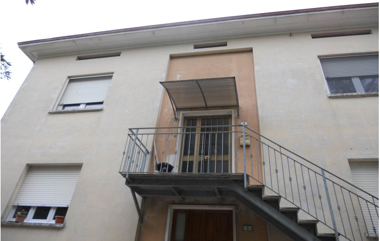
FOTO 15 – Particolare scala esterna di accesso indipendente all'appartamento al P.1°, unità sub. 3