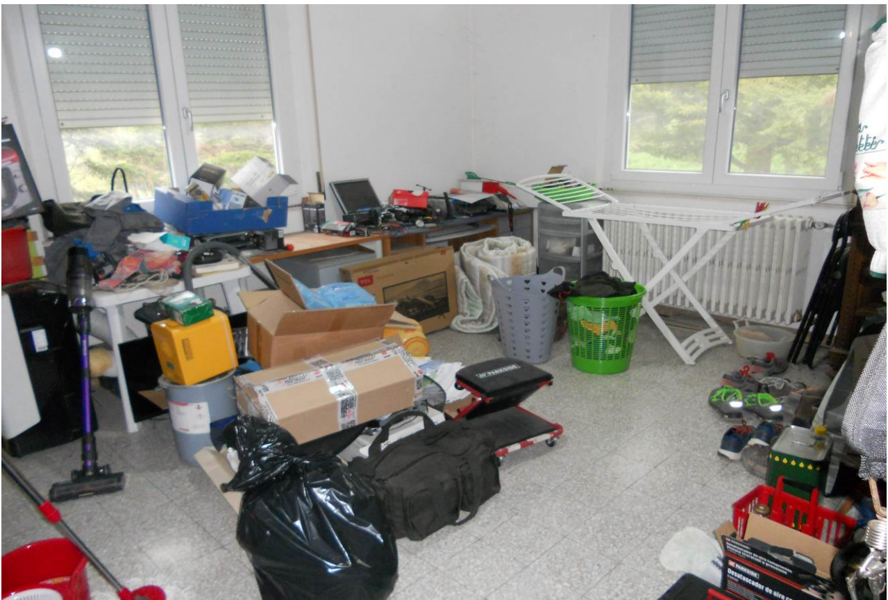
FOTO 25 – Particolare interno camera a destra del vano scala, appartamento al P.1°, unità sub. 3