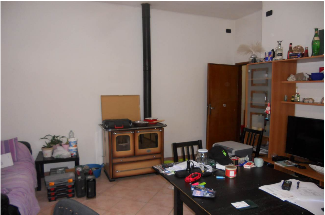
FOTO 20 – Particolare interno cucina-pranzo, appartamento al P.1°, unità sub. 3