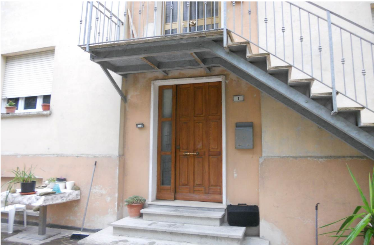
FOTO 7 – Particolare dell'ingresso comune al P. Terra, per l'unità sub. 2 (appartamento P.T.) ed unità sub. 3 (appartamento P.1°)