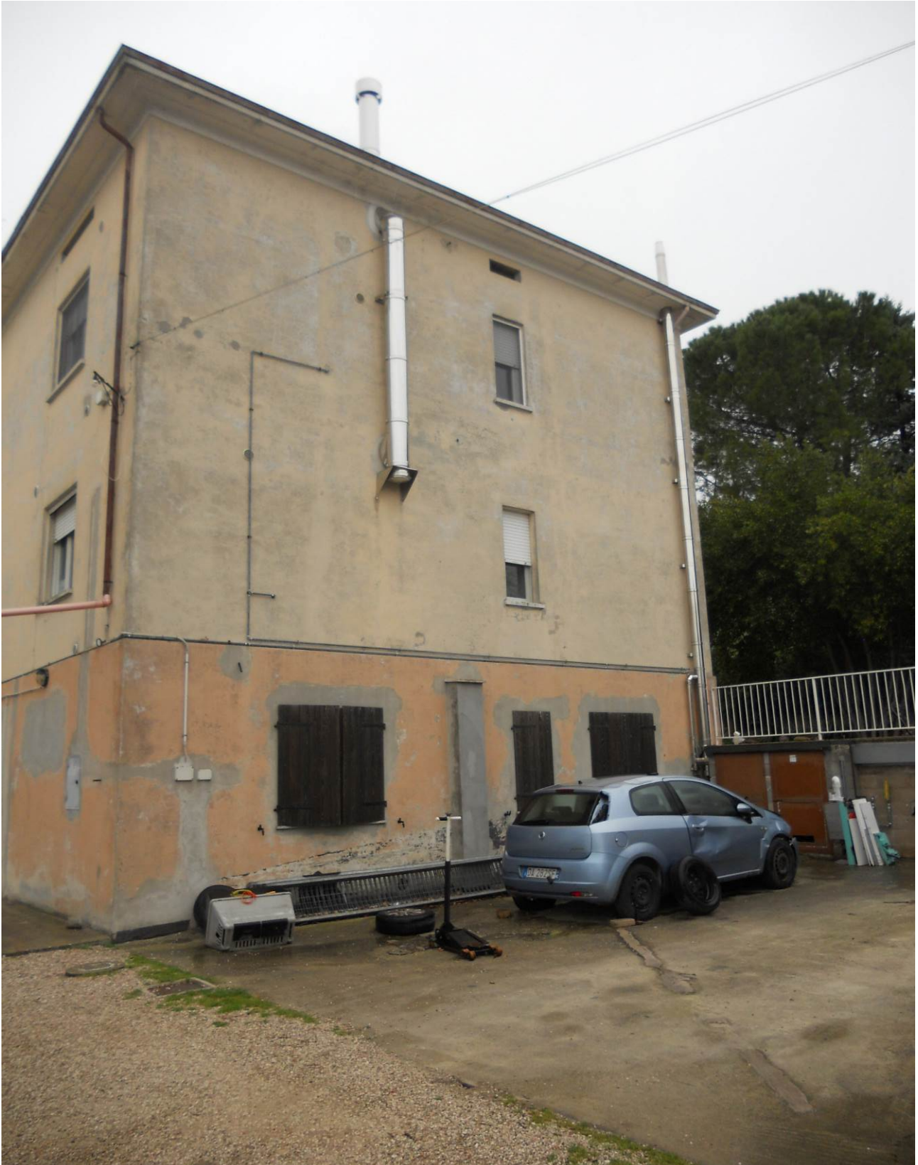
FOTO 5 – Veduta d'insieme, dell'intero fabbricato di cui fanno parte le unità immobiliari oggetto d'esecuzione (che sono appartamento al P.T. unità sub. 2 ed appartamento al P.1°, unità sub. 3); Il Piano Seminterrato 1° è escluso dalla presente procedura esecutiva