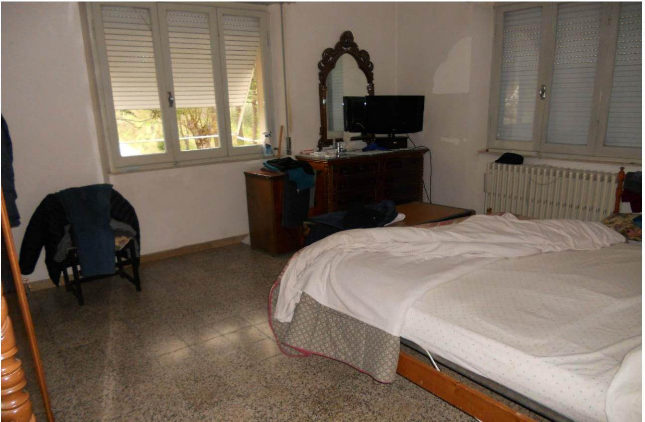
FOTO 12 – Particolare interno camera a destra del vano scala, appartamento P. Terra, unità sub. 2