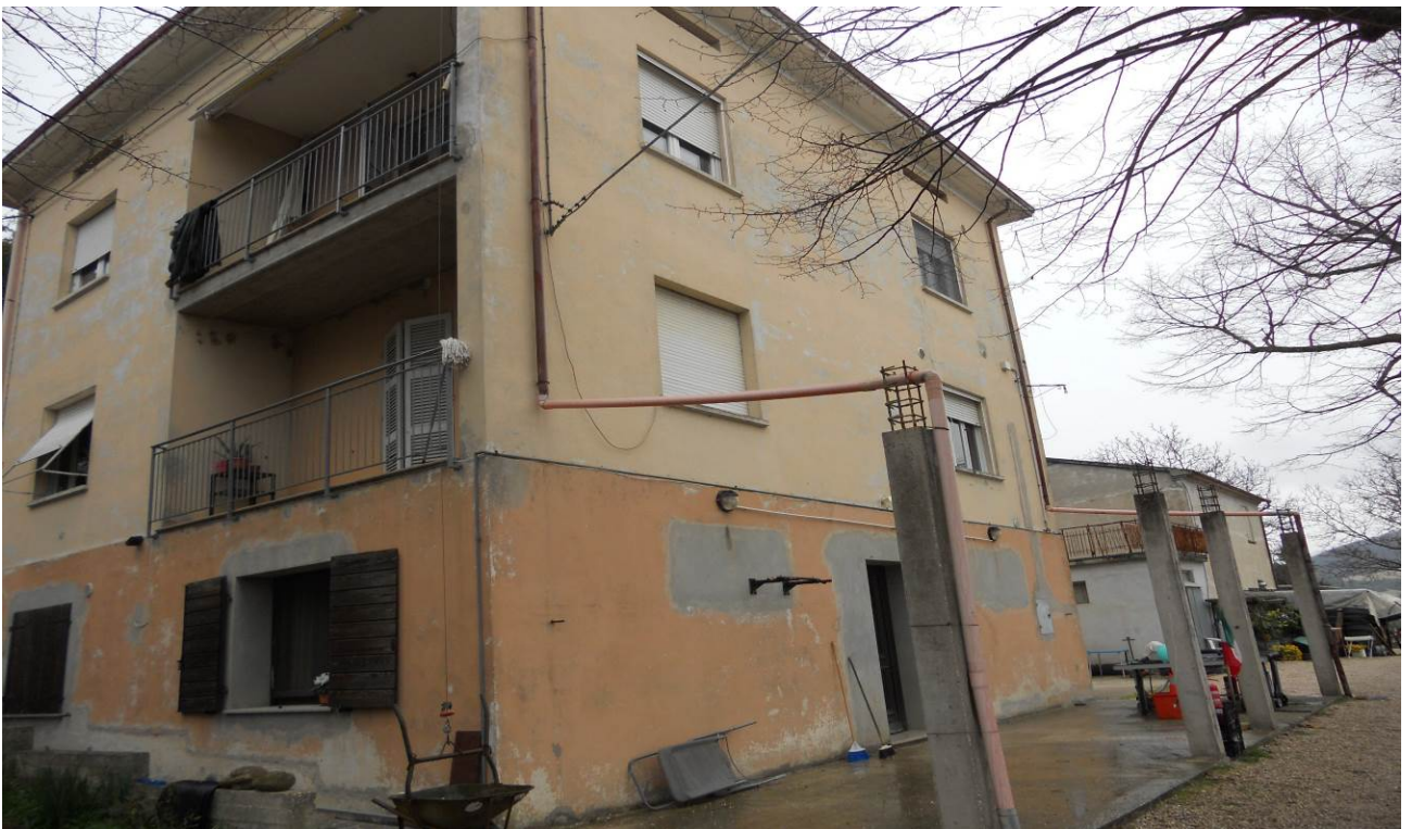
FOTO 4 – Veduta d'insieme, dell'intero fabbricato di cui fanno parte le unità immobiliari oggetto d'esecuzione (che sono appartamento al P.T. unità sub. 2 ed appartamento al P.1°, unità sub. 3); Il Piano Seminterrato 1° è escluso dalla presente procedura esecutiva