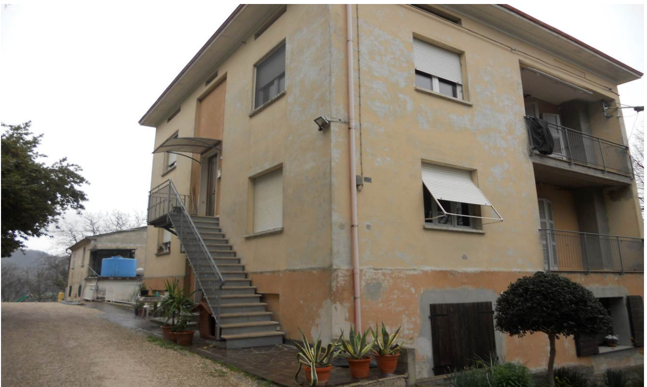
FOTO 2 – Veduta d’insieme, dell’intero fabbricato di cui fanno parte le unità immobiliari oggetto d’esecuzione (che sono appartamento al P.T. unità sub. 2 ed appartamento al P.1°, unità sub. 3); Il Piano Seminterrato 1° è escluso dalla presente procedura esecutiva