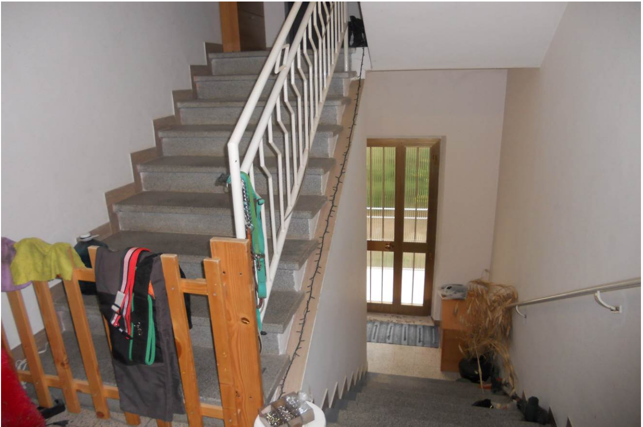
FOTO 18 – Particolare interno vano scala a livello dell'appartamento al P.1°; La scala poi prosegue al soprastante piano sottotetto ad uso soffitta, che non risulta descritto nelle planimetrie catastali ma da considerare accessibile ed in uso dell'appartamento al P.1°, unità sub. 3