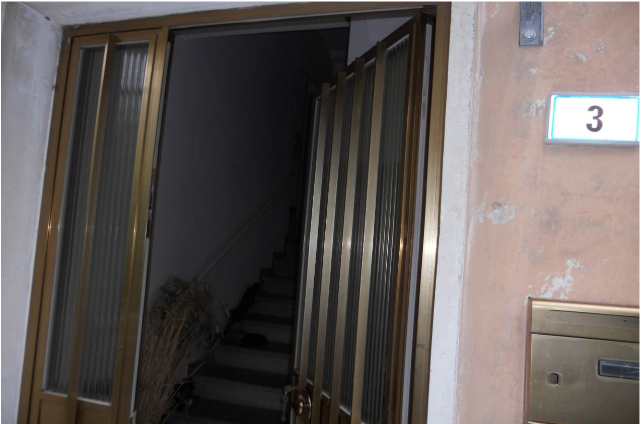
FOTO 16 – Particolare ingresso esterno indipendente, appartamento al P.1°, unità sub. 3