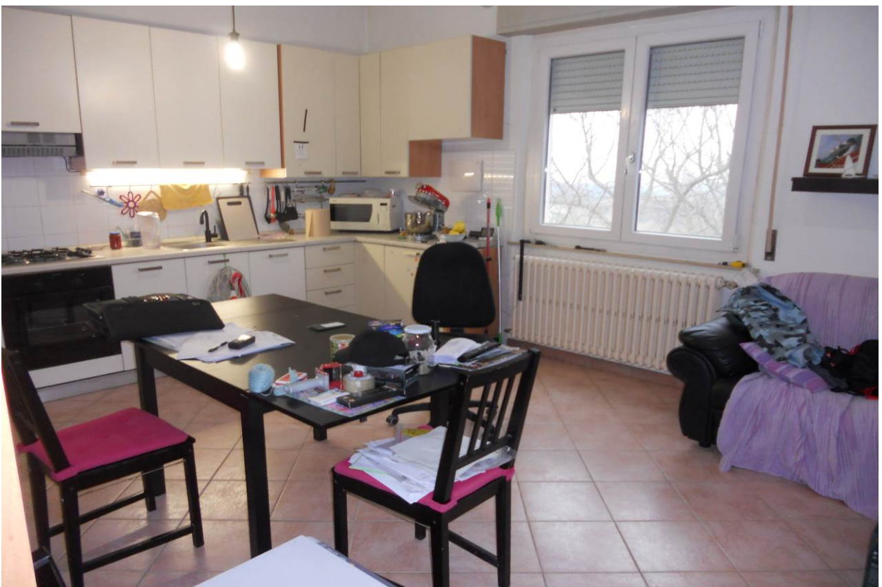
FOTO 19 – Particolare interno cucina-pranzo, appartamento al P.1°, unità sub. 3