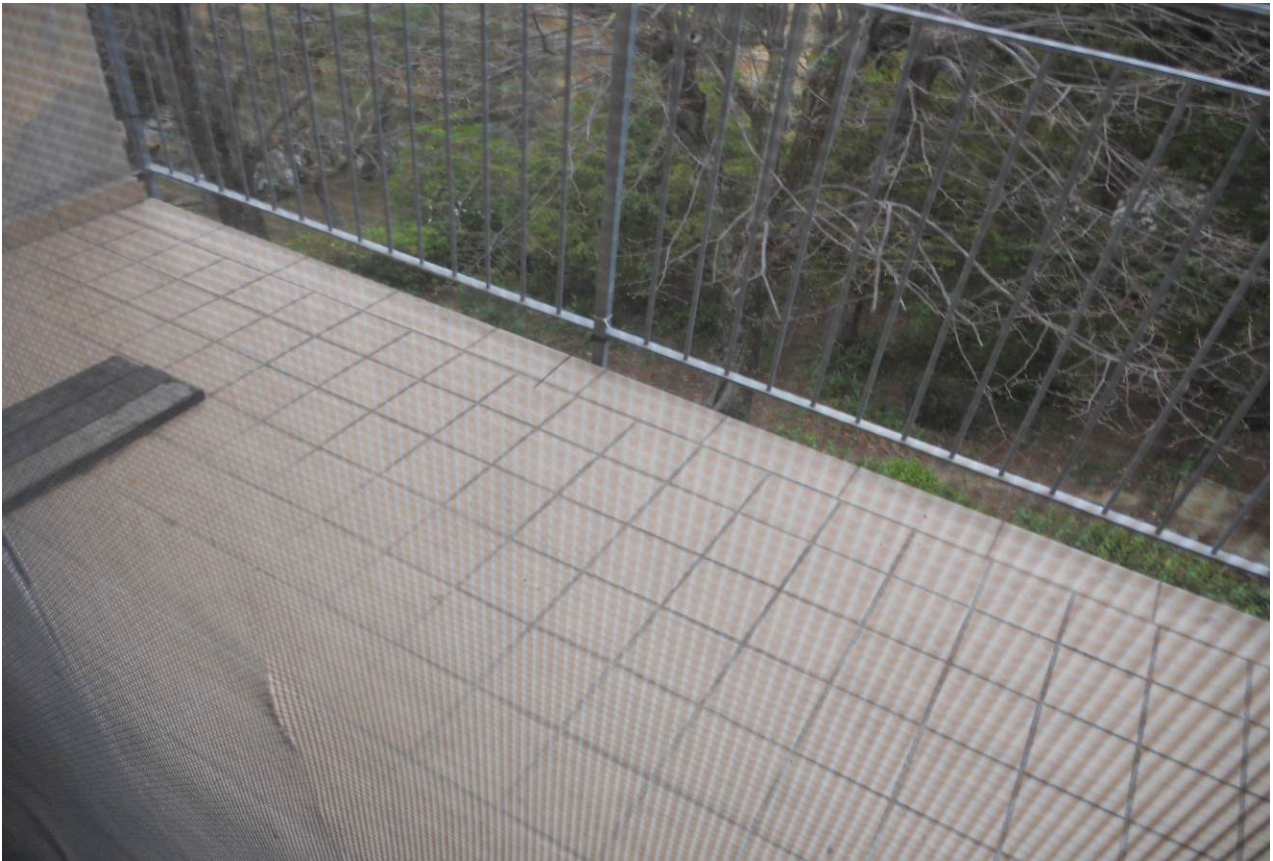
FOTO 24 – Particolare del terrazzo a servizio della camera, appartamento al P.1°, unità sub. 3