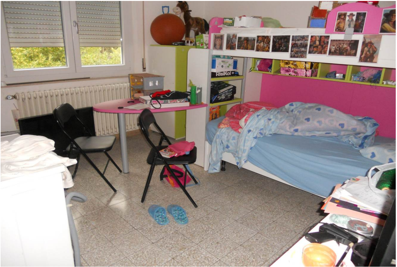
FOTO 22 – Particolare interno camera a fianco del bagno, appartamento al P.1°, unità sub. 3