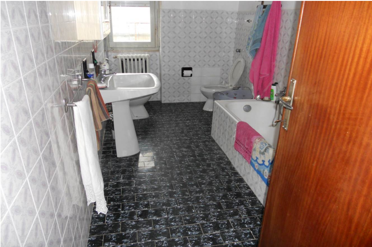
FOTO 10 – Particolare interno bagno, appartamento P. Terra, unità sub. 2