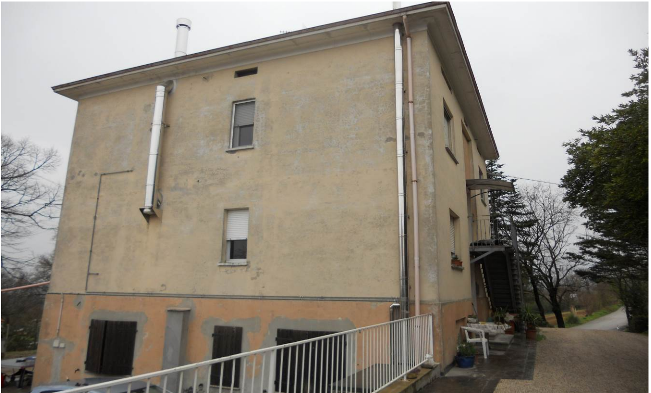
FOTO 3 – Veduta d'insieme, dell'intero fabbricato di cui fanno parte le unità immobiliari oggetto d'esecuzione (che sono appartamento al P.T. unità sub. 2 ed appartamento al P.1°, unità sub. 3); Il Piano Seminterrato 1° è escluso dalla presente procedura esecutiva