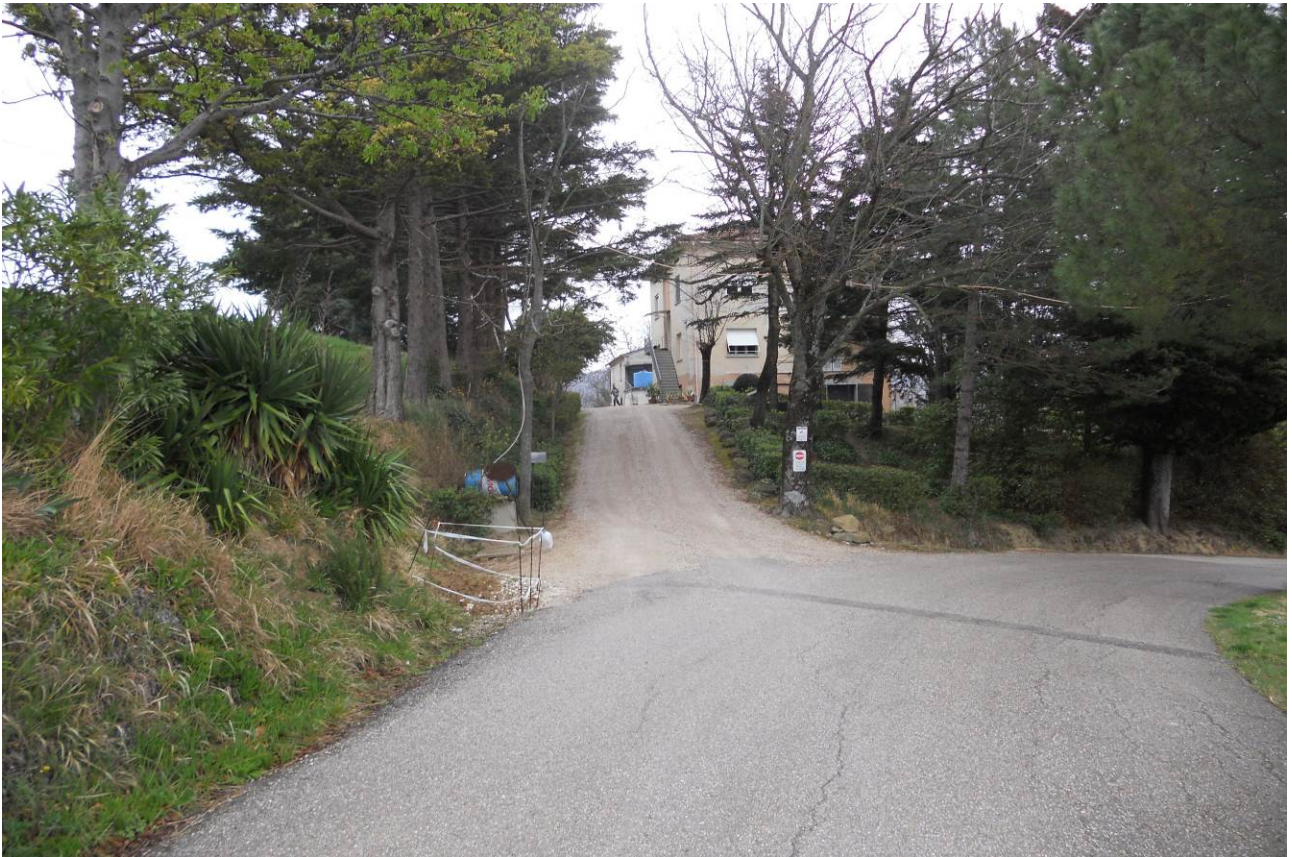
FOTO 1 – Veduta d’insieme, dalla Via Strada Villa Fiorenza, della zona di accesso dell’intero fabbricato di cui fanno parte le unità immobiliari oggetto d’esecuzione