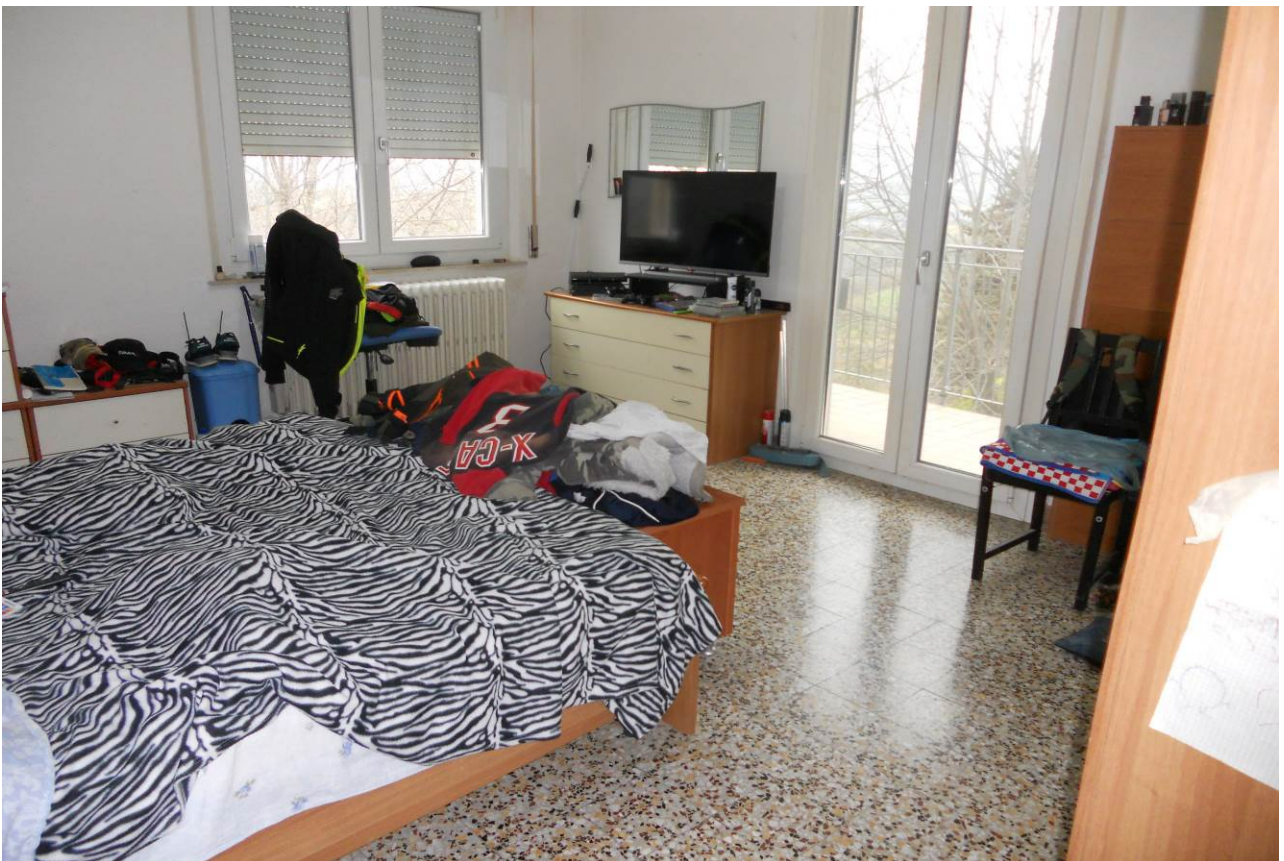
FOTO 23 – Particolare interno camera con terrazzo, appartamento al P.1°, unità sub. 3