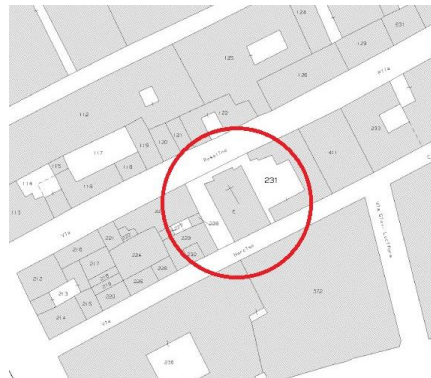
Stralcio Mappa catastale