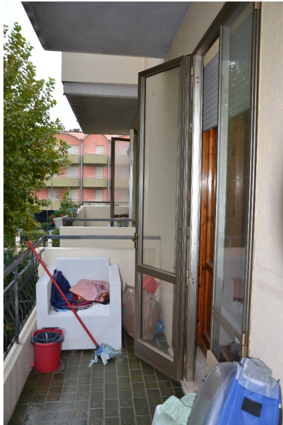
Balcone con vista verso mare