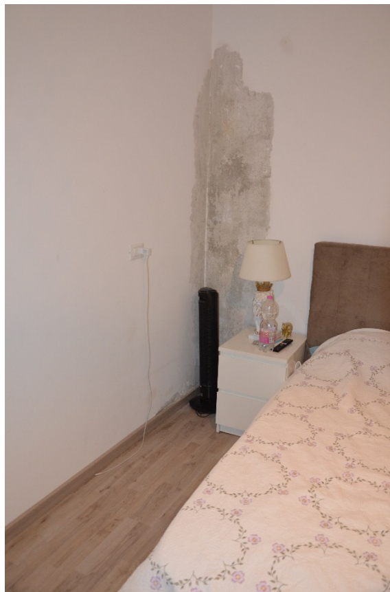
Camera da letto, sulla parete una infiltrazione esterna