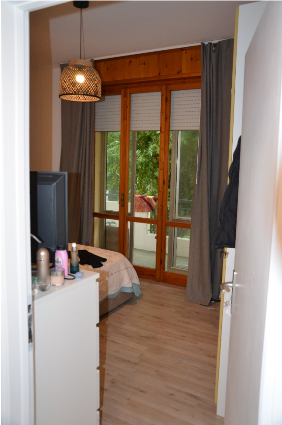
Camera con accesso al balcone