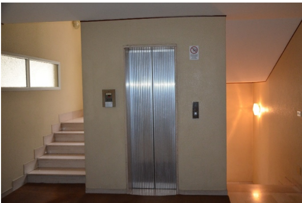
Al piano terra l'ascensore e le scale di accesso ai piani superiori ed al piano interrato