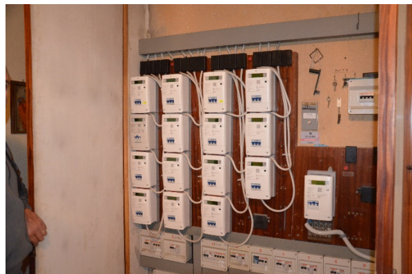
Vano contatori condominiale