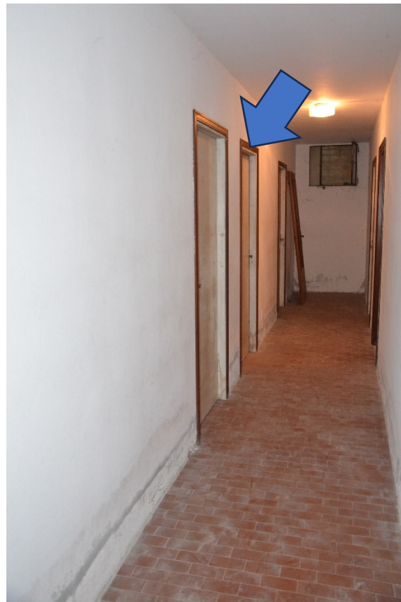
Piano interrato, corridoio di accesso alle Cantine, indicata la cantina di pertinenza.