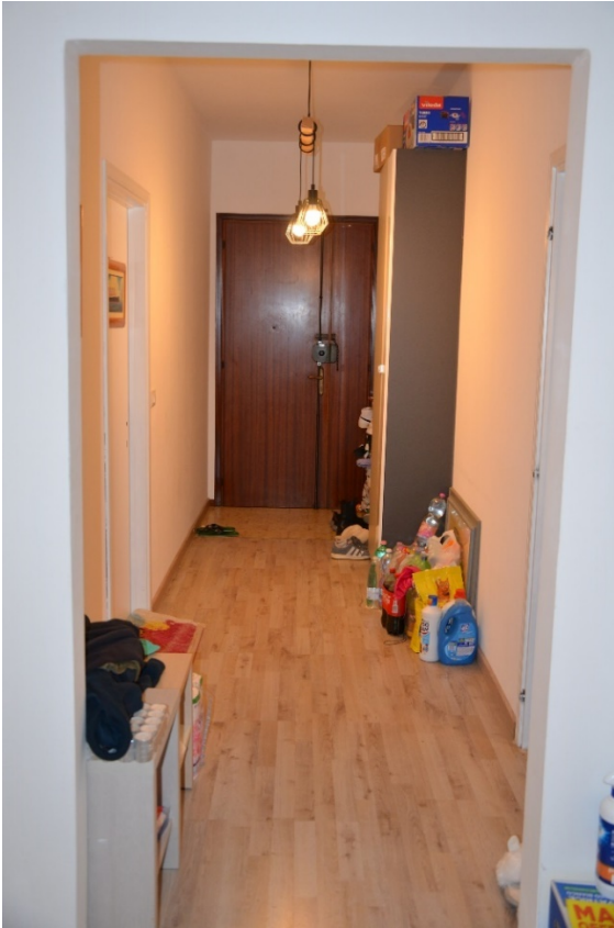
Corridoio verso l'ingresso