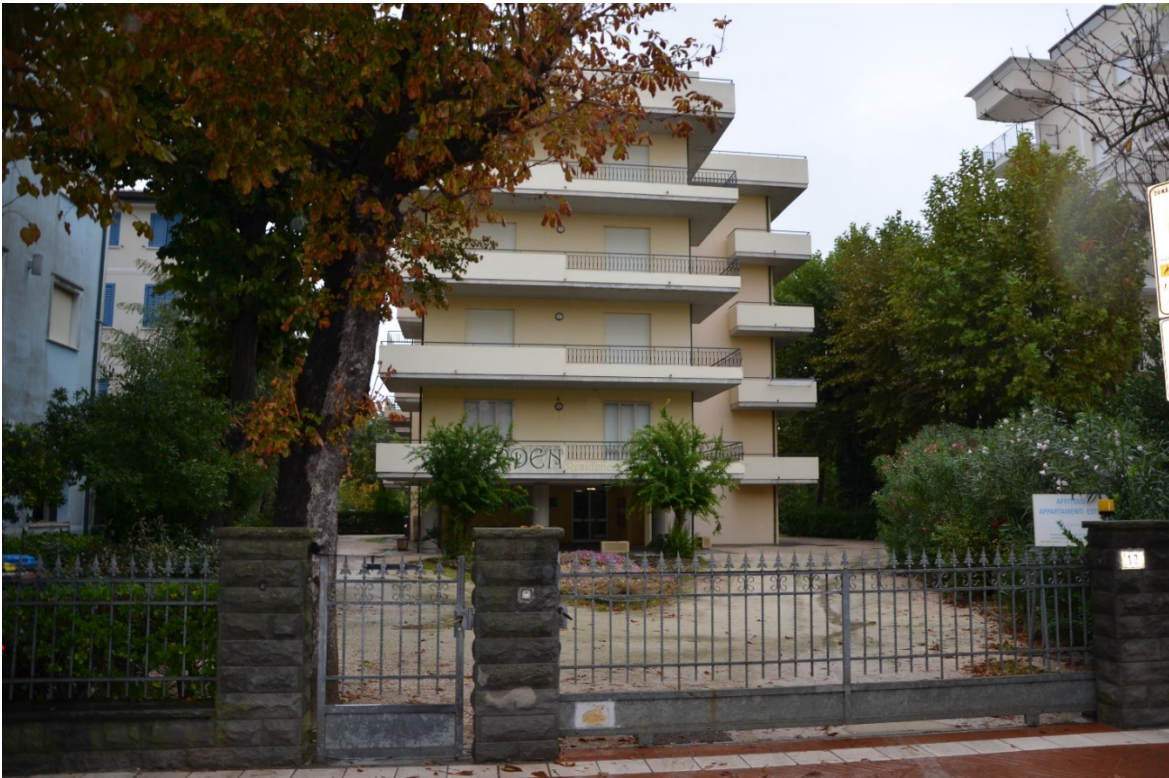
Ingresso pedonale e carrabile dalla via Italia.