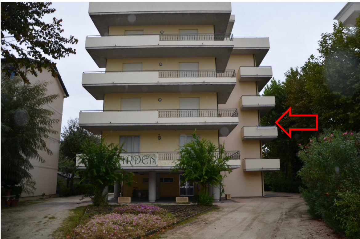
Area comune ai condomini con la possibilità di parcheggio come da Regolamento Condominiale. L'appartamento è collocato al secondo piano, nella porzione a N/E