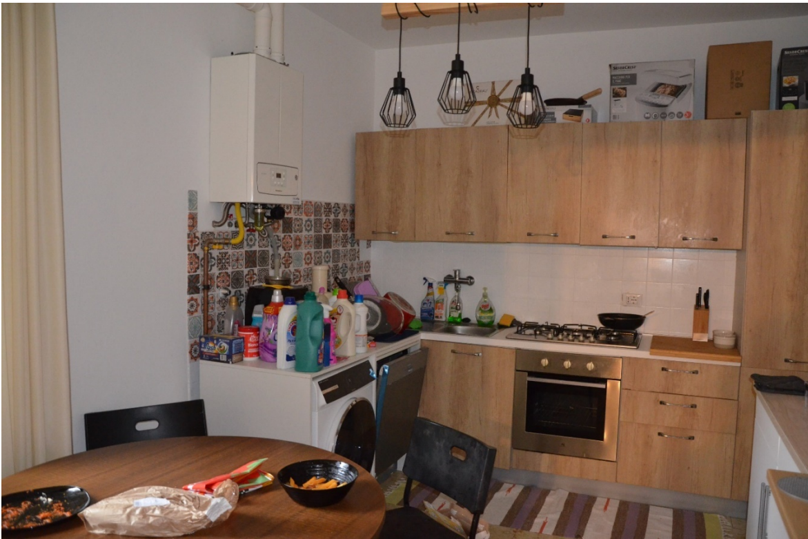
Cucina, sulla parte la caldaia del riscaldamento, della cui regolarità si rimandata alla relazione