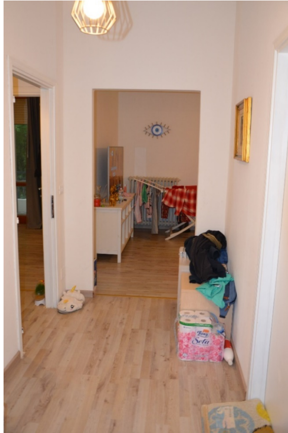
Disimpegno zona notte