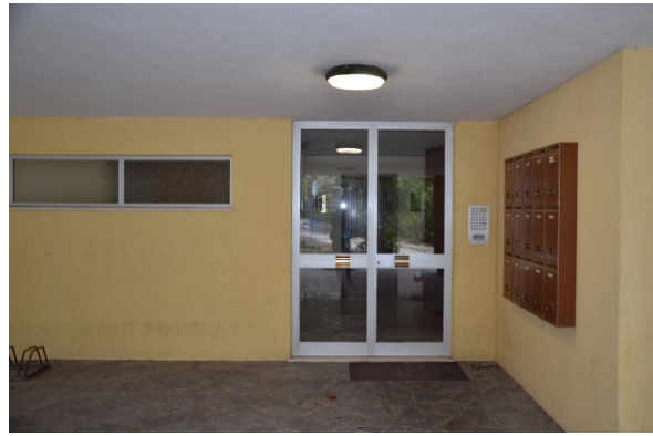
Ingresso al condominio nel porticato