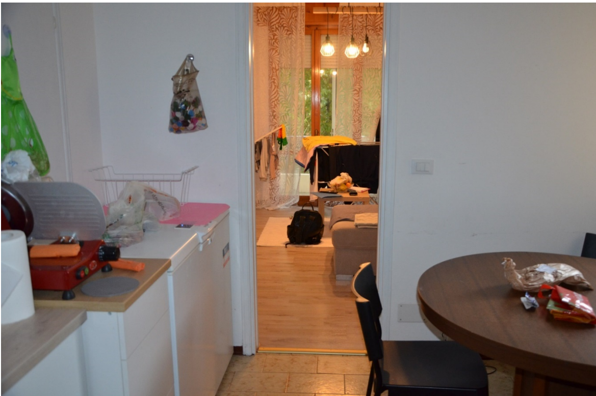
Cucina e soggiorno