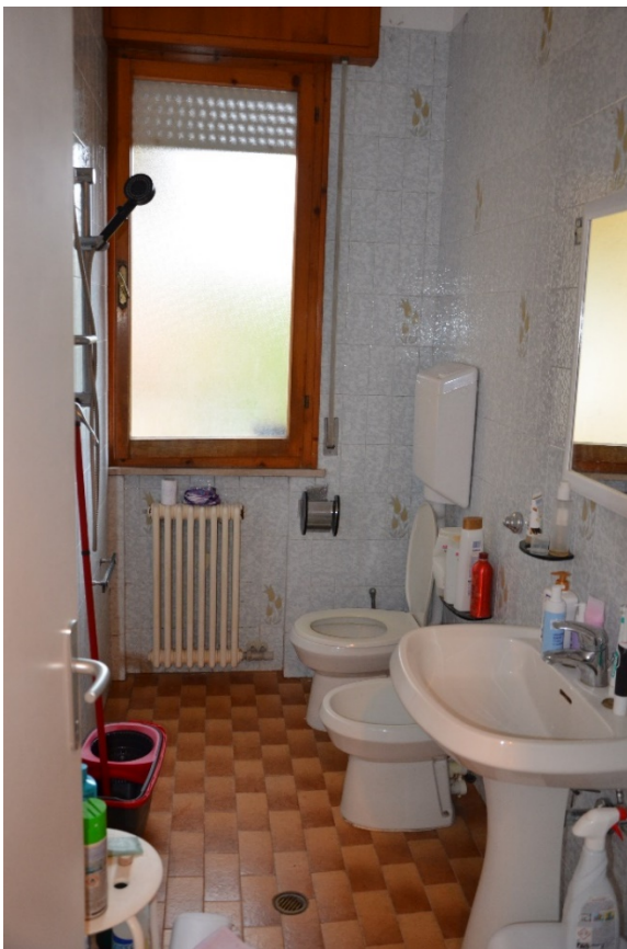
Bagno con doccia, pavimenti e sanitari dell'epoca