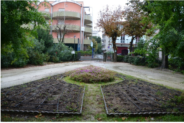
Vista verso l'ingresso carrabile e pedonale