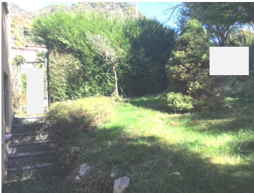
Ingresso pedonale e giardino lato Est