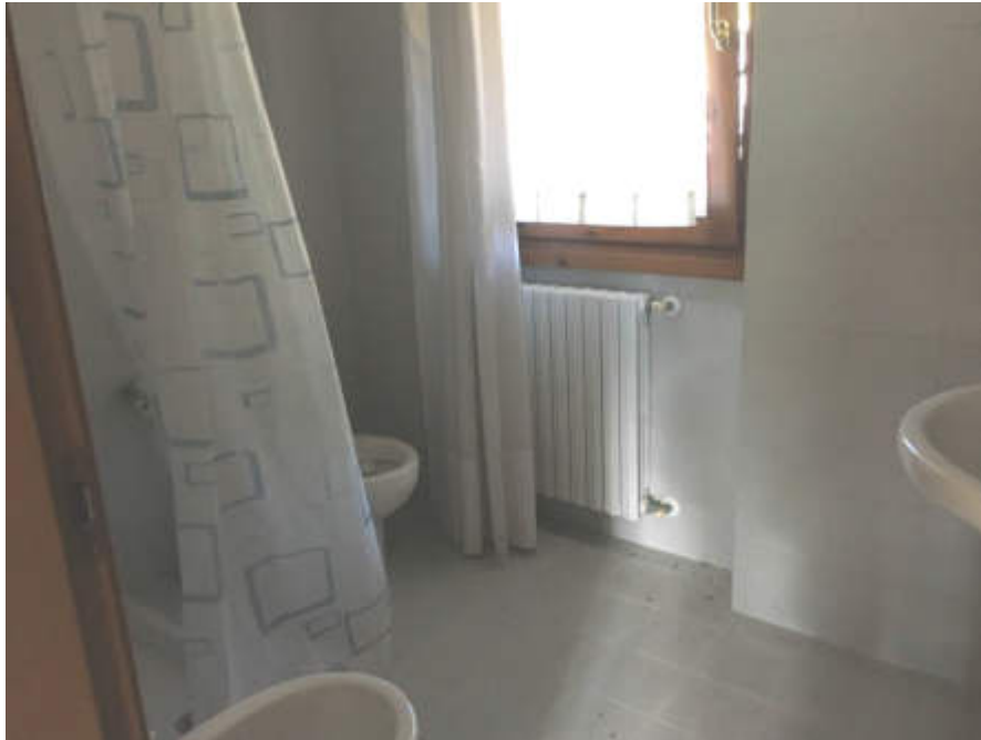
Bagno al piano terra