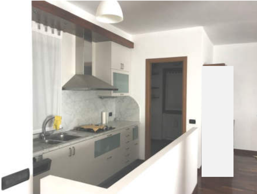
Angolo cottura al piano primo