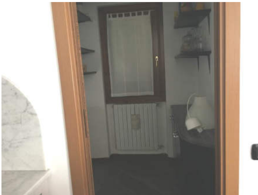
Dispensa al piano primo