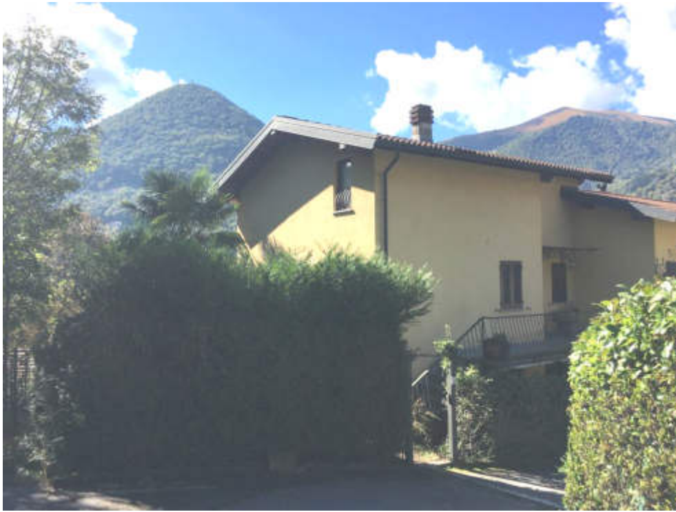
Prospetto Nord e accessi