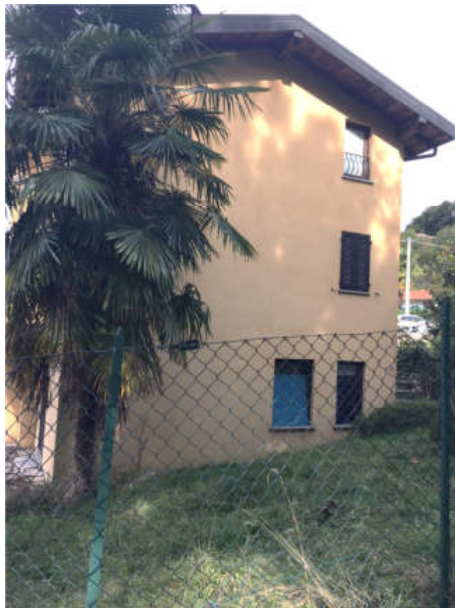
Prospetto Est e giardino