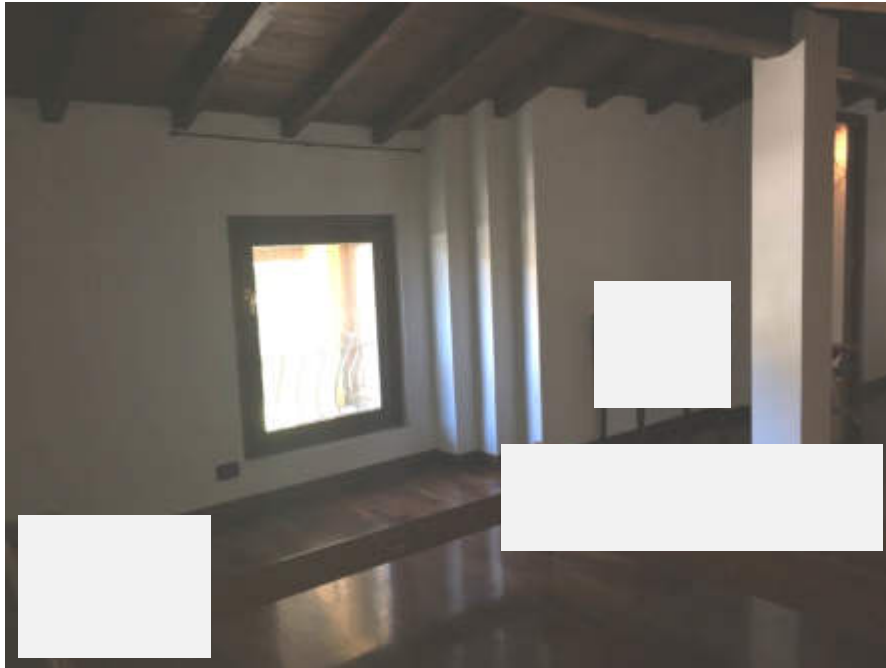
Vano al piano sottotetto, verso la scala interna