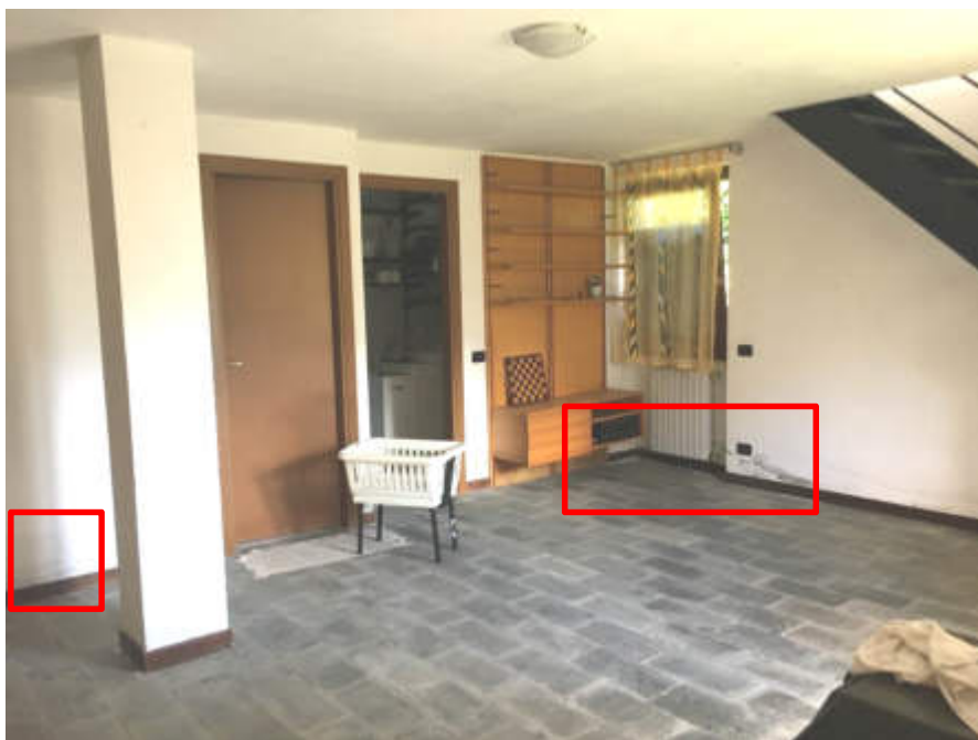
Vano principale al piano terra, verso la scala interna.