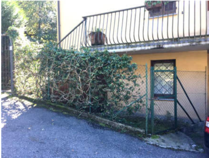
Dettaglio prospetto Nord