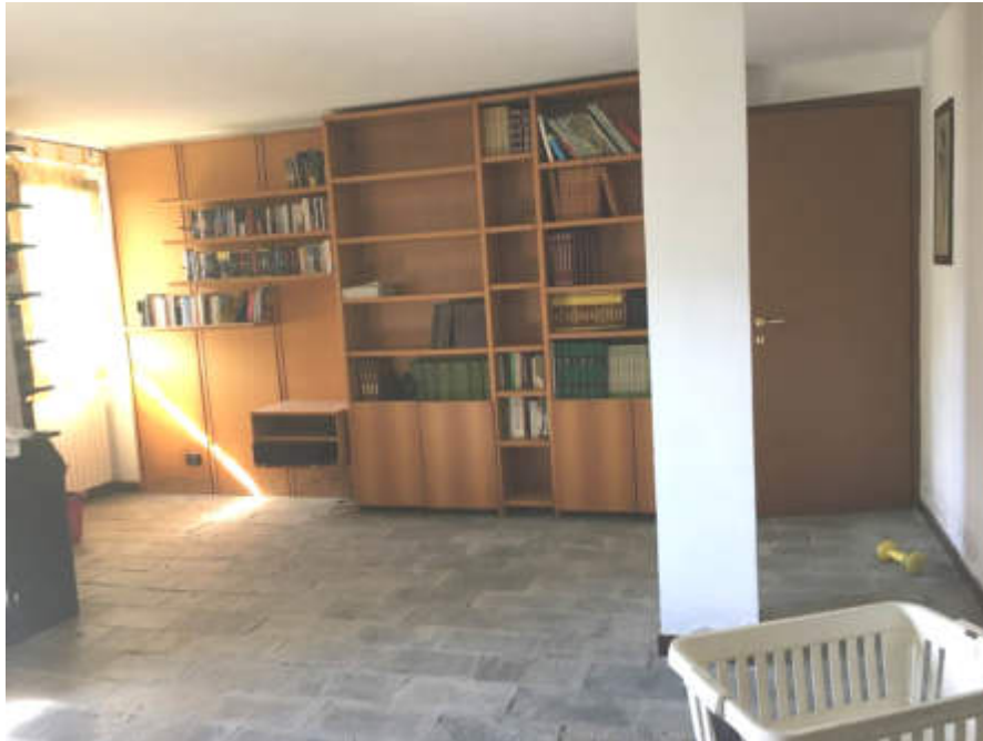
Vano principale al piano terra, dalla scala interna