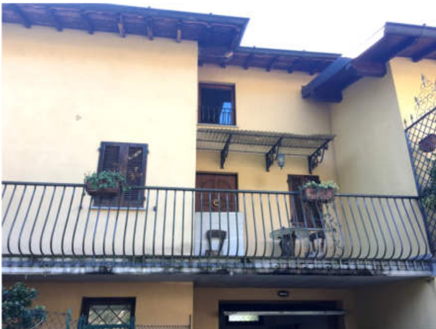
Dettaglio prospetto Nord