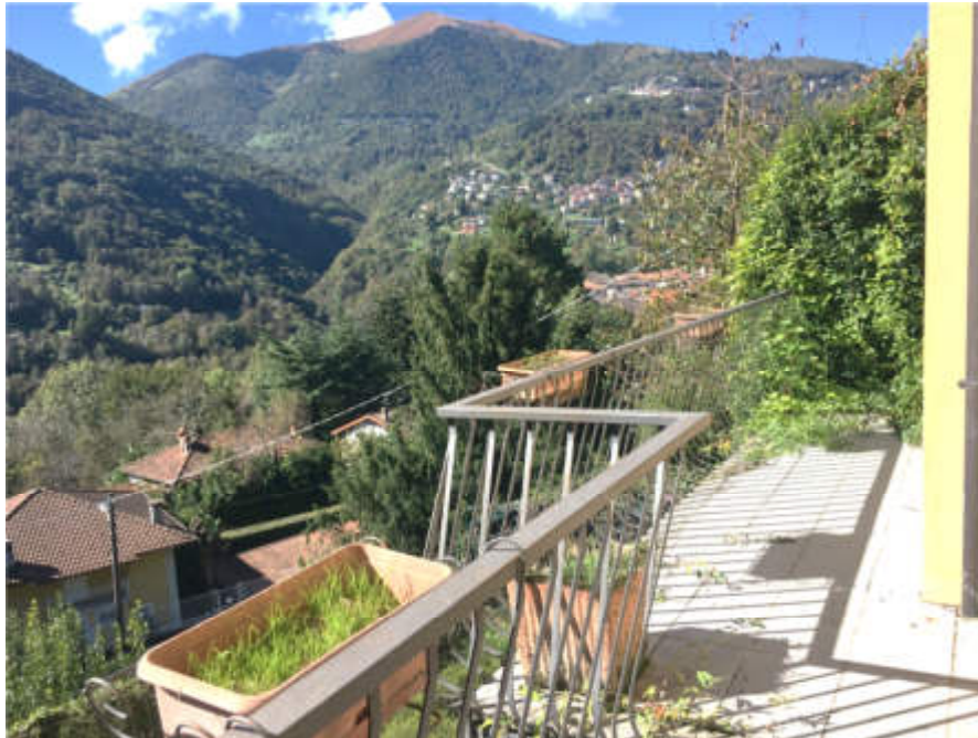
Vista dal balcone Sud