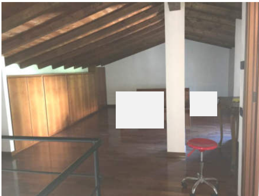
Vano al piano sottotetto, dalla scala interna