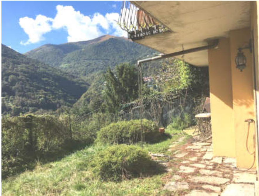
Giardino lato Sud