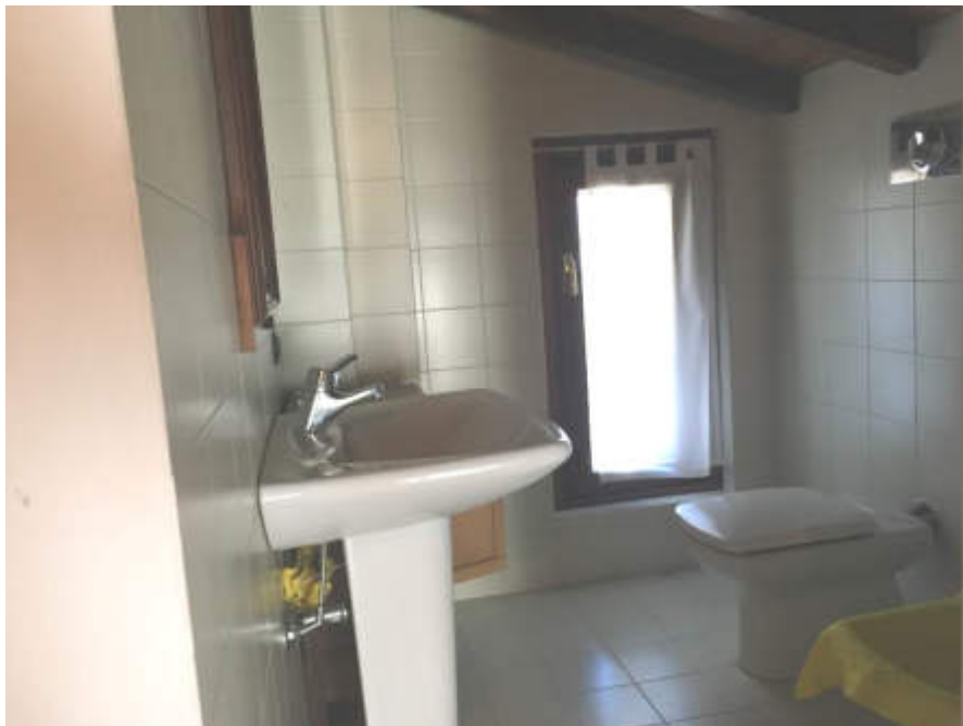
Bagno al piano sottotetto