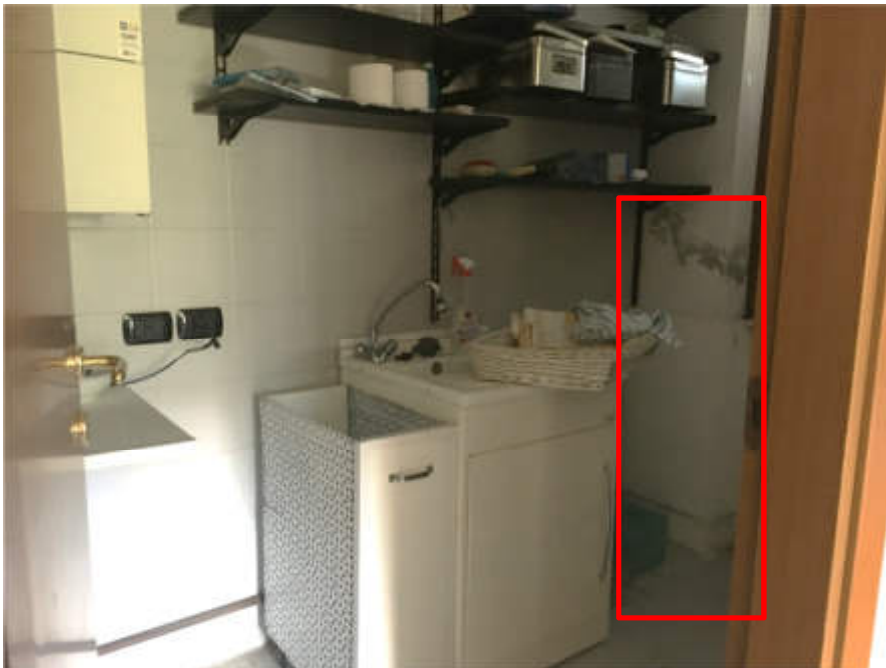
Lavanderia al piano terra