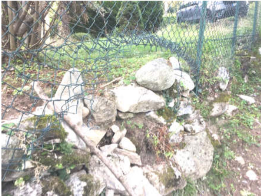
Recinzione da ripristinare