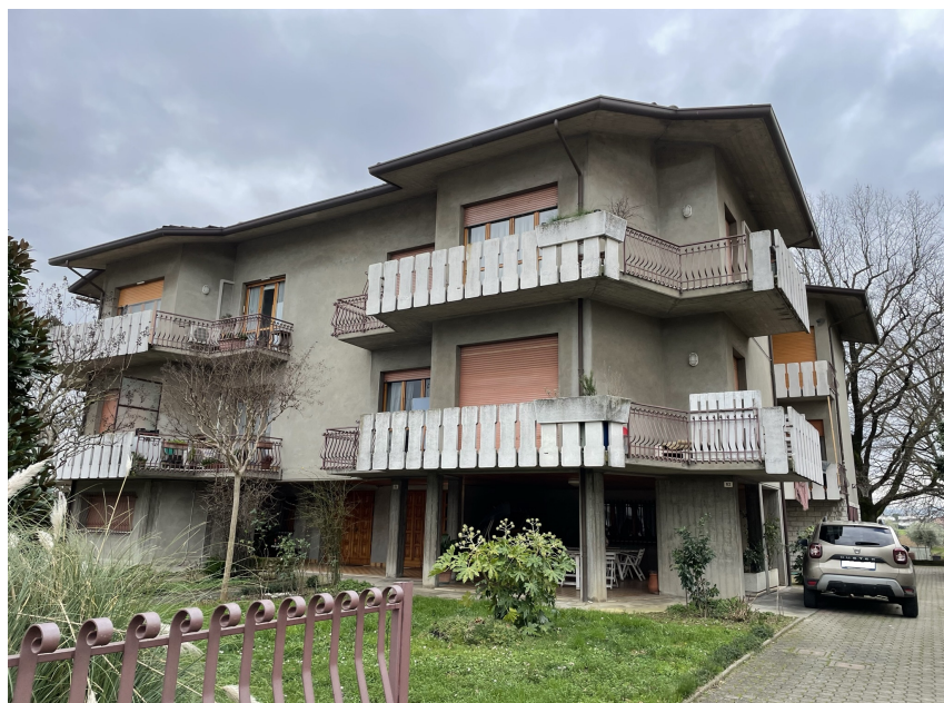
Vista esterna del fabbricato

E' stato eseguito anche un dettagliato rilievo fotografico degli esterni ed interni, ed alcune foto, più significative, si includono di seguito.