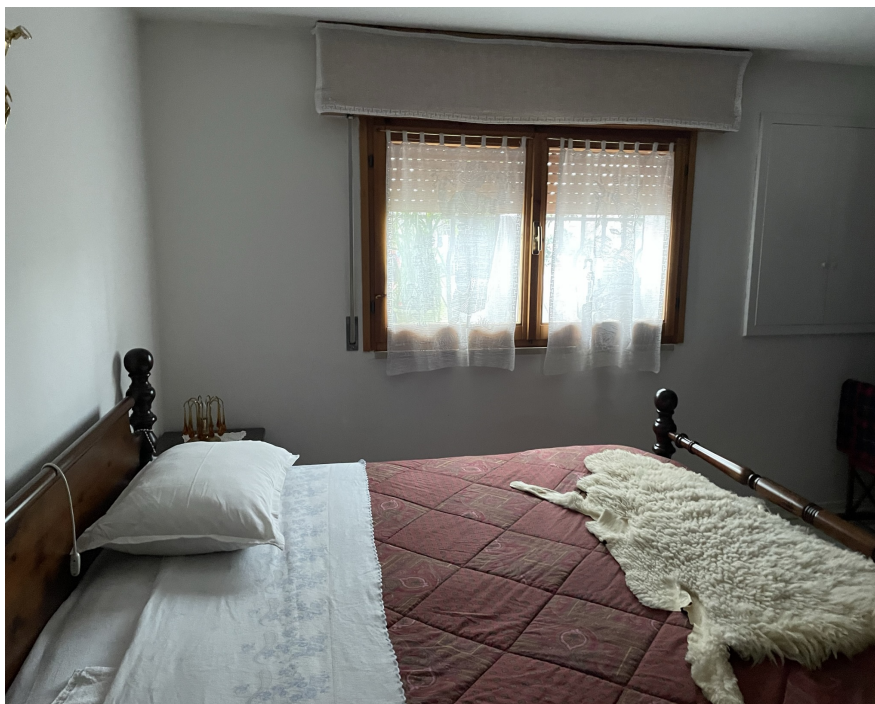
Piano terra - Letto