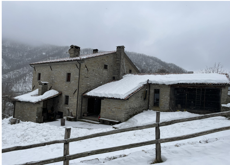
Vista esterna del fabbricato

E' stato eseguito anche un dettagliato rilievo fotografico degli esterni ed interni, ed alcune foto, più significative, si includono di seguito.