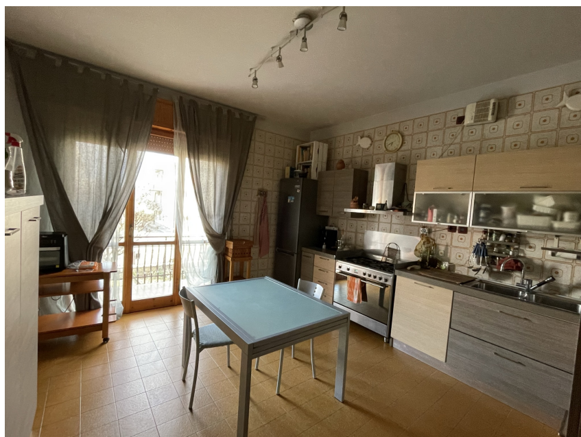
Piano primo – Cucina