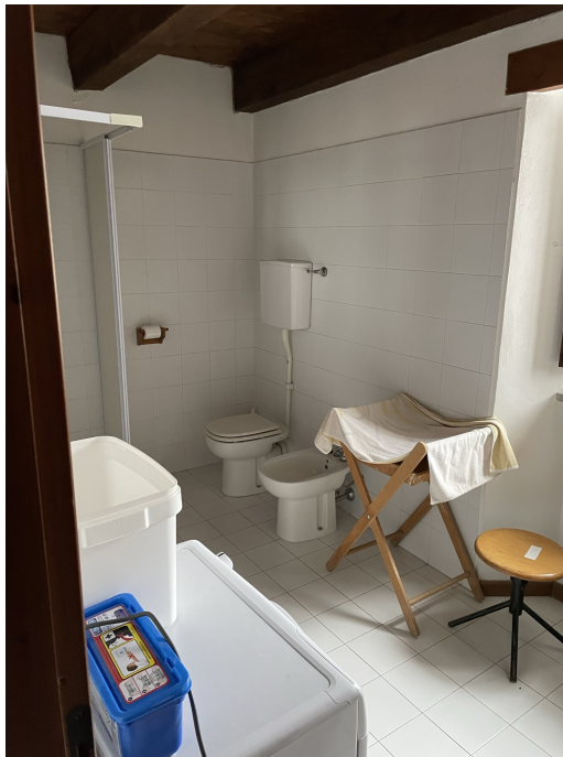
Bagno piano terra