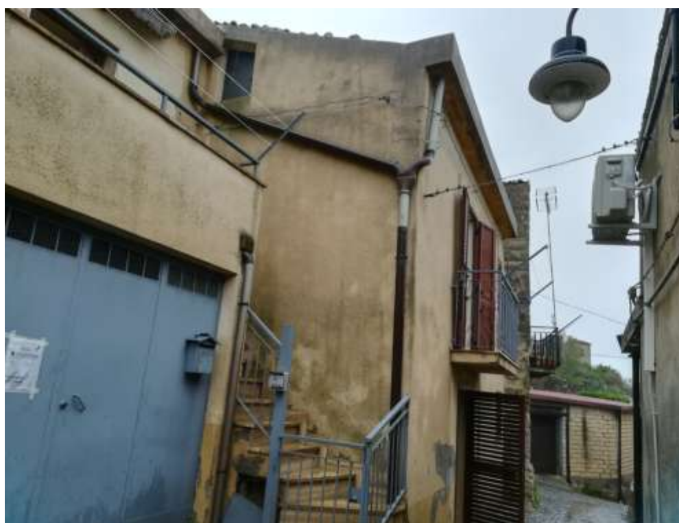
Foto n. 4- Ingresso garage e scala di accesso esterna