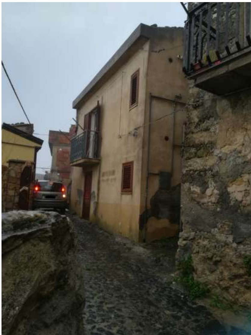
Foto n.3 - Esterno