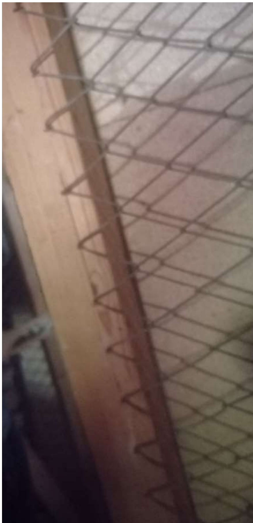
FOTO 28: le pareti di legno e reti che delimitano le singole cantine