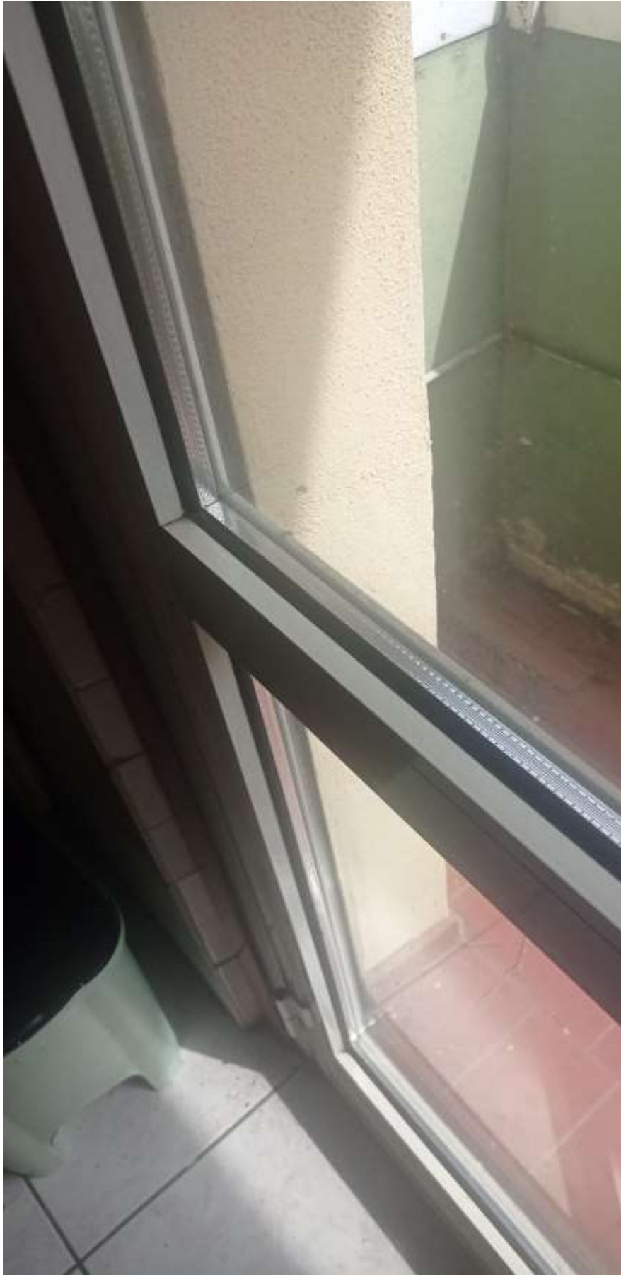
FOTO 23: particolare dei serramenti con vetro camera e del pavimento