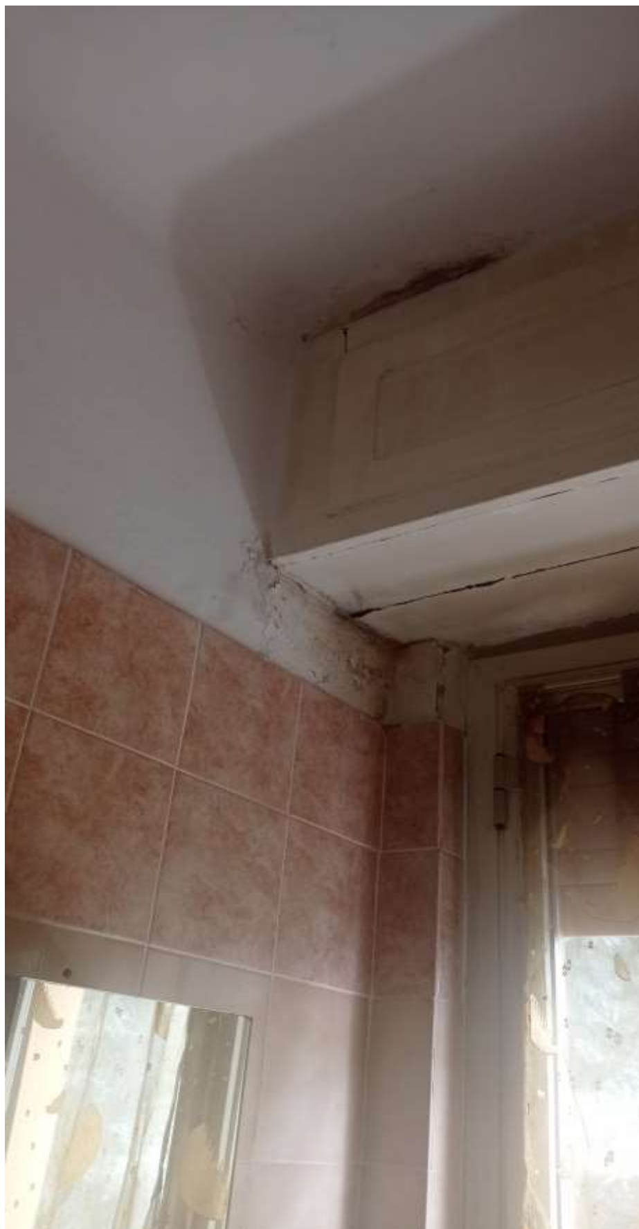
FOTO 29: particolare della macchia di umidità sul plafone nel bagno passante su quello della cucina