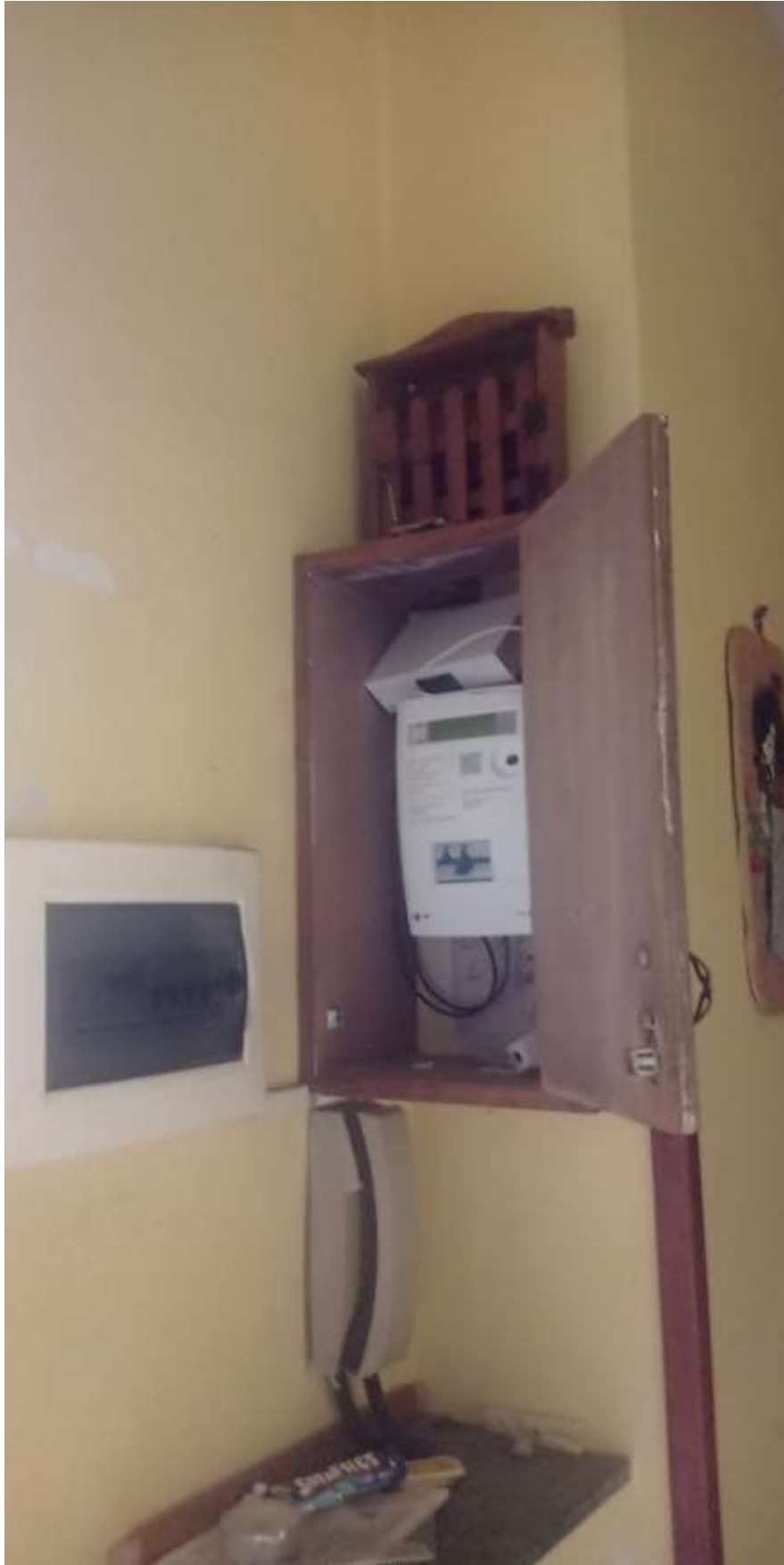
FOTO 13: il corridoio, particolari del contatore elettrico, del salvavita e del citofono