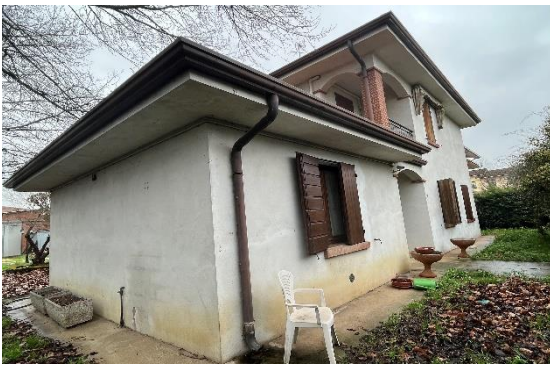
3 Casa da angolo giardino