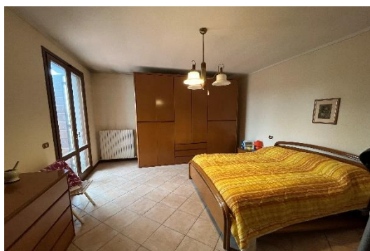
13 Letto C