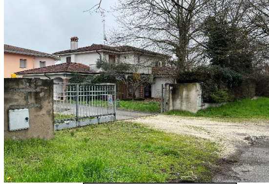
2 Vista da via Di Vittorio