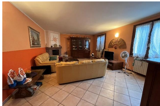
4 Camera soggiorno