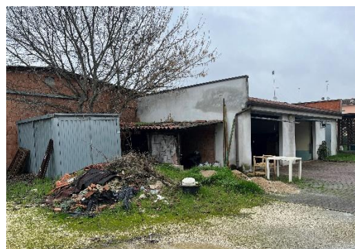
16 (Autorimessa) e LOCALI vicini non conformi