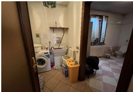
7 Bagno.Lavanderia pT