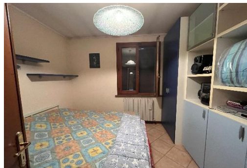
10 Letto A