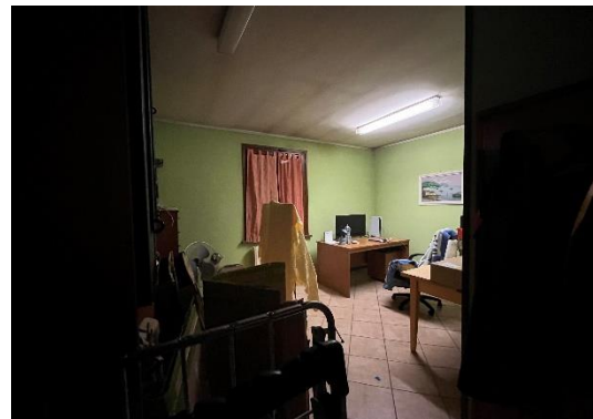
8 Camera studio