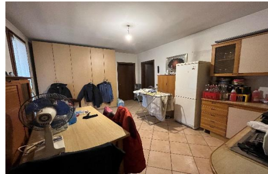
6 Camera intermedia pT