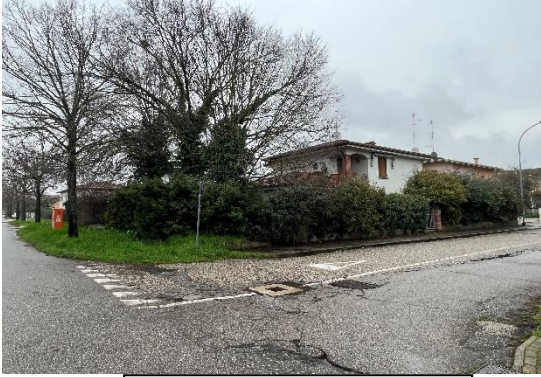
1 Vista da via Grandi