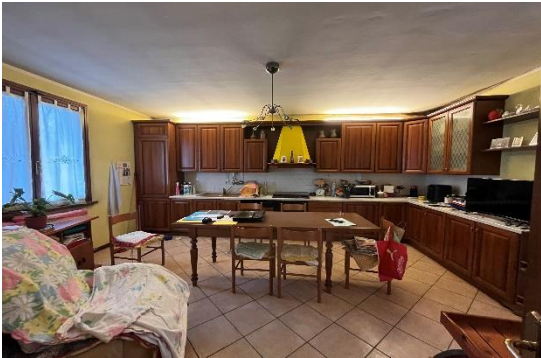
5 Camera cucina