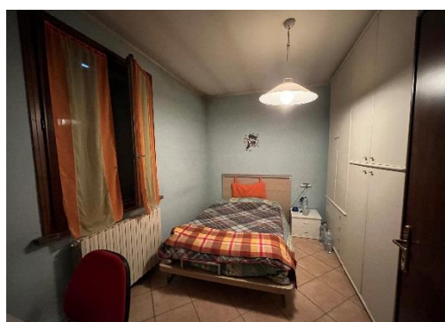
11 Letto B