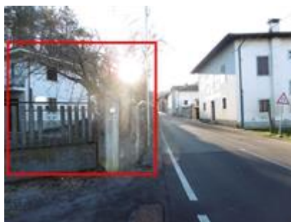
Zona di inserimento compendio