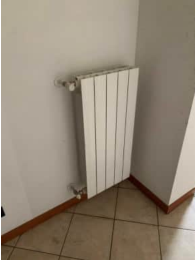
Termosifoni in alluminio