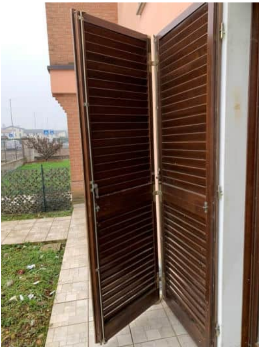
Griglie in legno