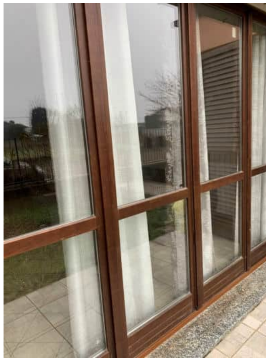
Serramenti perimetrali in legno con doppio vetro