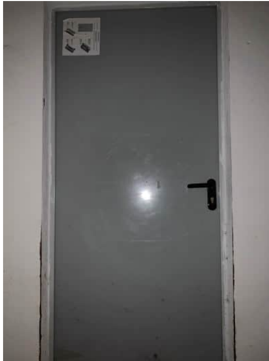
Disimpegno ripostigli con porta sul fondo a destra per accedere al box locali dotati di impianto ma privi di illuminazione elettrica