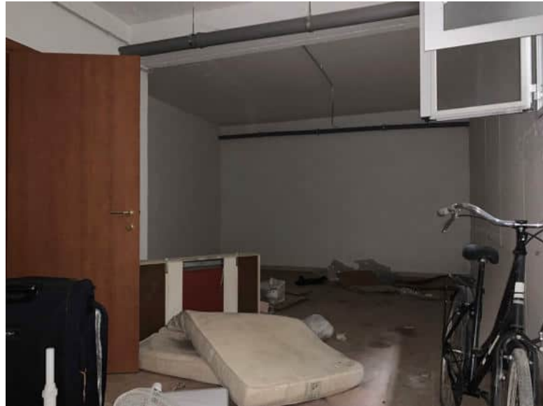
Disimpegno e locale cantina locali dotati di impianto ma privi di illuminazione elettrica