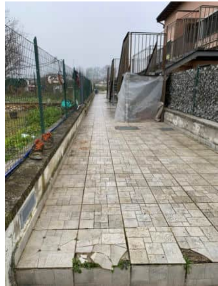
Giardino esclusivo sul retro e passaggio sul retro per accedere alle scale di accesso al piano primo