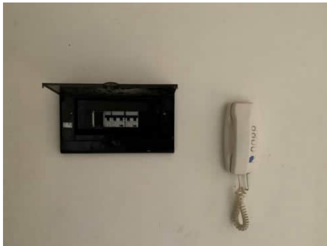
Quadro impianto elettrico e citofono