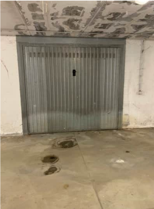
Basculante di accesso al box P. Int.