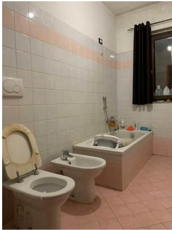
Antibagno con lavello e bagno