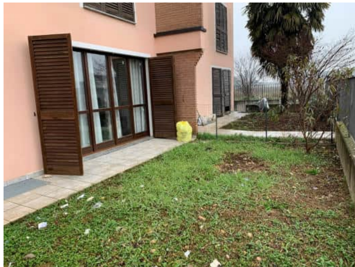
Accesso pedonale e giardino esclusivo su via Attilio Soresini