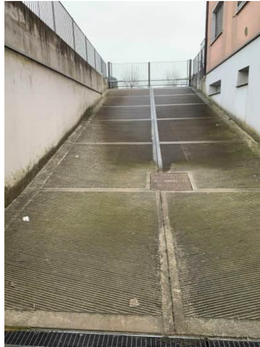
Rampa di accesso al P. Interrato