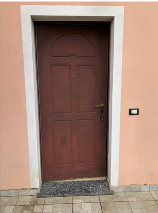
Portoncino blindato di accesso all'appartamento