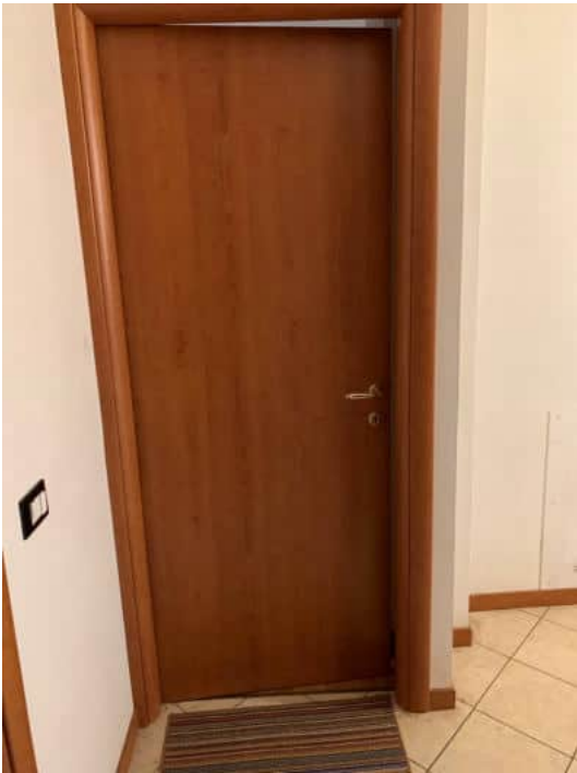
Serramenti interni in legno tamburato