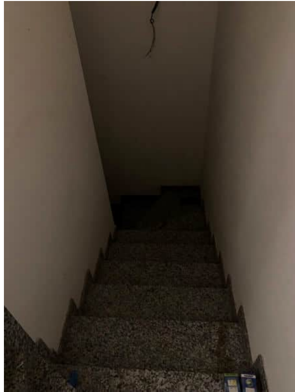
Scala di accesso al piano interrato priva di illuminazione