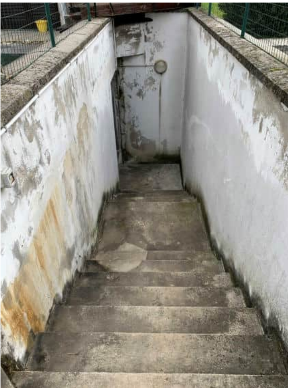
In fondo al passaggio sul retro scala di collegamento al piano interrato