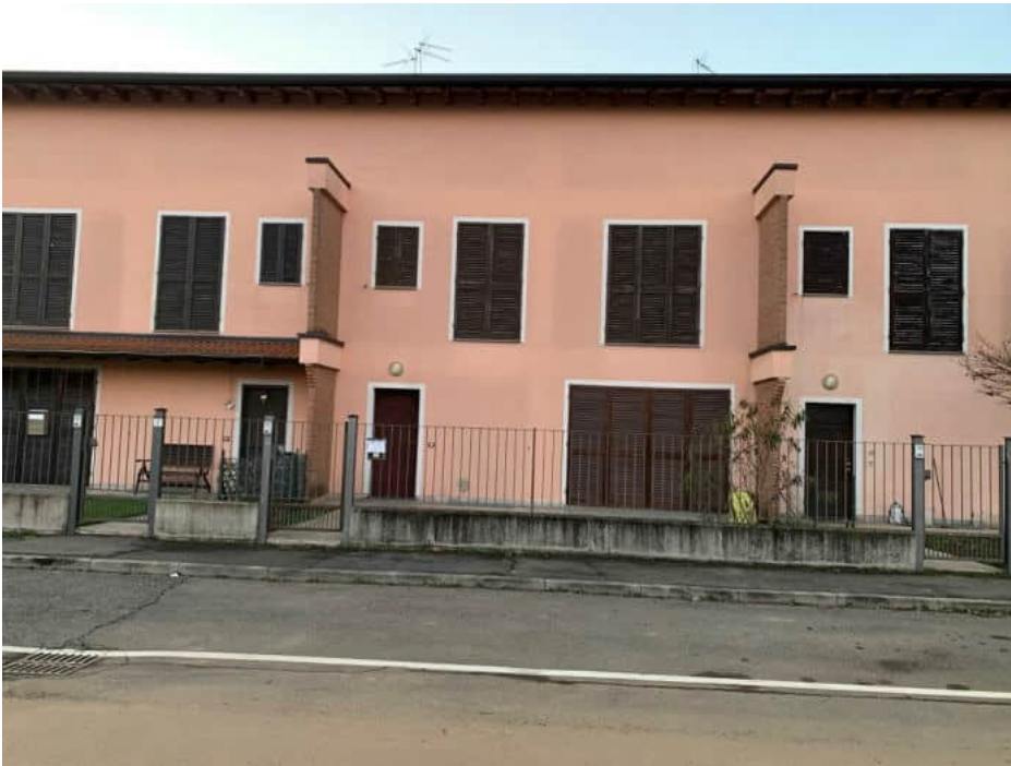
Fronte su via Attilio Soresini – appartamento centrale al piano terra