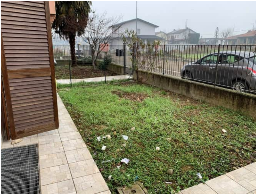
Giardino esclusivo su via Attilio Soresini