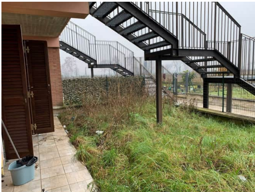
Giardino esclusivo sul retro