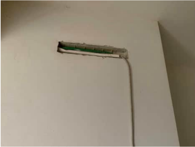
Predisposizione impianto di condizionamento