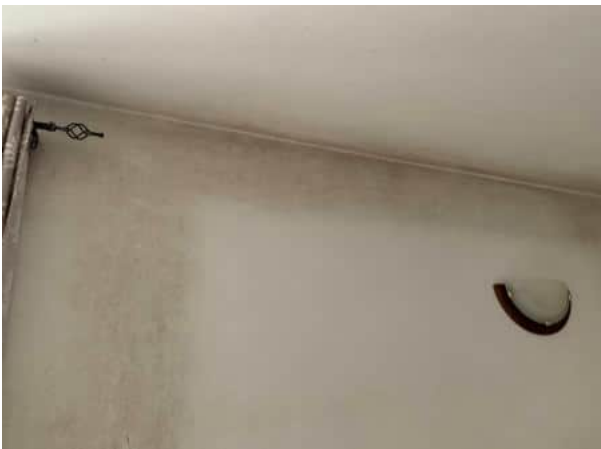
Segni di umidità (muffa) sulle pareti