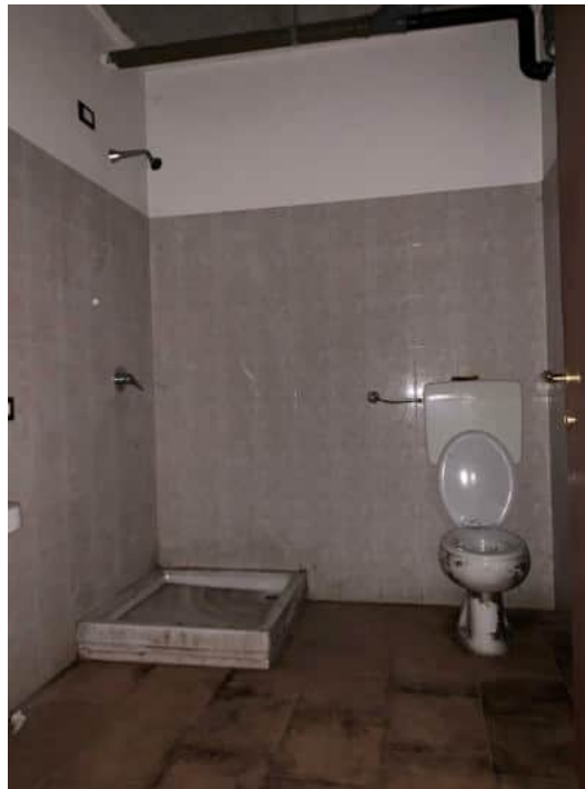
Ripostiglio e lavanderia al P. Int. locali dotati di impianto ma privi di illuminazione elettrica