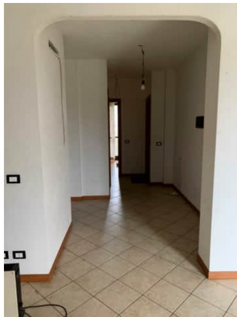
Disimpegno scala visto dal soggiorno