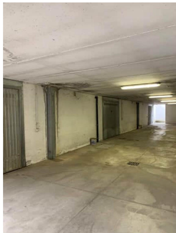
Corsello al piano interrato