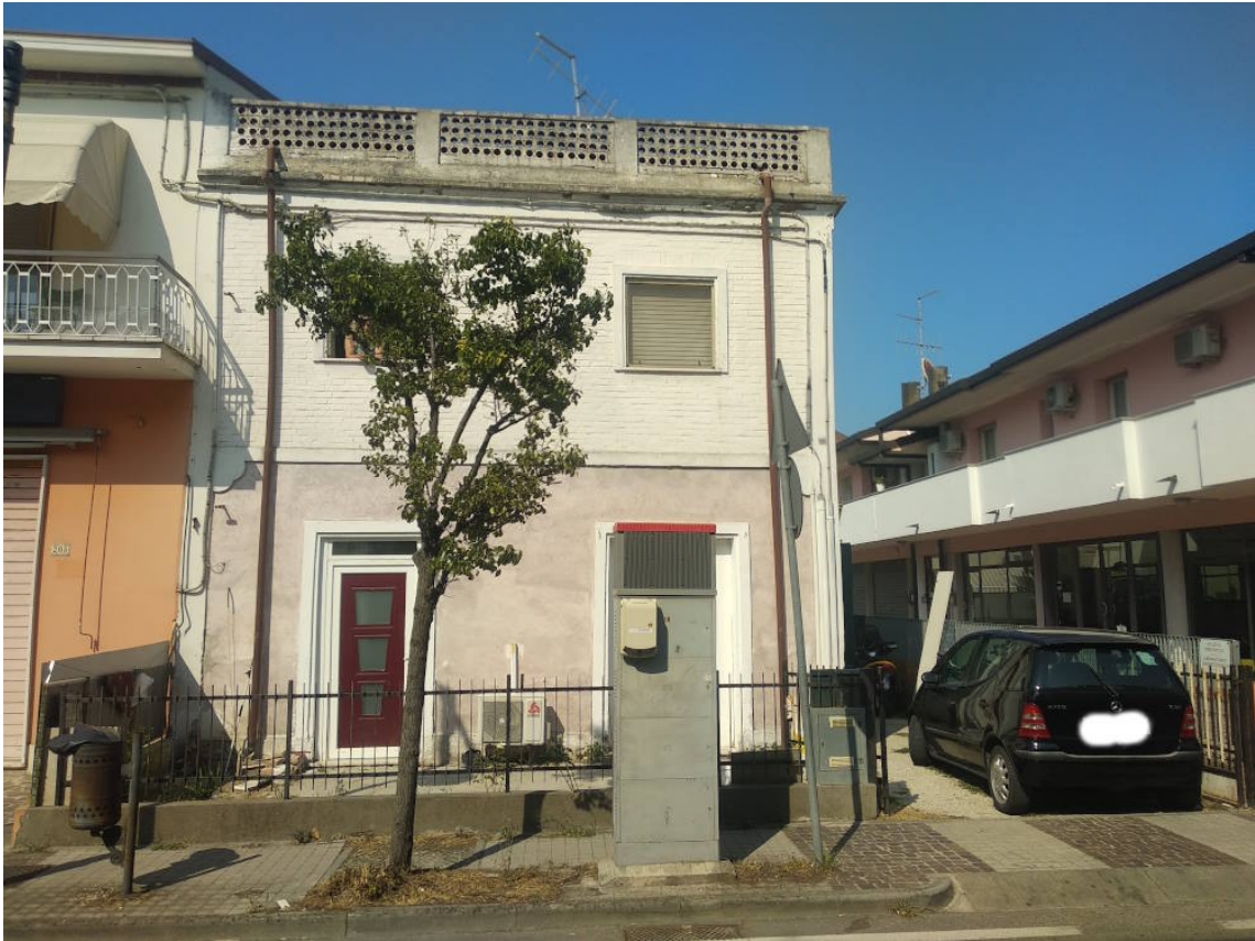
FOTO 02 - esterno