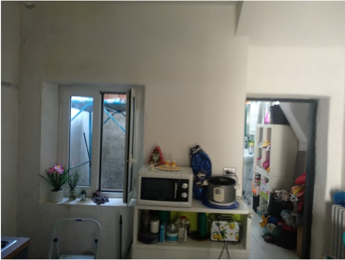
FOTO 10 - interno- appartamento piano terra