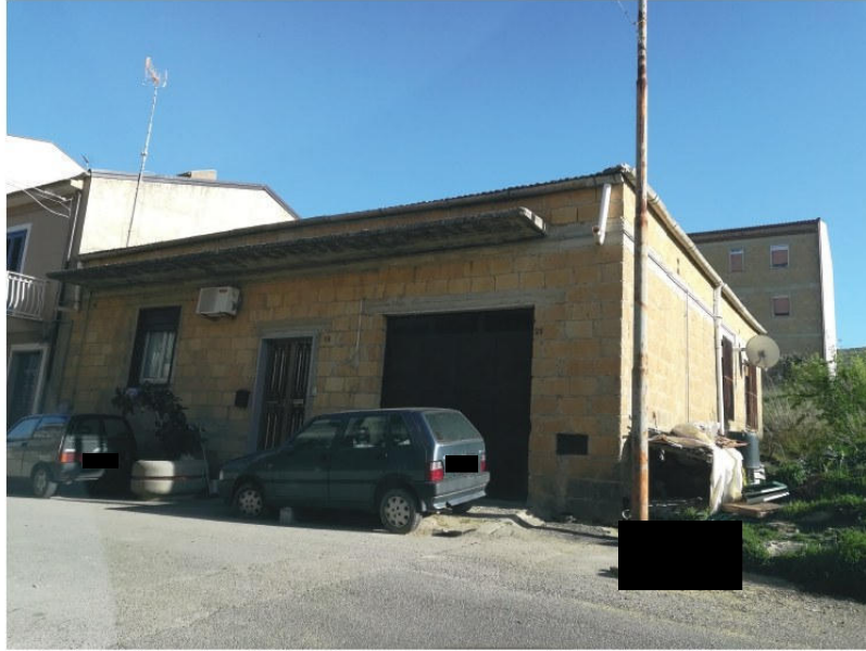
Figura 1. Prospetto principale su via E. Montale