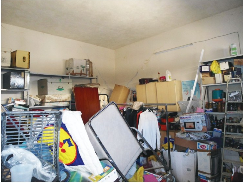
Figura 9. Autorimessa