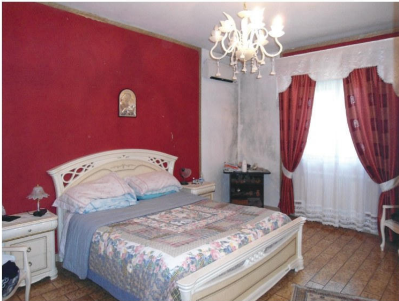
Figura 4. Camera da letto