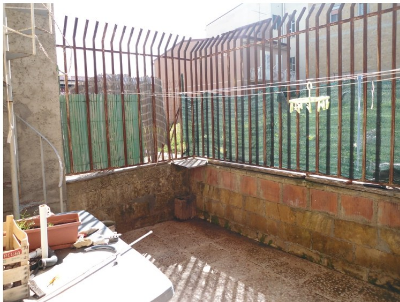
Figura 8. Area verde