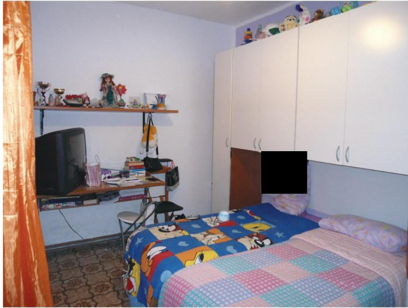
Figura 5. Cameretta