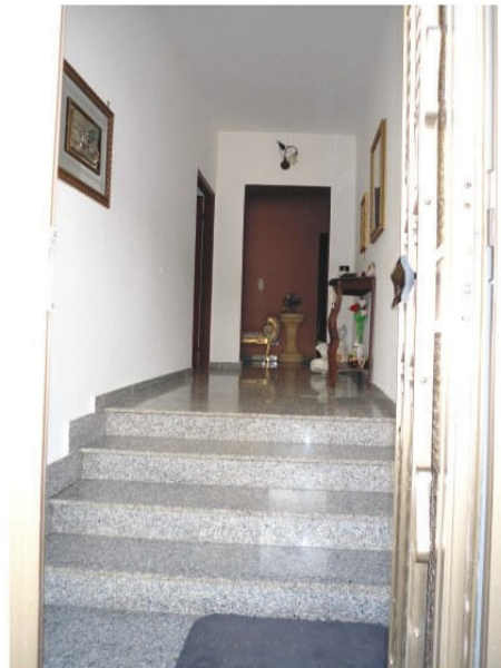
Figura 2. Ingresso