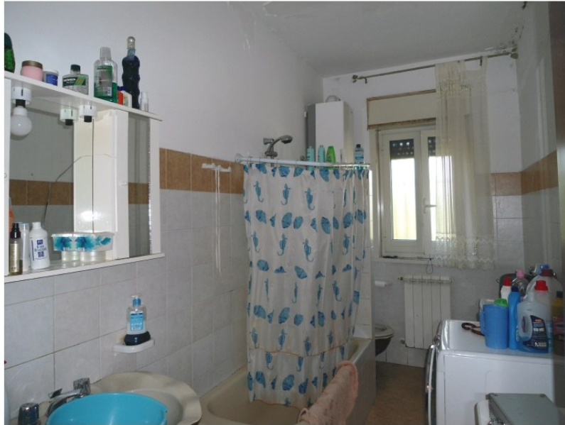
Figura 7. Servizio igienico