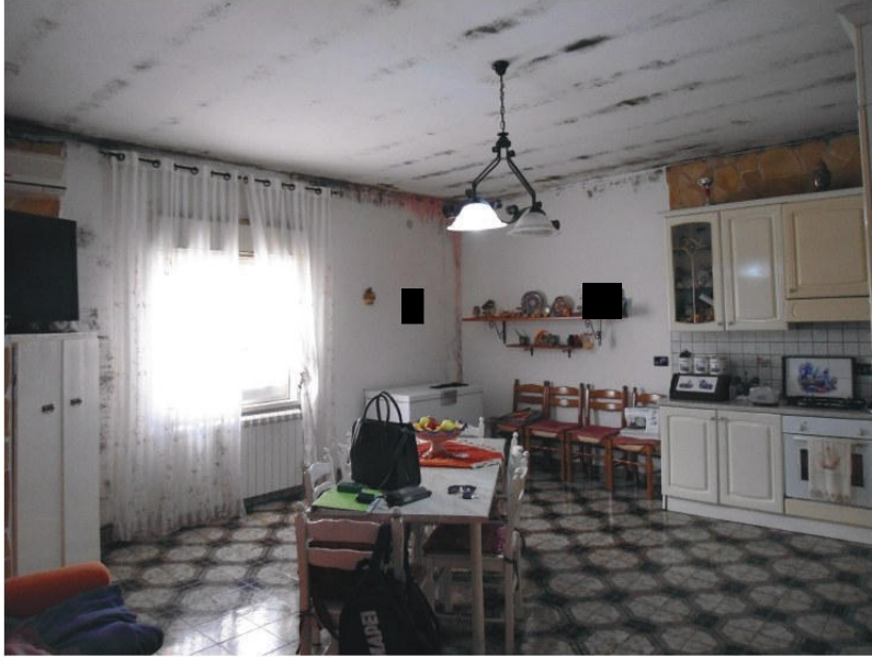
Figura 3. Cucina