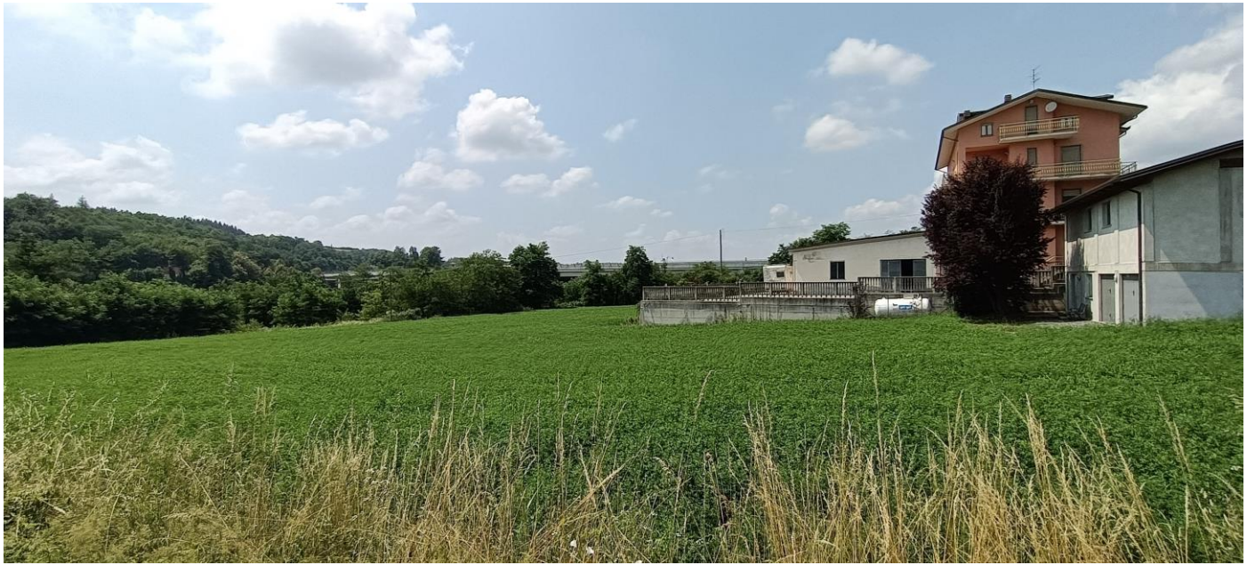
BASSO FABBRICATO ABUSIVO