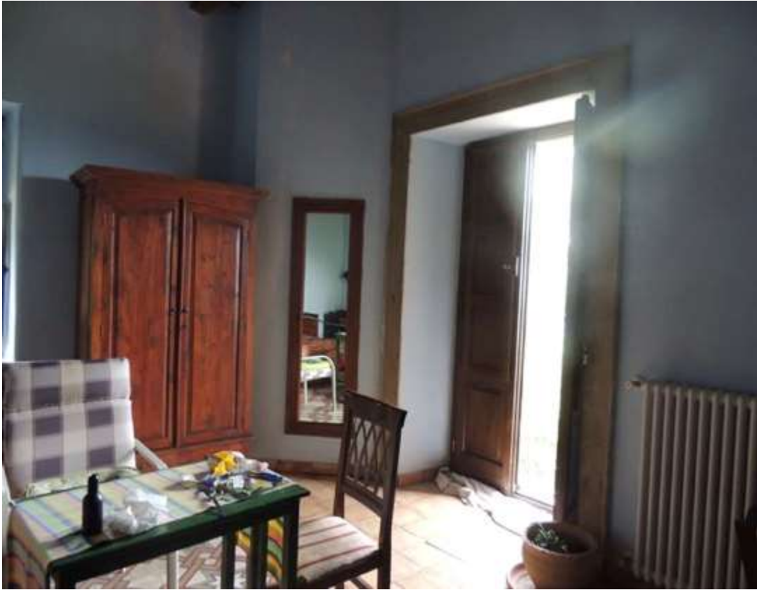
Camera da letto principale