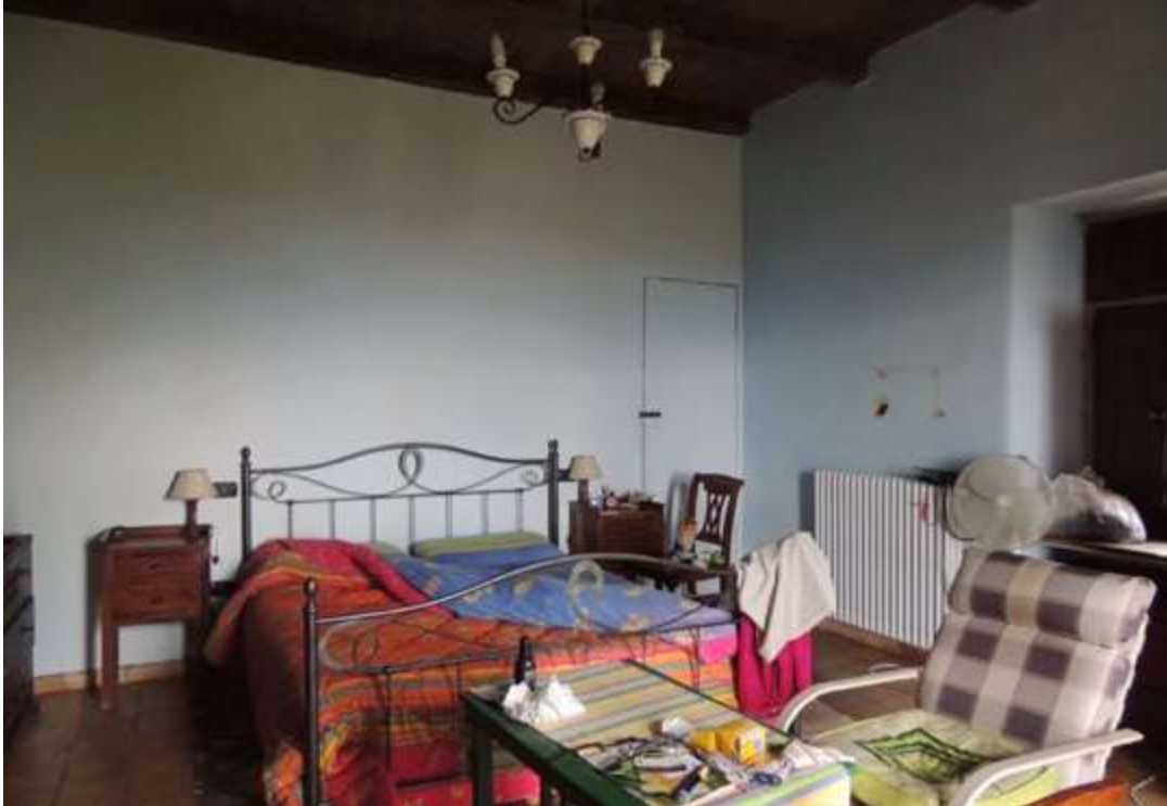
Camera da letto principale