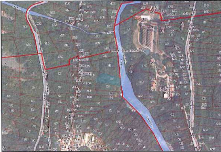
Ortofoto con sovrapposizione mappa catastale