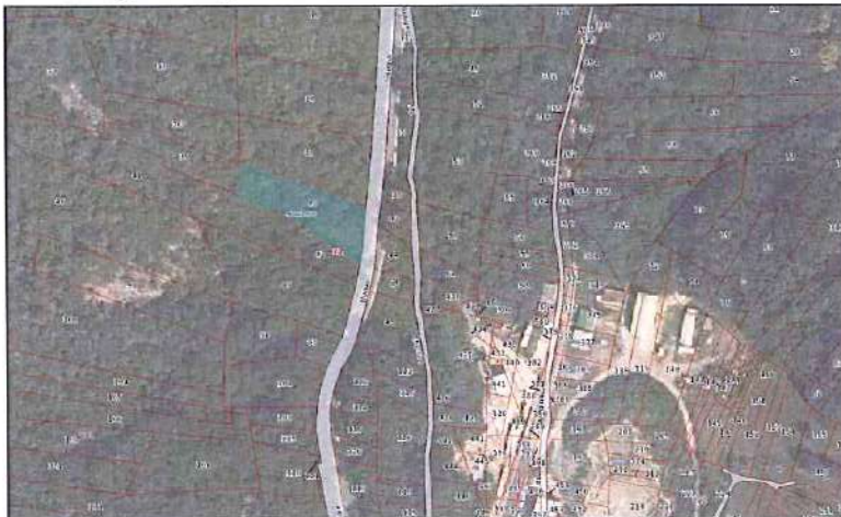
Ortofoto con sovrapposizione mappa catastale