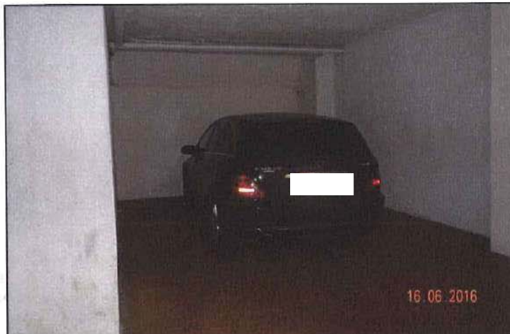
Vista posto auto

Nuovo Catasto dei Fabbricati: foglio 41 - particella 117 sub. 60-61