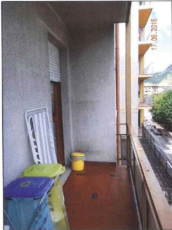
Vista terrazzo a nord

Nuovo Catasto dei Fabbricati: foglio 41 - particella 117 sub. 60-61