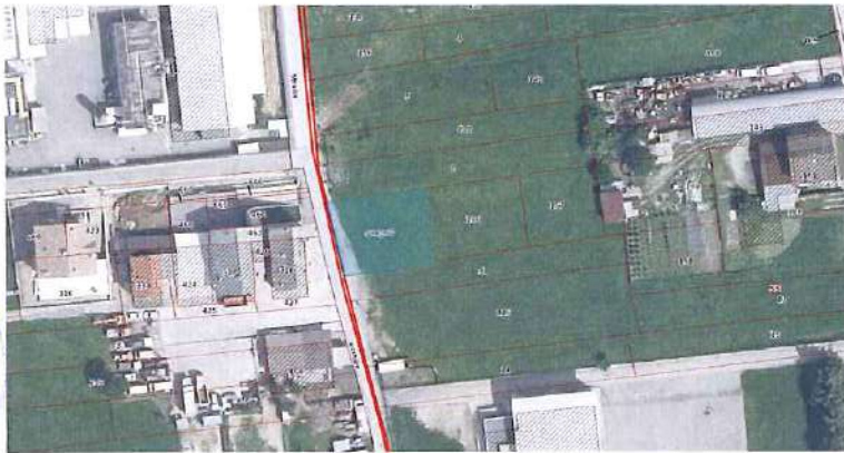
Ortofoto con sovrapposizione mapa catastale