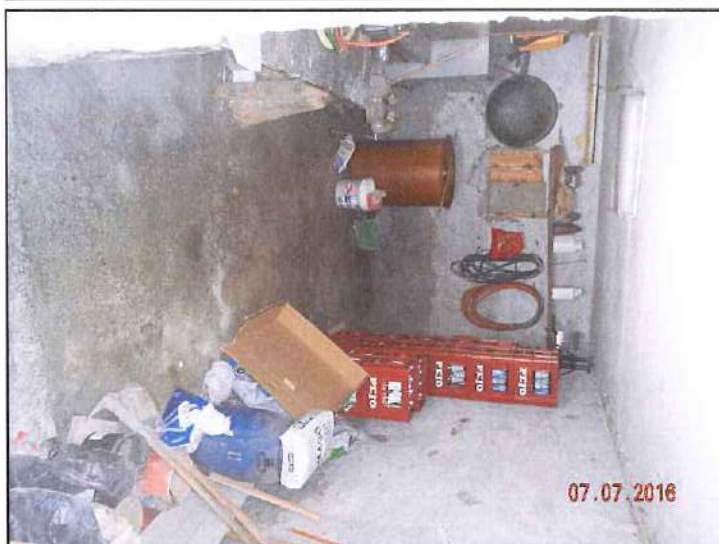
vista interna piano terra