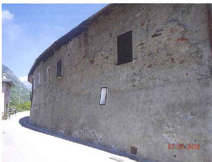
vista dalla strada comunale