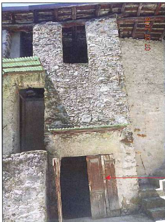
vista dalla corte interna