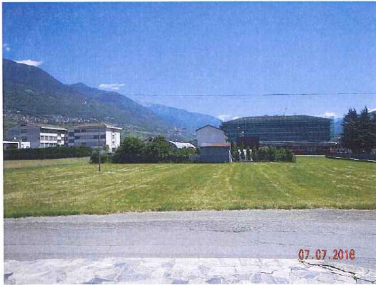
vista da ovest verso est