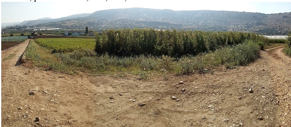
Foto 18 - Lotto 2 – Impianto barbatelle piante madri e seminativo Foglio 33 Comiso, particella 78

Tribunale di Ragusa Causa Esecuzione immobiliare iscritta al n.67/2017 R.G.Es. Allegati planimetrici e fotografici alla relazione del PE – Lotto 2 G. E. Dott. Gilberto Orazio Rapisarda