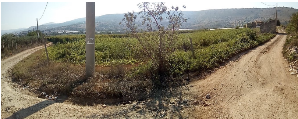
Foto 17 - Lotto 2 – Impianto barbatelle piante madri e seminativo Foglio 33 Comiso, particelle 135, 176, 175, 191