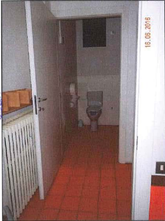
Vista interna w.c. disabili