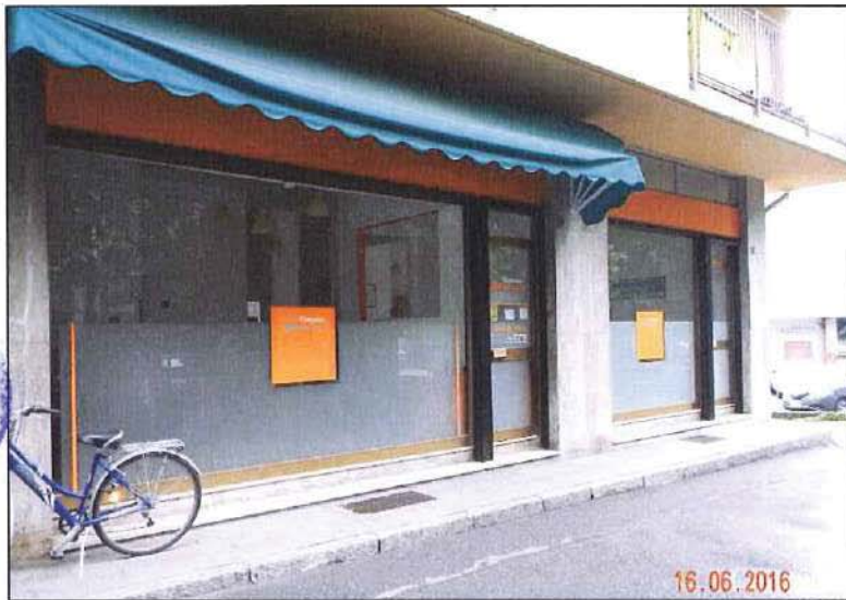
Vista ingresso dall'esterno del sub 15