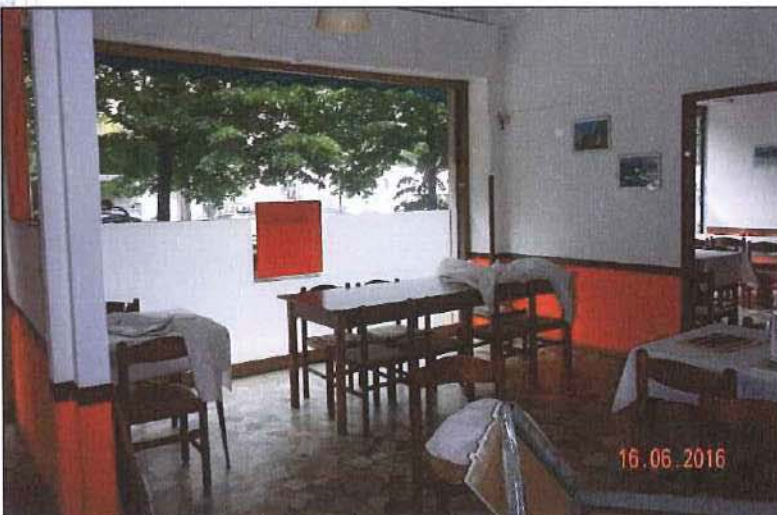
Vista interna sala