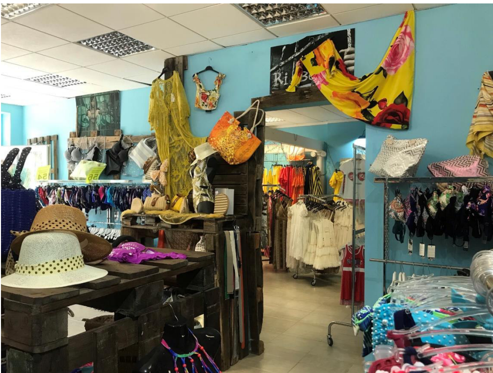
(PORTA DI PASSAGGIO fra sub. 118 e sub.271)