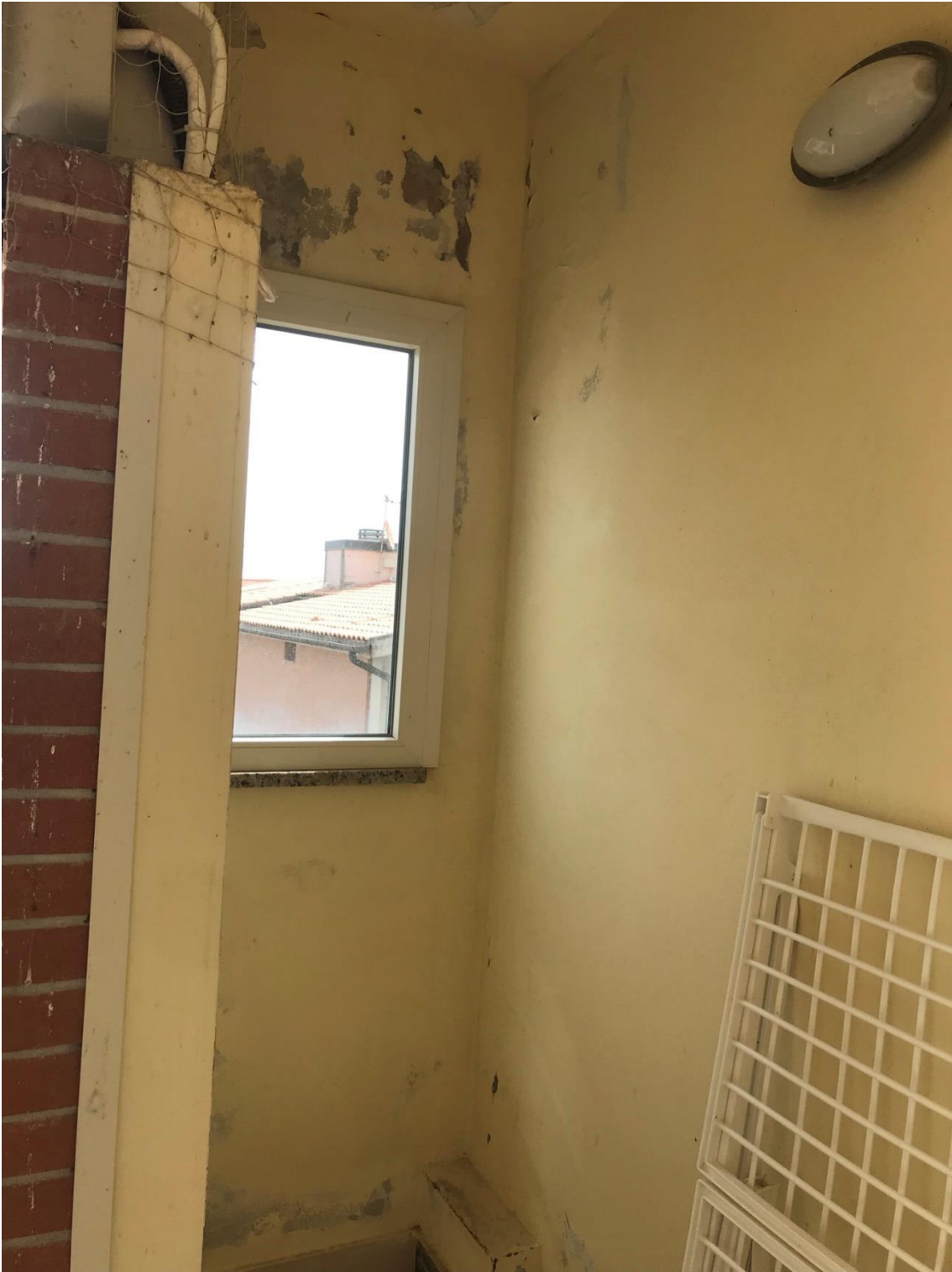
(NICCHIA TERRAZZO CON VANO CALDAIA)