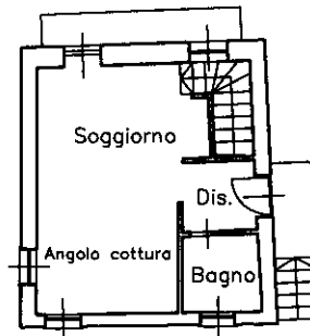
PIANO PRIMO Hm=3.37