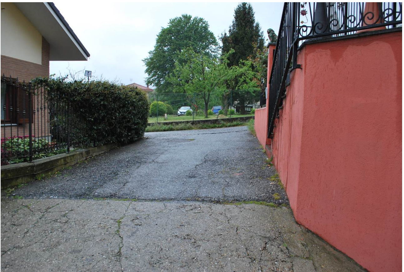
Immagine oggetto di esecuzione: Coazze, via Dovia 12/3. Strada accesso al piano interrato.