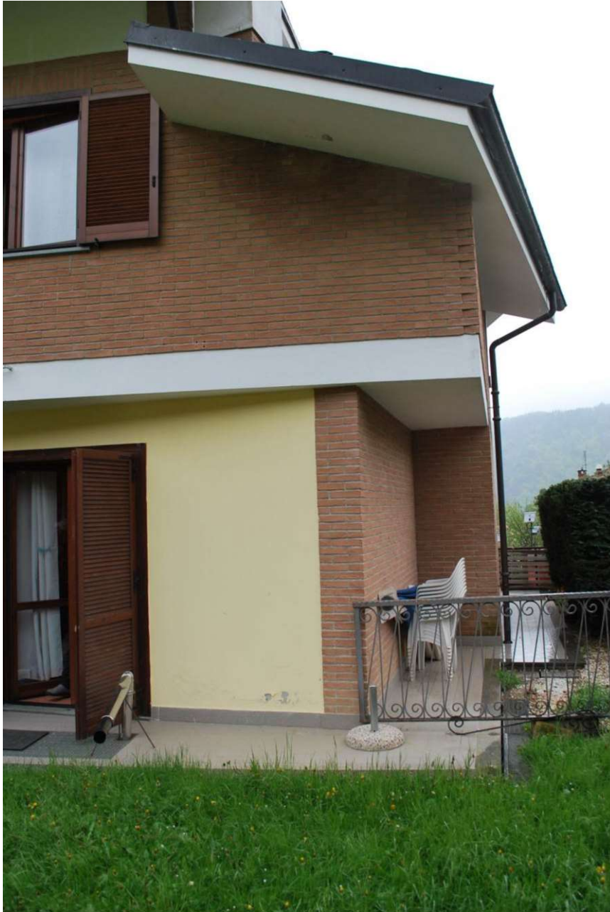
Immobile oggetto di esecuzione: Coazze, via Dovis 12/3. Vista retrostante.