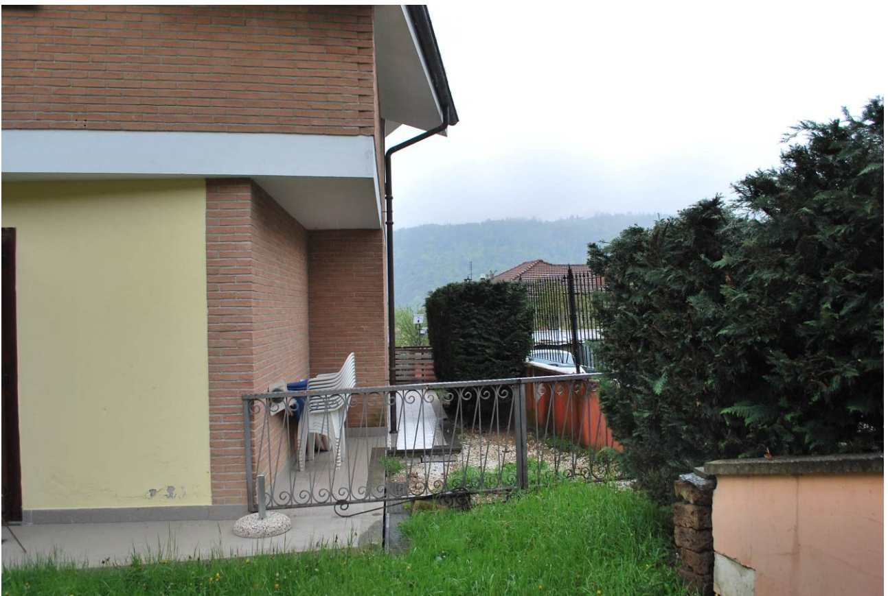
Immobile oggetto di esecuzione: Coazze, via Dosis 12/3. Vista retrostante.