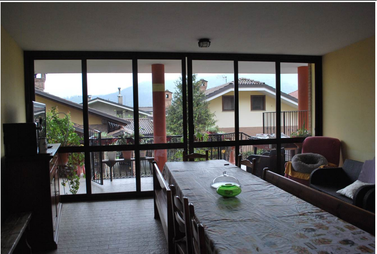
Immobile oggetto di esecuzione: Coazze, via Dovia 12/3. Chiusura portico accesso.