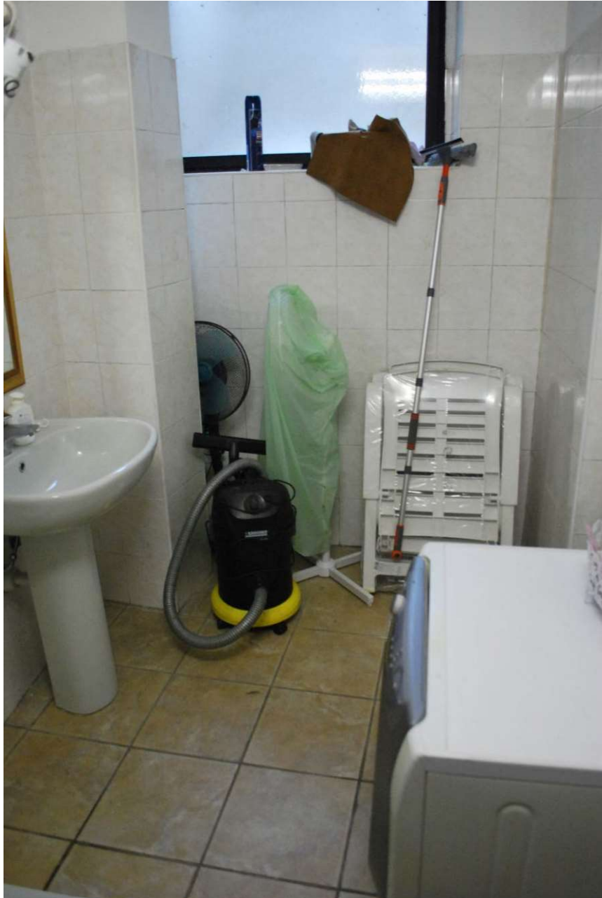
Immagine oggetto di esecuzione: Coazze, via Dovis 12/3. W.c al piano interrato (catastalmente cantina).