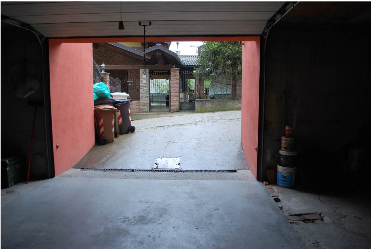
Immagine oggetto di esecuzione: Coazze, via Dovia 12/3. Area di manovra.