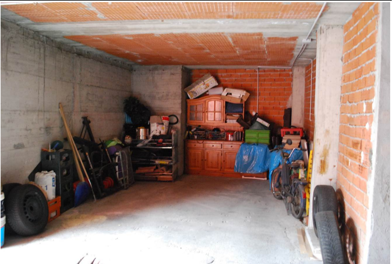
Immobile oggetto di esecuzione: Coazze, via Dovis 12/3. Box auto di dimensioni ridotte.