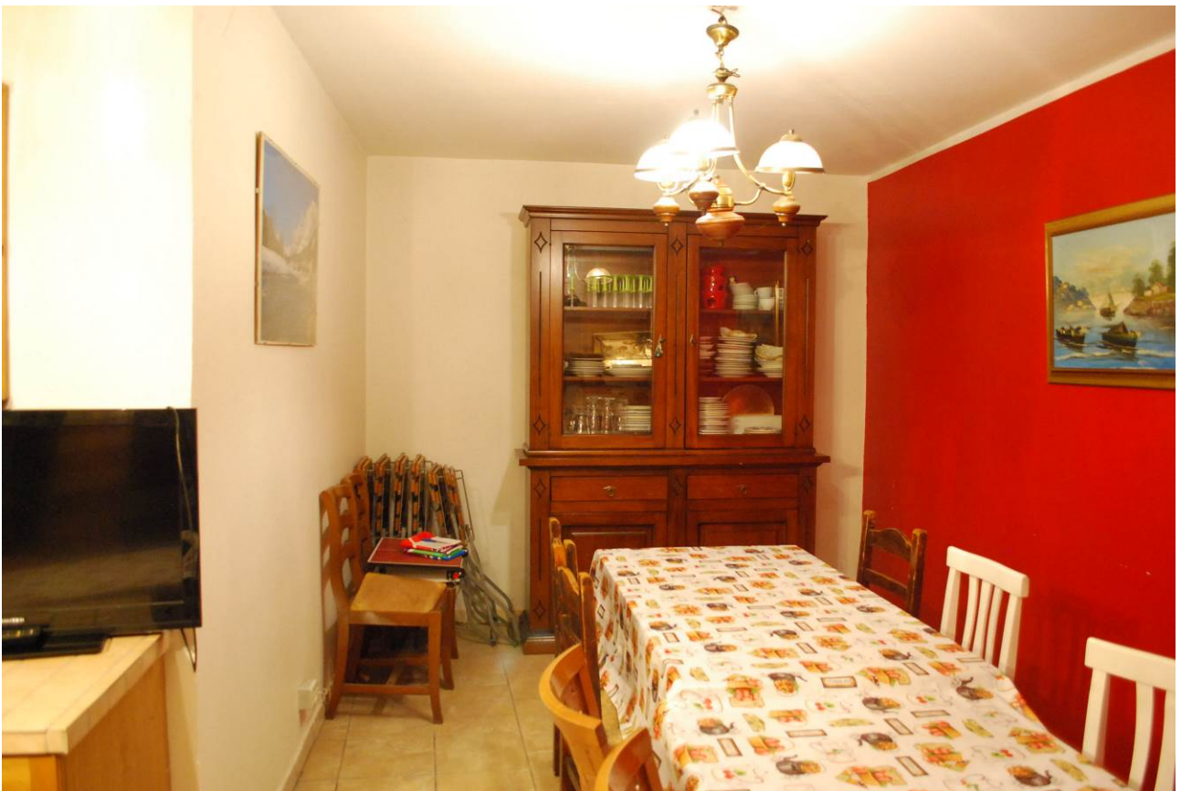
Immobile oggetto di esecuzione: Coazze, via Dovis 12/3. Parte del box ora a tavernetta.