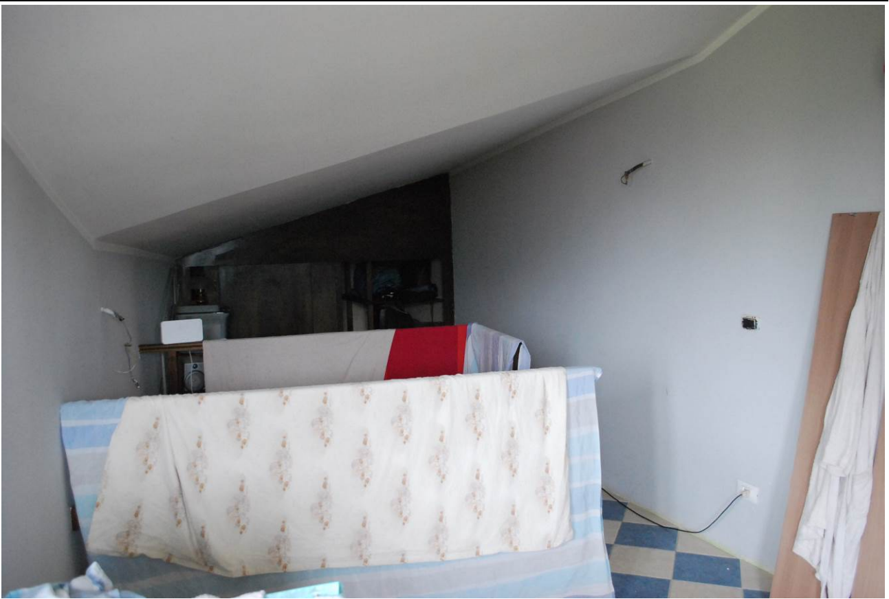
Immobile oggetto di esecuzione: Coazze, via Dovia 12/3. Sottotetto non abitabile.