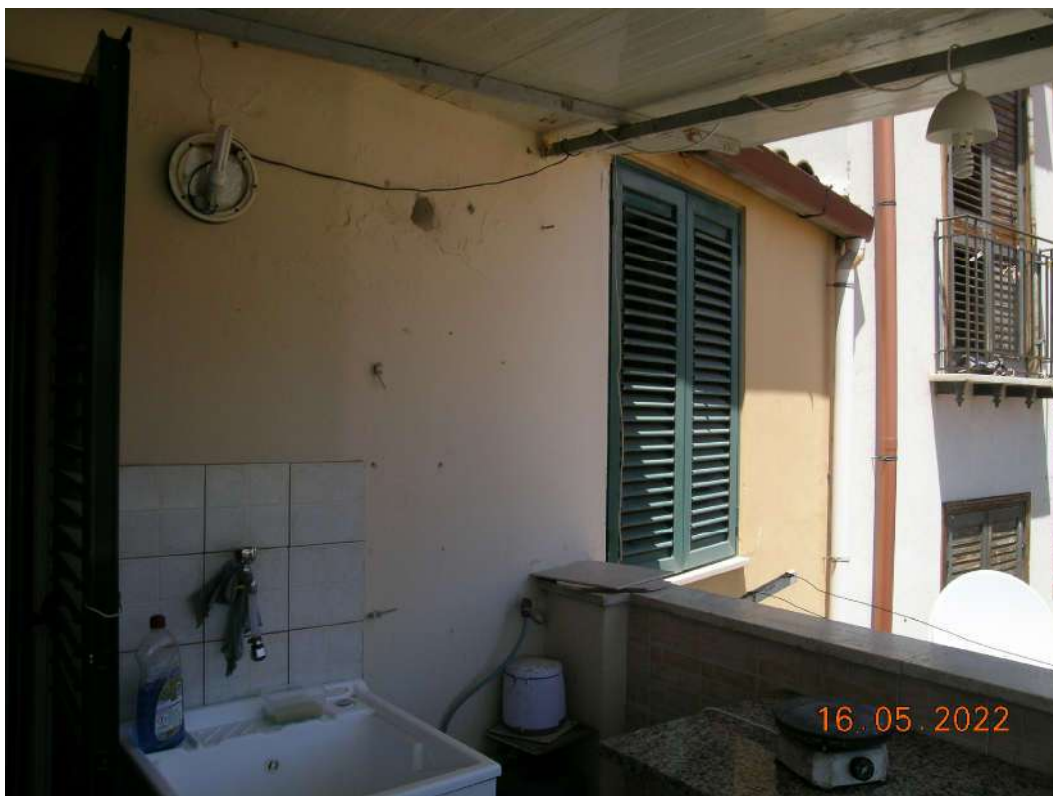
Terrazza piano 2°