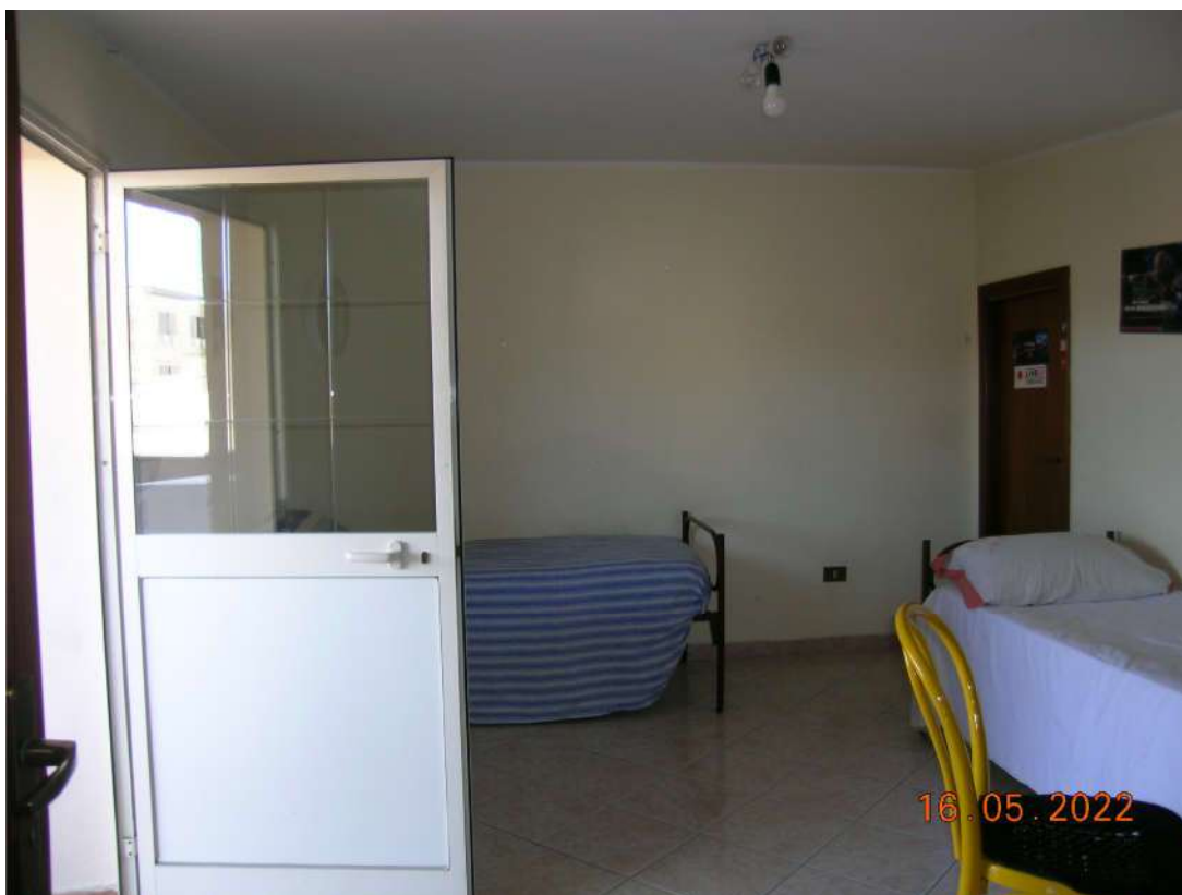
Camera con terrazza al piano 3°