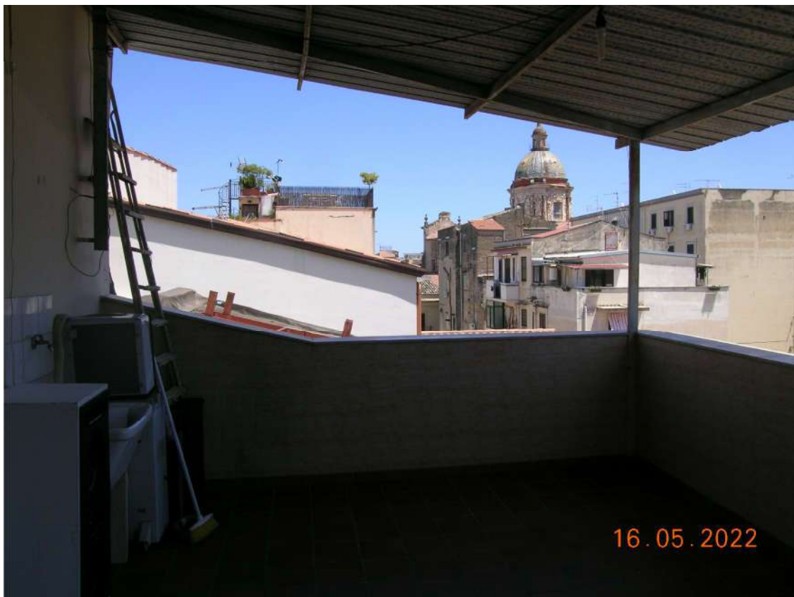
Terrazza piano 3°