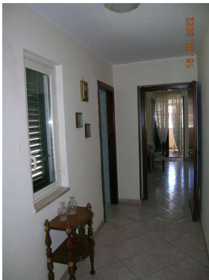
Interni piano 2°