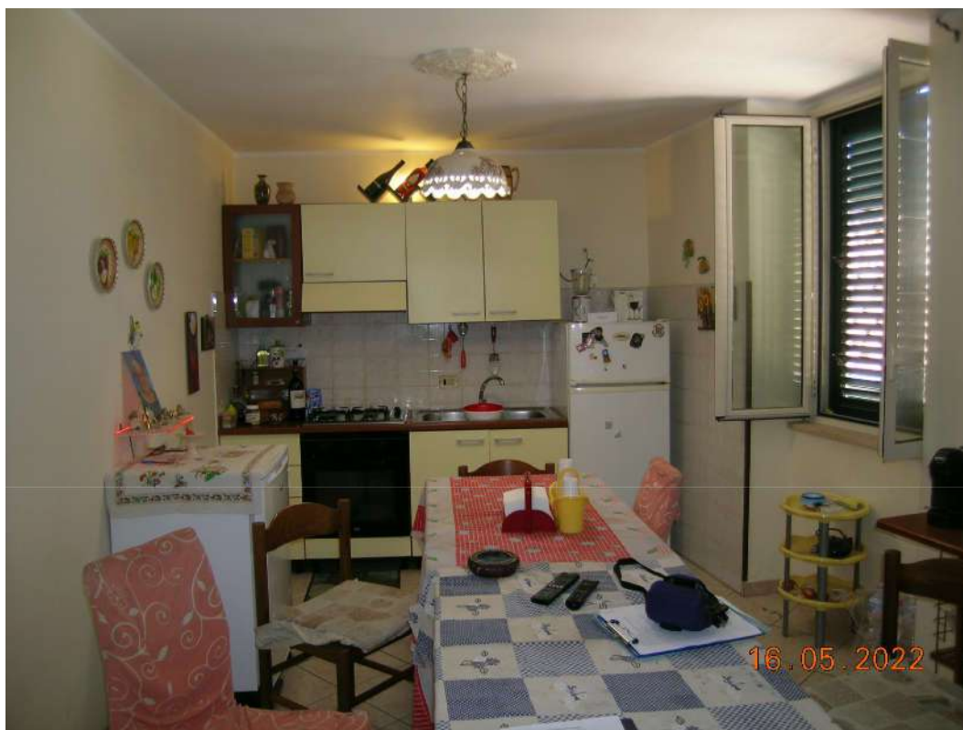
Vano cucina piano 2°