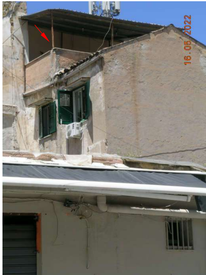
Terrazza piano 3° vista da via G. Verga