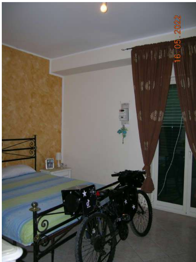
Camera prospiciente via Albergheria