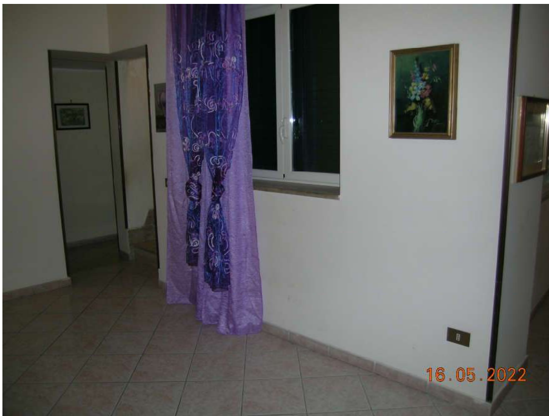
Interni piano 2°