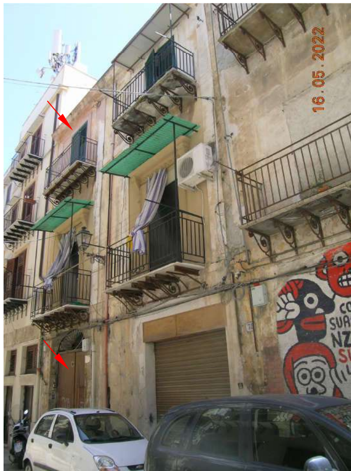
Prospetto su via Albergheria