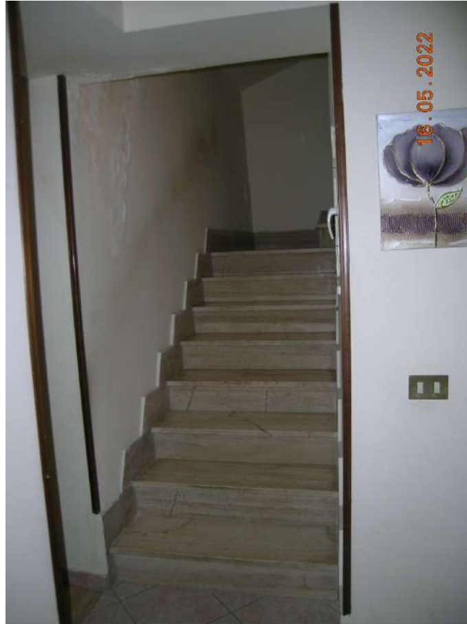
Scala interna che conduce al piano 3°