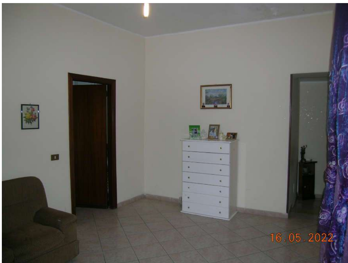
Interni piano 2°