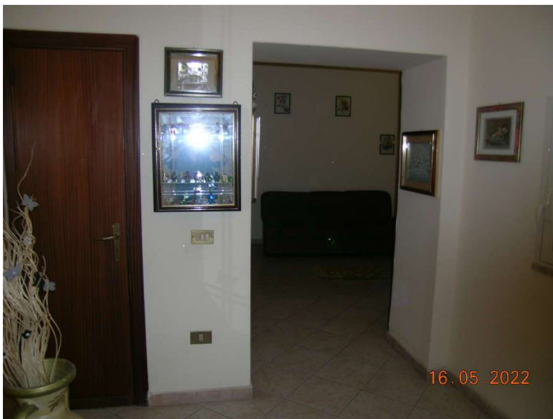
Interni piano 2°