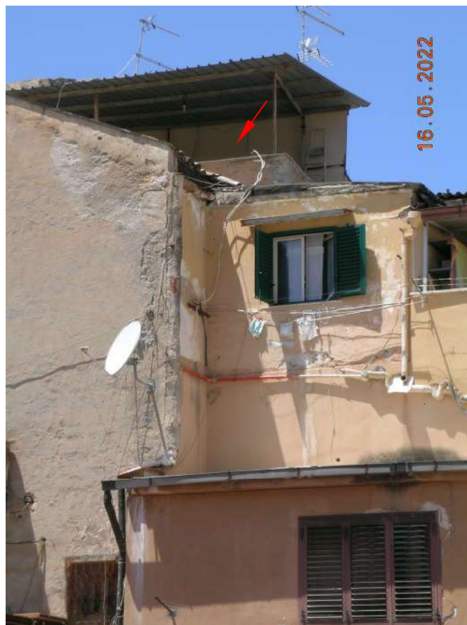
Terrazza piano 3° vista da via G. Verga