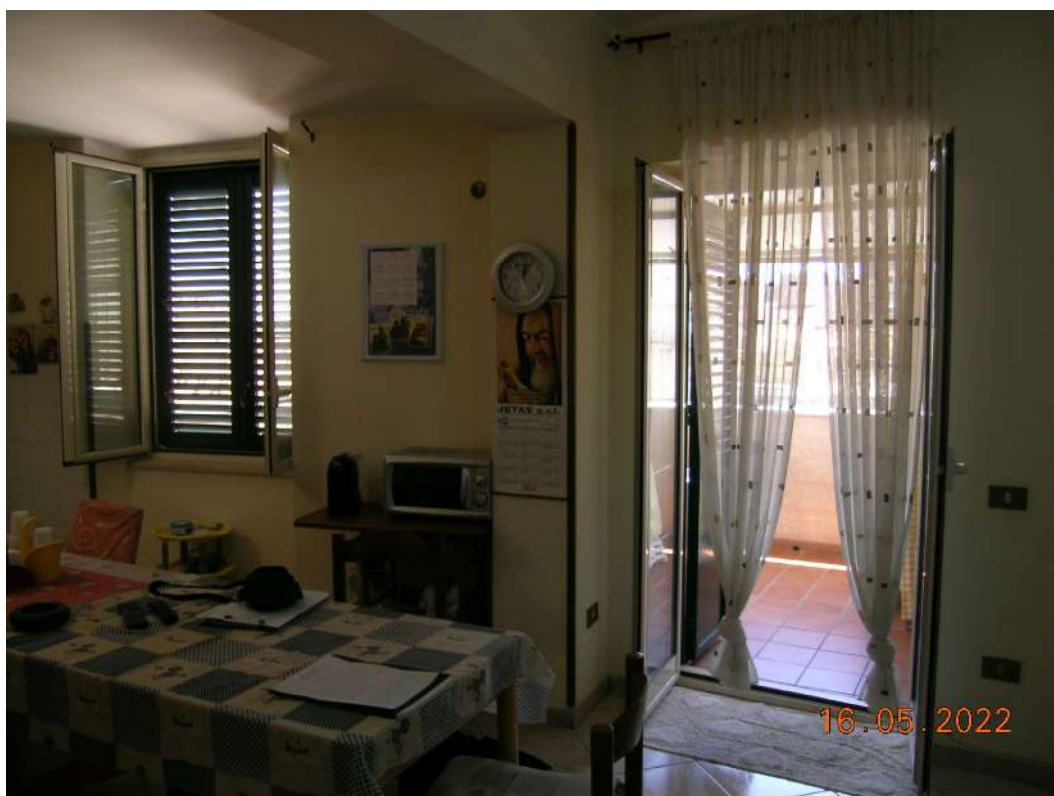
Vano cucina e terrazza piano 2°