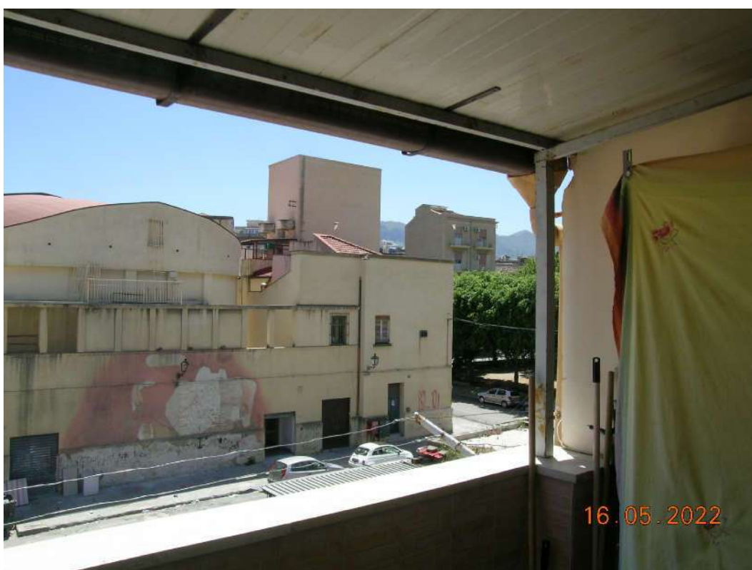
Terrazza piano 2°