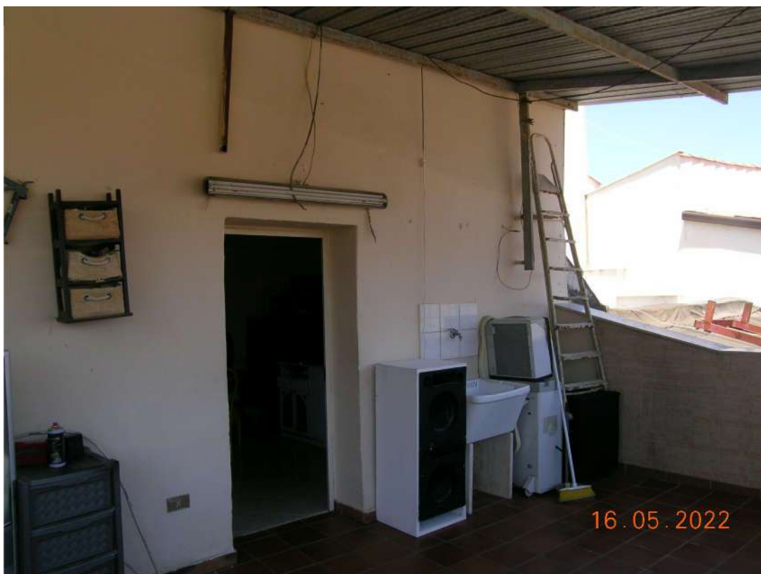
Terrazza piano 3°