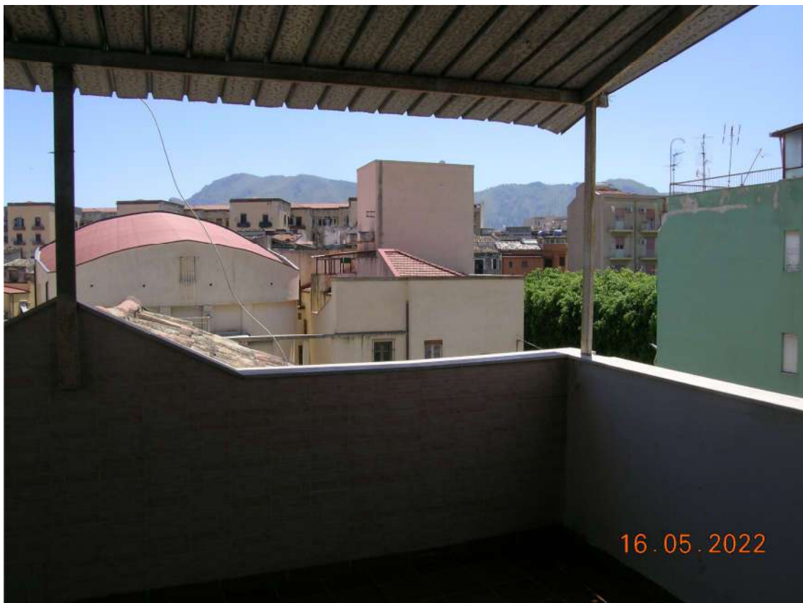
Terrazza piano 3°