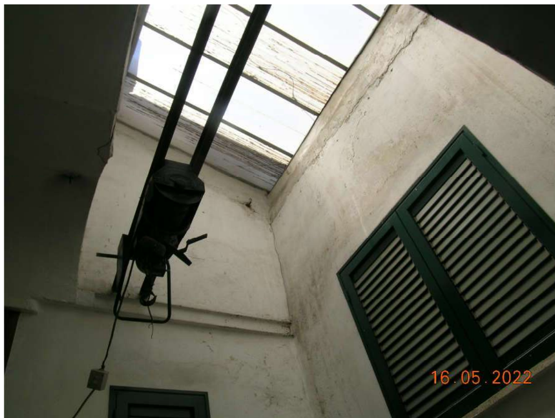
Chiostrina coperta del vano scala