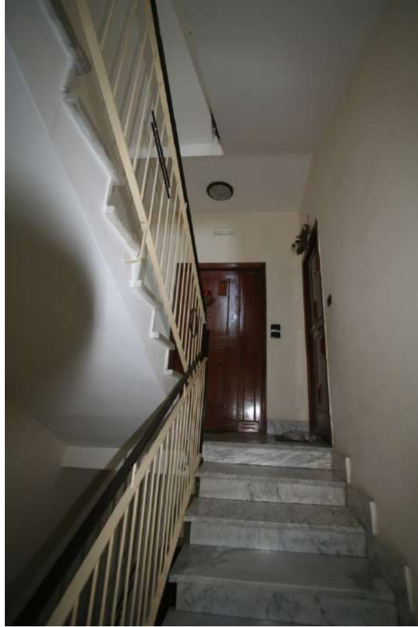
Foto 3 – Scale con al fondo l'accesso al disimpegno comune ai due lotti