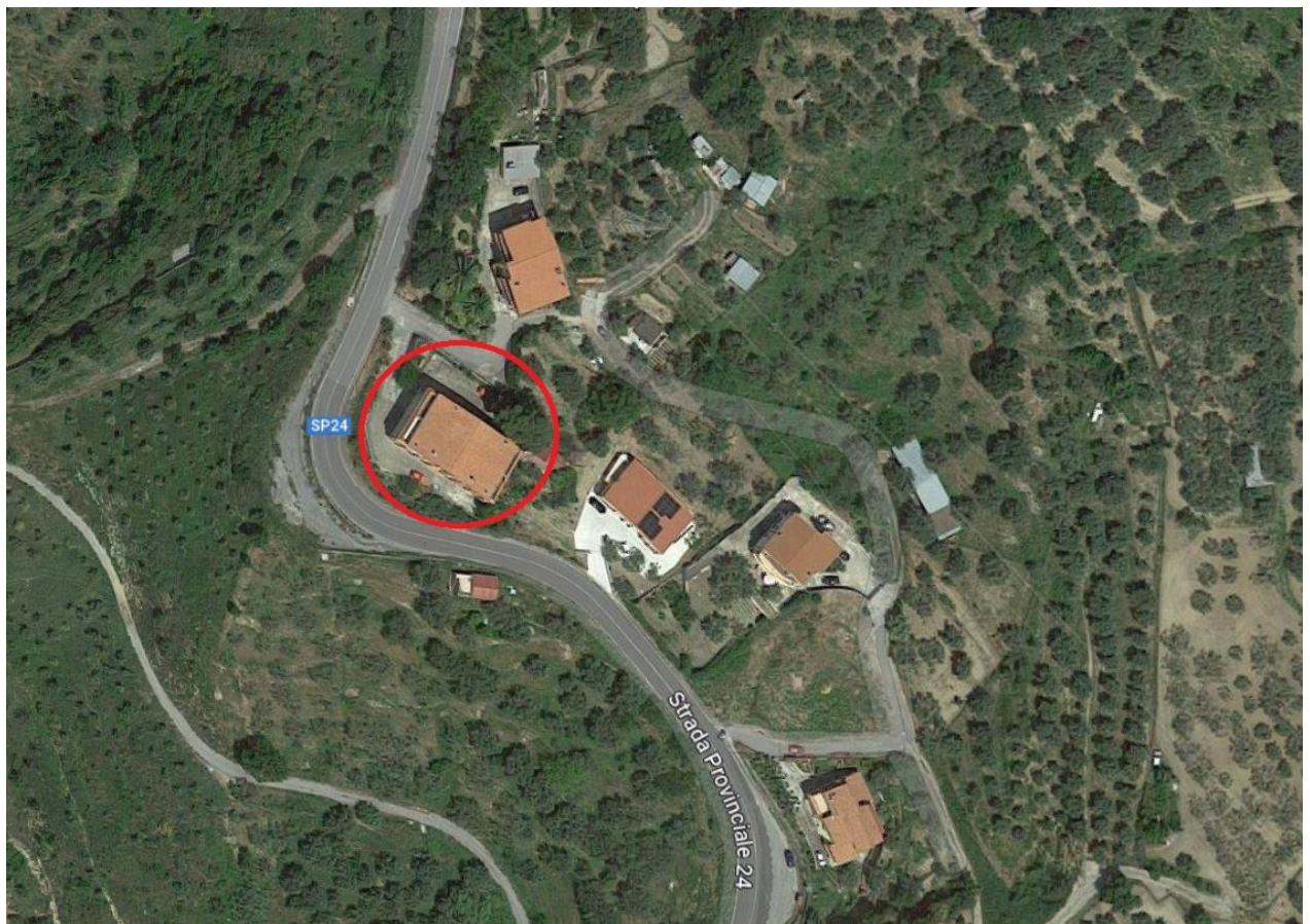
Foto 2 – Localizzazione su aerofotografia del fabbricato condominiale in cui sono ubicati quattro degli immobili pignorati