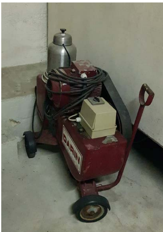
7A Pompa a pistoni Darin matr. MH112C-2/4 50. Produzione 1980-1989 circa.