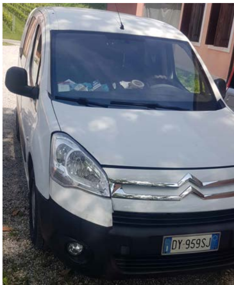
79 Citroen Berlingo autocarro colore bianco. Anno 1 a immatricolazione 2005. Scadenza revisione: 05.2024