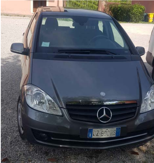
1A - Mercedes Benz Mod. A 160 CDI colore grigio scuro metallizzato. Anno 1 a immatricolazione 2010. Scadenza revisione: 01.2023