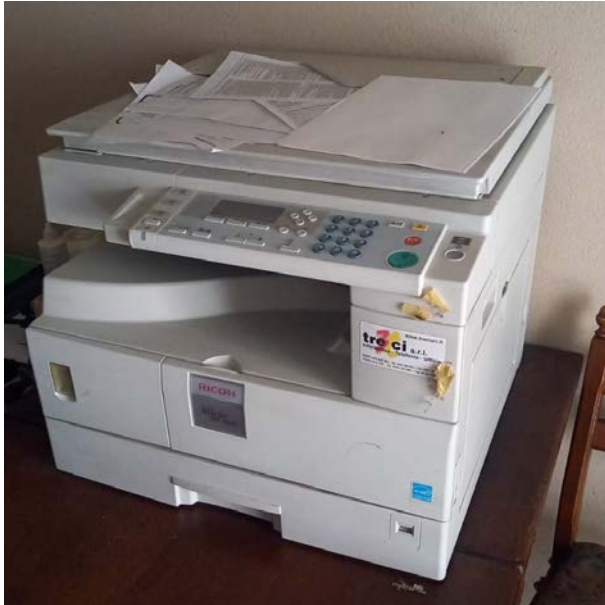
14 Stampante multifunzione Ricoh