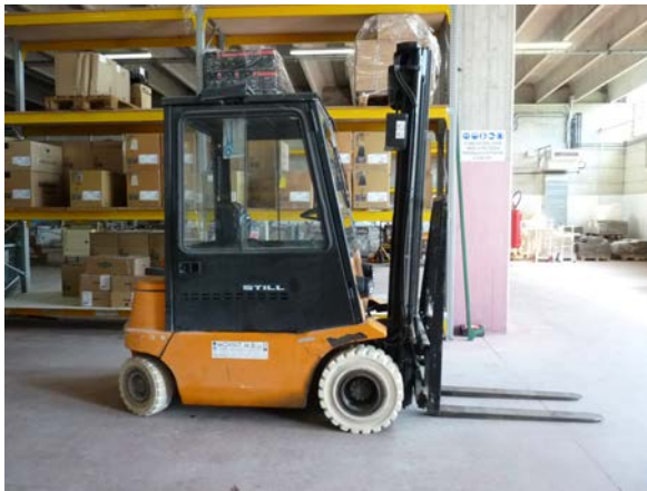
55 Muletto Still a batteria 80 volt con pneumatici antitraccia