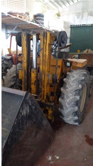
43 Carrello elevatore International 25 20C