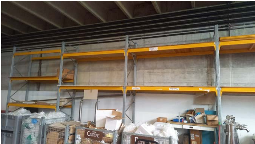
77 n. 10 scaffalature da capannone