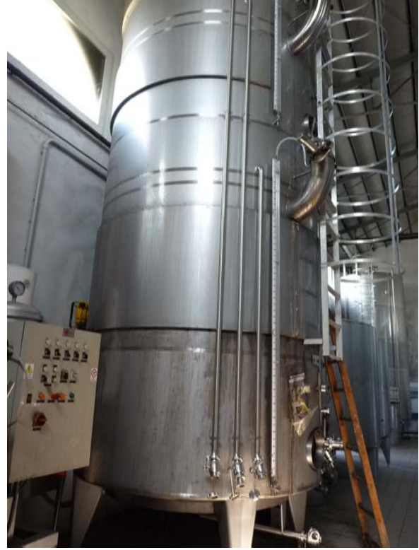
36A e 36B Vasche in acciaio inox refrigerate da 50 hl