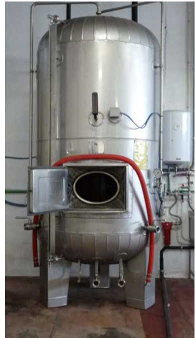
66 B-C-D autoclavi per spumantizzazione capacità 25 hl, le prime due in ferro smaltato