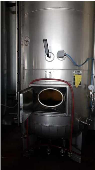
65 C-D autoclavi per spumantizzazione capacità 50 hl