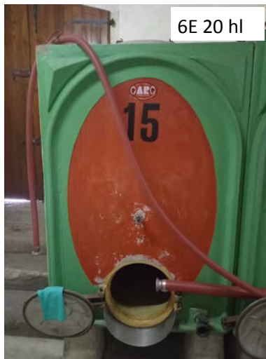
6A-B-C-D-E. Vasche in cemento vetrificato. Non in uso. Capacità 25 hl, l'ultima ha capacità 20 hl ("15" nella foto)