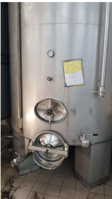
35B Vasca in acciaio inox refrigerata da 100 hl