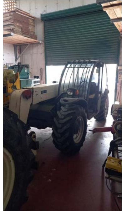
44 carrello elevatore telescopico Terexlift Gladiator 3007, 1 ^ immatricolazione 2009