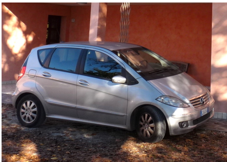
80 Mercedes Benz Mod. A 180 CDI 2.0 colore grigio chiaro metallizzato Anno 1 a immatricolazione 2006. Scadenza revisione: 06.2023