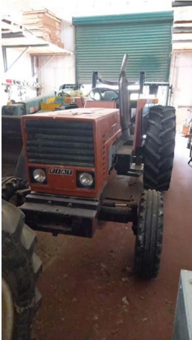
42 Trattore Fiat 670 con rollbar targa TV44681 1 ^ immatricolazione 1982