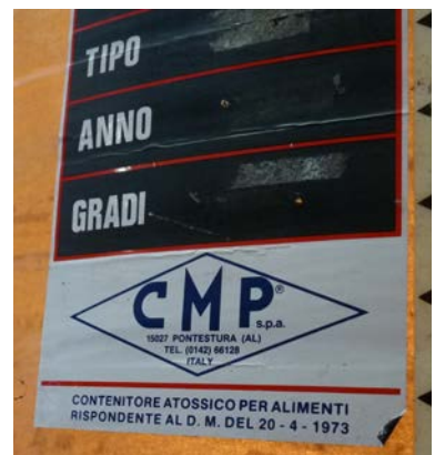
4 A-B-C-D-E : vasche in vetroresina per alimenti con sistema troppopieno, capacità 45 hl le prime quattro, capacità 30 hl l'ultima ("39" nella foto).