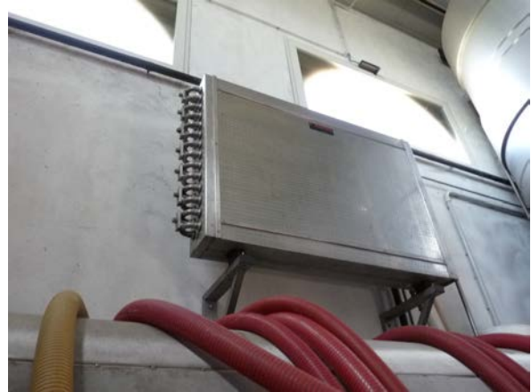
40 Scambiatore acqua-vino Ditta Rossetto