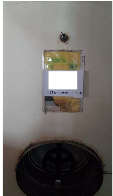
66A autoclave in ferro smaltato capacità 25 hl