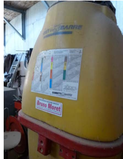
50 Botte per diserbo Modello Gambetti