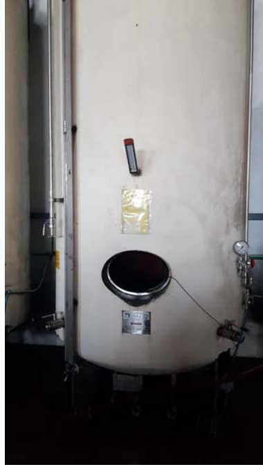
65 A-B autoclavi per spumantizzazione in ferro smaltato capacità 50 hl