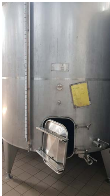
35C e 35D Vasche in acciaio inox refrigerate da 100 hl della Ditta Cadalpe, a fondo piano leggermente inclinato verso il boccaporto a raso. Utilizzabili per vinificazione in rosso con estrazione manuale