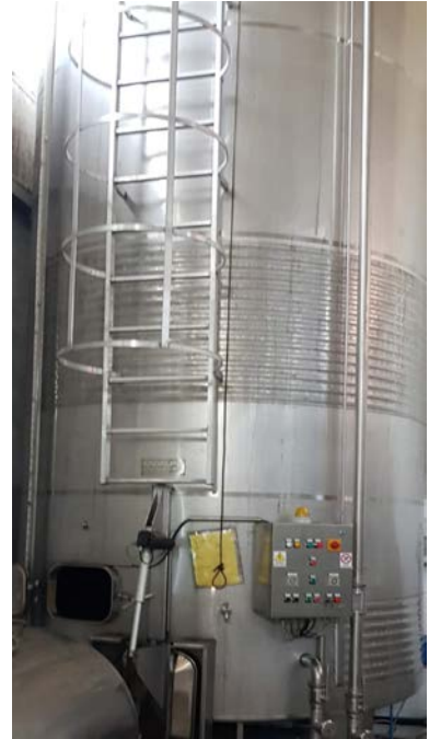
32 A-B-C: Vasche in acciaio inox refrigerate. Sistema cooling a biscotto con glycole. Capacità 250 hl ciascuna. La 32C ha tasche di raffreddamento (non coibentate), fondo conico con estrazione a pale automatica e irroratore per i rimontaggi, per vinificazione