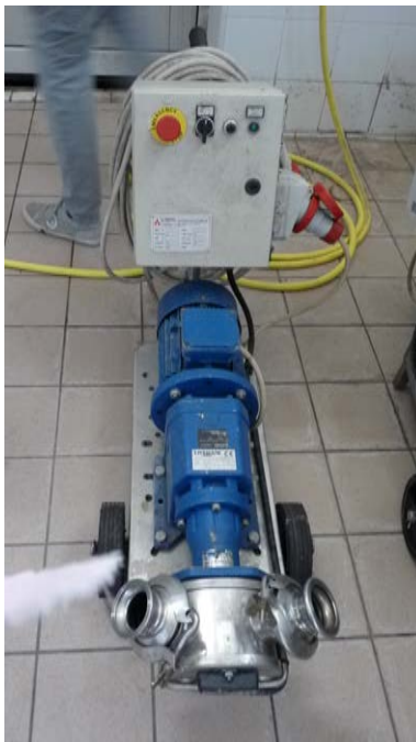
41A Pompa centrifuga da travaso Ditta Liverani portata 180 hl/ora dotata di inverter