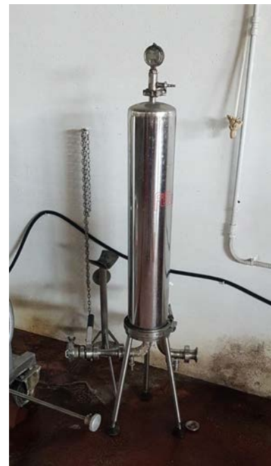
76 filtro a cartuccia per microfiltrazione