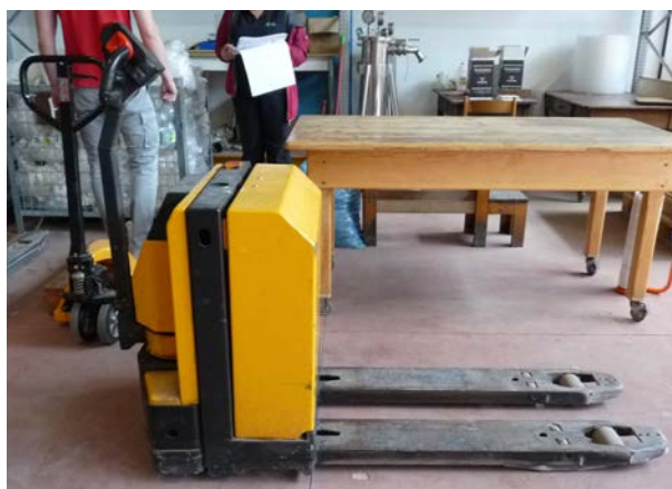
75 Transpallet elettrico Jungheinrich