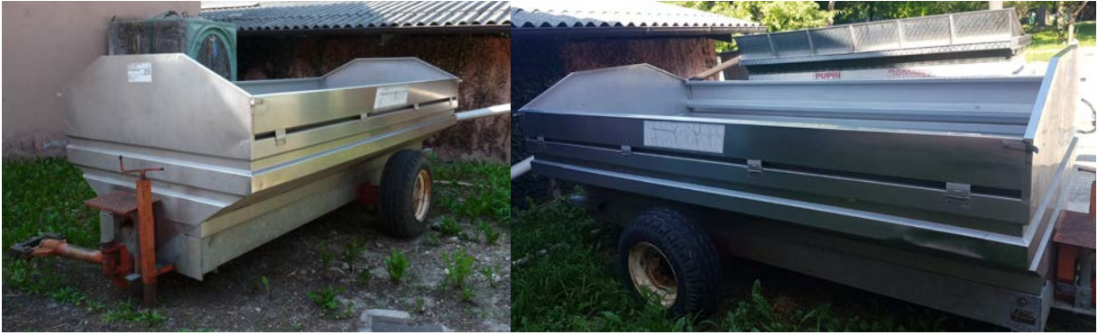
16 Carro per raccolta uva con scaricatore posteriore in acciaio inox produttore Friuli