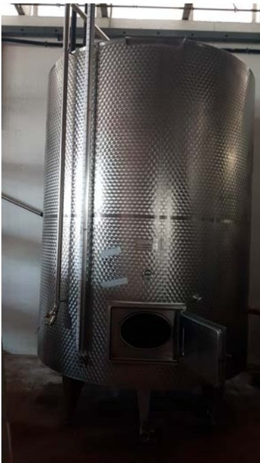
59 vasca inox refrigerata a glicole con doppia parete per cooling, capacità 100 hl