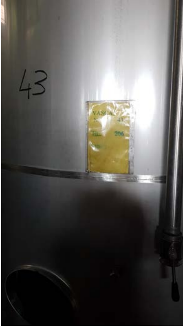
64 vasca inox capacità 300 hl