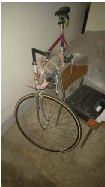
11 Bicicletta da corsa Aurora