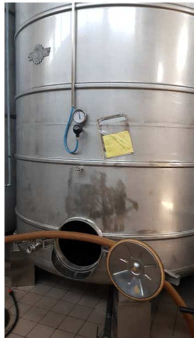
33 A-B-C: Vasche in acciaio inox AISI 316 (con Molibdeno) refrigerate Ditta Padovan modificate per uso enologico