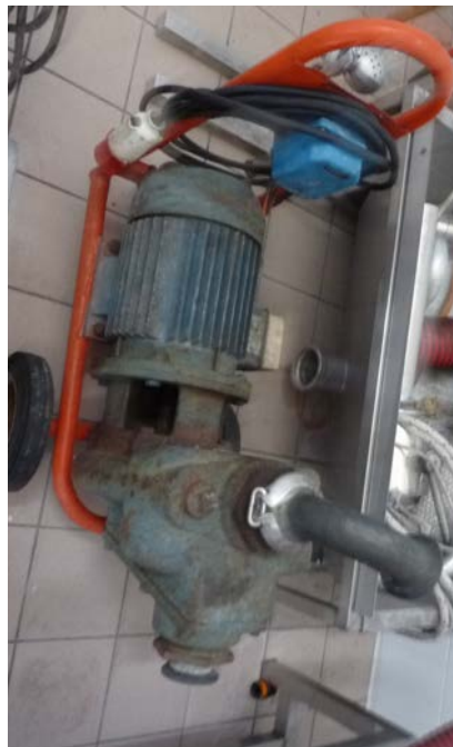
41B Pompa centrifuga da travaso Ditta Liverani portata 180 hl/ora