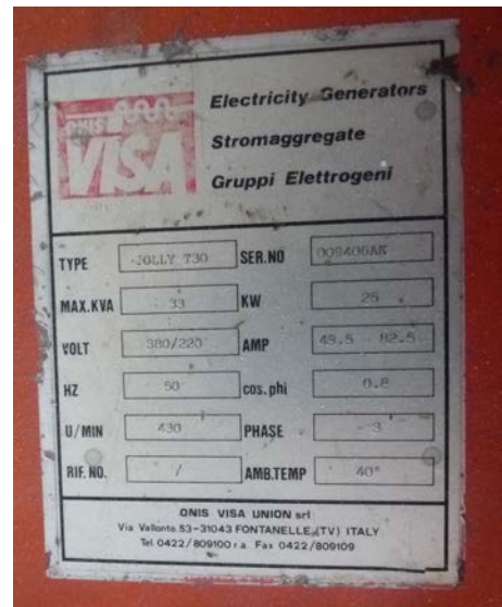
51 Gruppo elettrogeno VISA da 30 kW da attaccare alla pdp del trattore