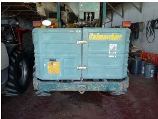
45 carrello elevatore Italmacchine Lift 2507 1 ^ immatricolazione 1995