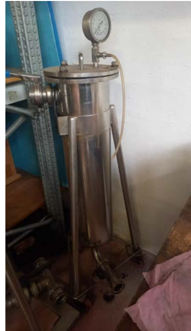
74A filtro a sacco o a manica