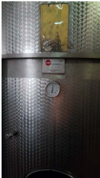
60 A-B vasche inox refrigerate a glicole con doppia parete per cooling, capacità 150 hl