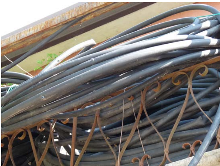
15 Ala gocciolante in polietilene stimate circa 35 bobine da 400 m. Conservate all'aperto