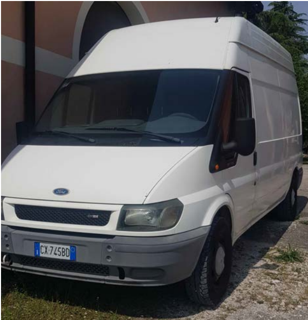
2A - Ford Transit 350 L. Van 2.0 colore bianco. Anno 1 a immatricolazione 2005. Scadenza revisione: 08.2023