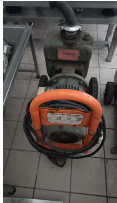
41C Pompa Pulipomp per lavaggio vasche