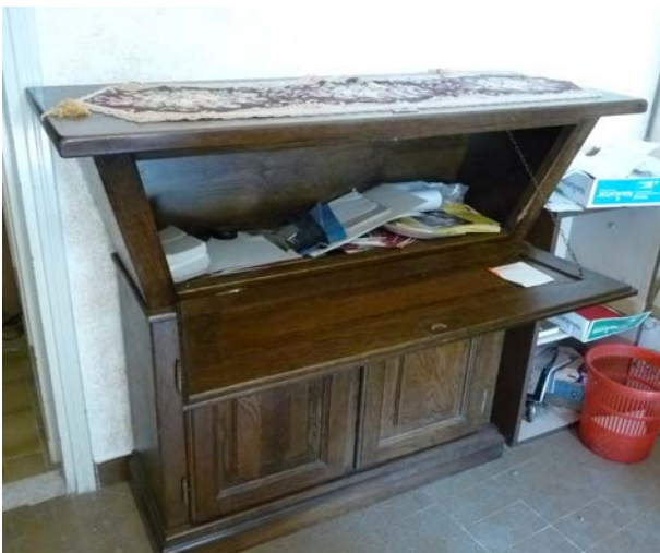
3A - madia in legno con anta ribaltabile e n. 2 ante piene