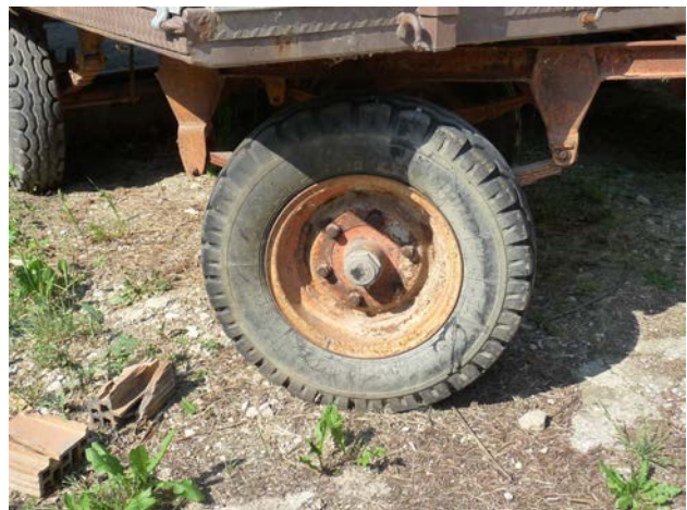
17A Rimorchio agricolo Moro targato TV3118 immatricolato il 12.06.1976 con libretto UMA