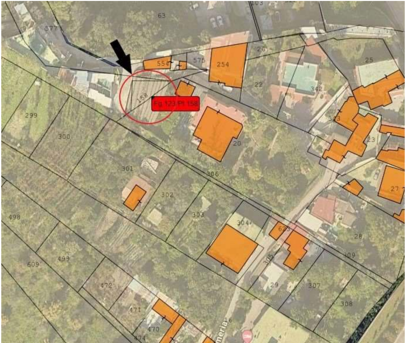
Inquadramento terreno Foglio 123 Particella 158