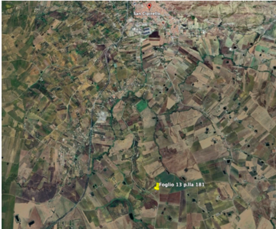
Ortofoto satellitare

Stimatrix forMaps ( All. 2 ), riscontrando la corrispondenza tra quanto pignorato e la situazione reale dei luoghi.