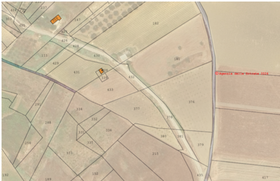
Sovrapposizione ortofoto attuale e mappa catastale tratta da Stimatrix forMaps